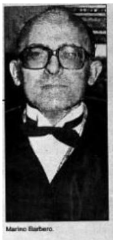
Fig. 1