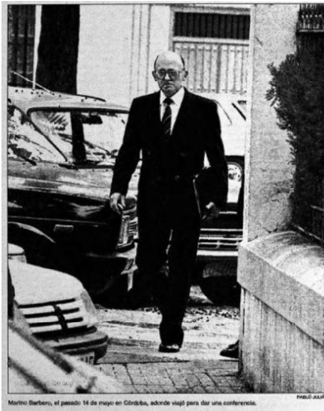
Fig. 4