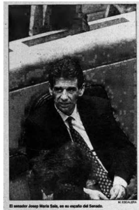
Fig. 5