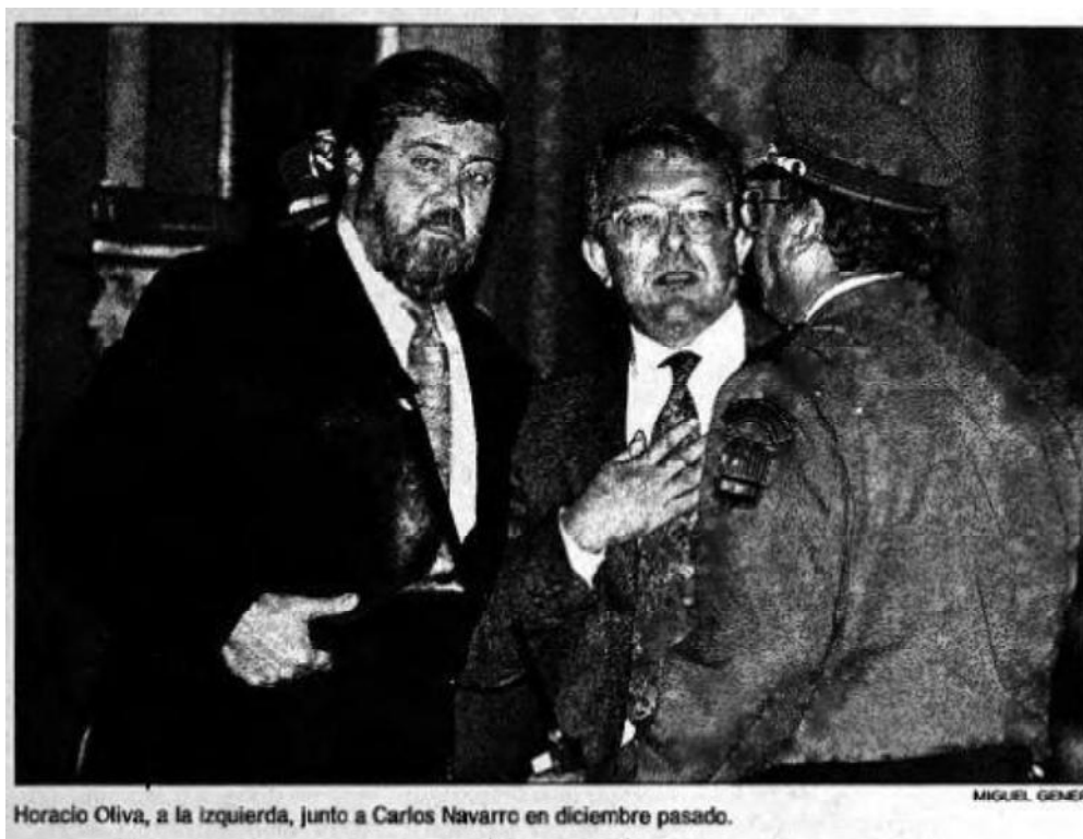
Fig 3.