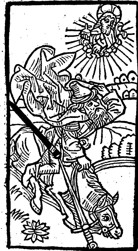
De appetenda discretionē.

ne forte inuacium curretem aut cūcūrissem. Quis ergo tam presumptor et cecus sit qui se audeat suo iudicio ac discretioni committere. cuius uas electionis indignisse coapostolorum suorum se collatione testetur. Unde manifestissime comprobatur. ne a domino quidem uiam perfectionis quempiam promereri. qui habens unde ualeat erudiri. doctrinam seniorum. uel instituta contempserit. paruipedes illud eloquium quod oportet diligentissime custodiri. Interroga patrem tuum et annuntiabit tibi. seniores tuos et dicent tibi.