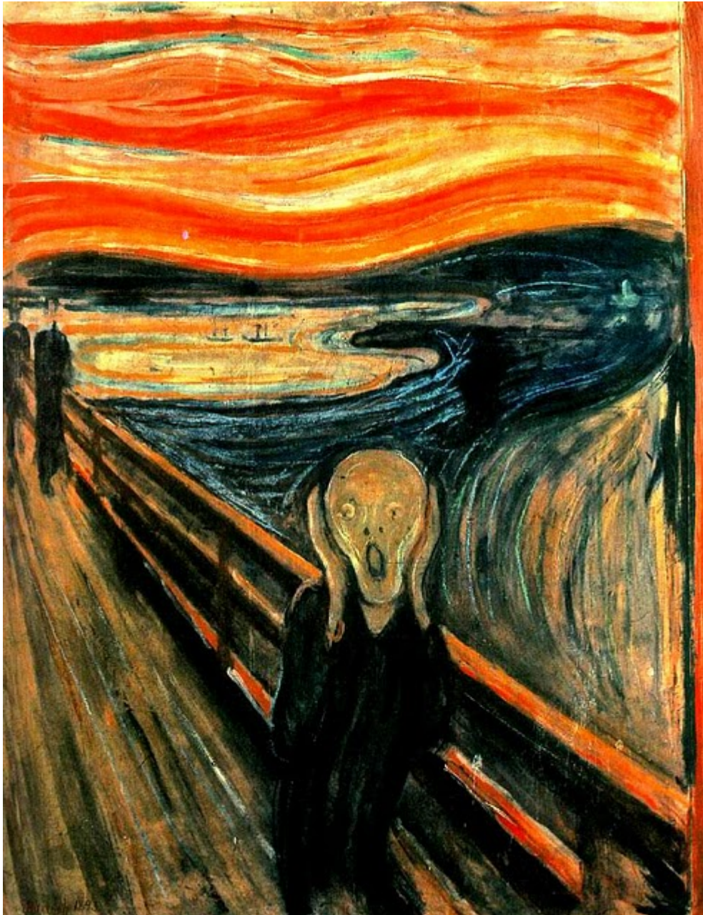
"El grito" ( Skrik ) Edvard Munch (1893). Galería Nacional de Oslo.