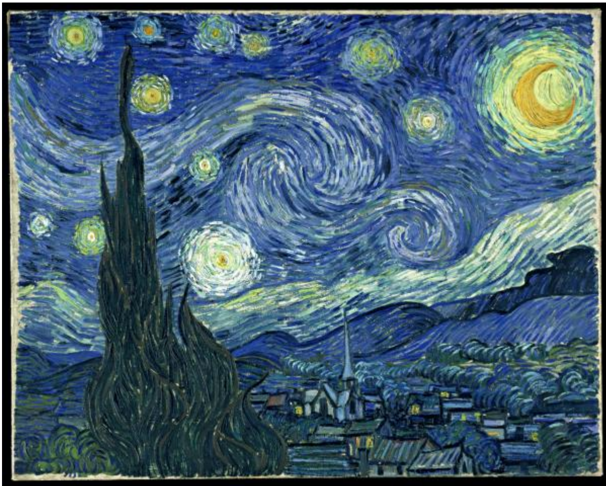
"La noche estrellada" ( De sterrennacht ) Vincent van Gogh (1889)