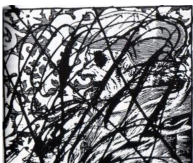
Ilustración 7: Erasmio y Sebastian Münster censurados por la Inquisición. Ejemplar de la Cosmographia de Münster (Basilea, 1550) conservado en la Biblioteca Nacional de Madrid

Los párrafos e imágenes eliminados solían ser una acción hecha por el corrector, la cual venía determinada por el Índice de libros expurgados y quedaba manifiesta con la supresión de párrafos. Las técnicas más comunes eran las tachaduras a mano sobre el impreso, los recortes y mutilaciones, pegando papeles que cubrían en su totalidad el texto.