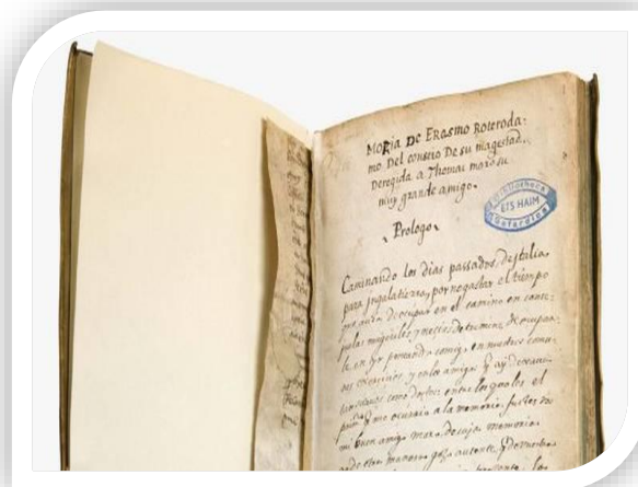
Ilustración 8: Ejemplo de mutilo en un ejemplar antiguo. Fotografía pública.

La realización de mutilación de ejemplares, más comúnmente cuando eran capítulos muy largos o textos completos, además de la eliminación de imágenes consideradas inmorales. Estas se realizaban mediante tachaduras, principalmente en senos, cuerpos de mujeres, niños desnudos, símbolos fálicos, figuras amorfas o con alusiones demoníacas..., aunque la mayoría de estas supresiones se realizaban en las portadas y no así en las ilustraciones.