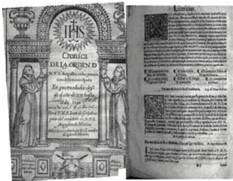
Ilustración 1: ADABI (2017). Vestigios de la Censura eclesiástica en los libros antiguos. Disponible: http://cort.as/xa23