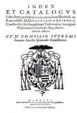
Ilustración 3: Portada del Índice de libros prohibidos Edición de 1583.

Antes de hablar de las técnicas de Censura en Libros deberemos de hacer una referencia más incisiva al Índice de libros prohibidos (en latín, desde 1612, Index Librorum Prohibitorum et Derogatorum ); se trata de la relación de libros establecida por la Inquisición española cuya difusión y lectura estaba prohibida en los territorios de la Monarquía Hispánica; contenía nombres de autores cuyas obras estaban prohibidas en su totalidad, así como algunas otras obras aisladas de otros autores o anónimas. Este se vio actualizado