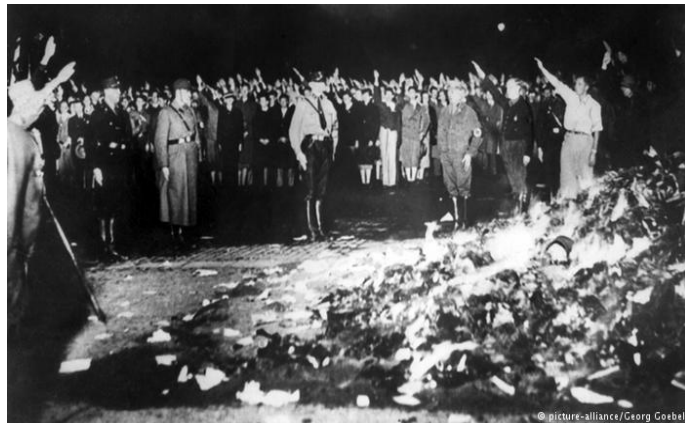
Ilustración2: Deutsche Welle (2017). Fotografía: Quema de libros en Opernplatz. Disponible en http://cort.as/xa1C

Uno de los hechos más atroces cometido contra los libros, fue producto del hombre, el 10 de mayo de 1933 el Ministro de Ilustración Pública y Propaganda Joseph Goebbels 11 reunió a más de 40.000 personas en la antigua plaza de Opernplatz que fueron testigos de la quema de más de 20.000 ejemplares que habían