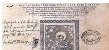
Ilustración 4: Ejemplo de edición corregida varias veces

Los volúmenes eran corregidos varias veces, de ahí que se encuentren diversas notas de expurgo en las que cambian fechas, nombres... etc.