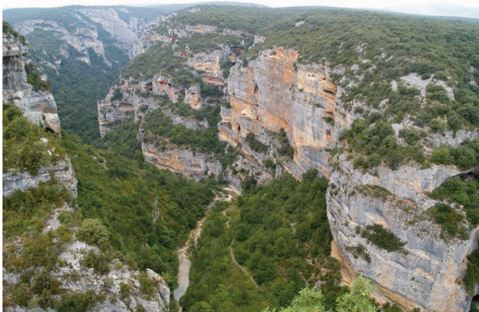
FIG. 1. Schematic art in Vero/Choca river (Lecina, Huesca). 1. Huerto Raso II; 2. Gallinero; 3. Escaleretas; 4. Lecina Superior; 5. Fajana de Pera; 6. Fajana de Pera superior