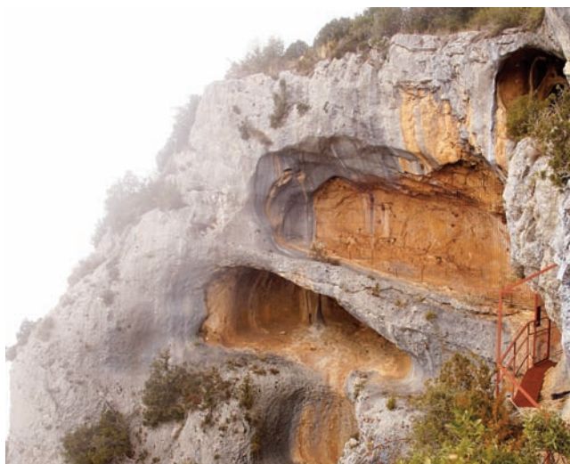
FIG. 2. Schematic art in Mallata rockshelter, Vero river, (Lecina, Huesca)