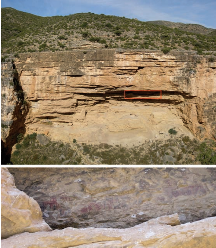
FIG. 4. Schematic art in Los Estrechos, Martín river (Albate del Arzobispo, Teruel)