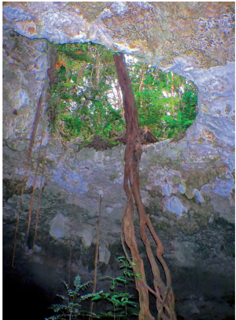
Figura 3. Cenote de abertura pequeña por la que entran las raíces de la exuberante vegetación circundante.

circular se debe a que el borde del cráter constituye una zona fracturada con múltiples fallas, que es más propicia al desarrollo de los cenotes por su mayor permeabilidad. El gran interés del anillo de cenotes es que constituye la única evidencia en superficie del cráter que se encuentra enterrado en el norte de la península de Yucatán