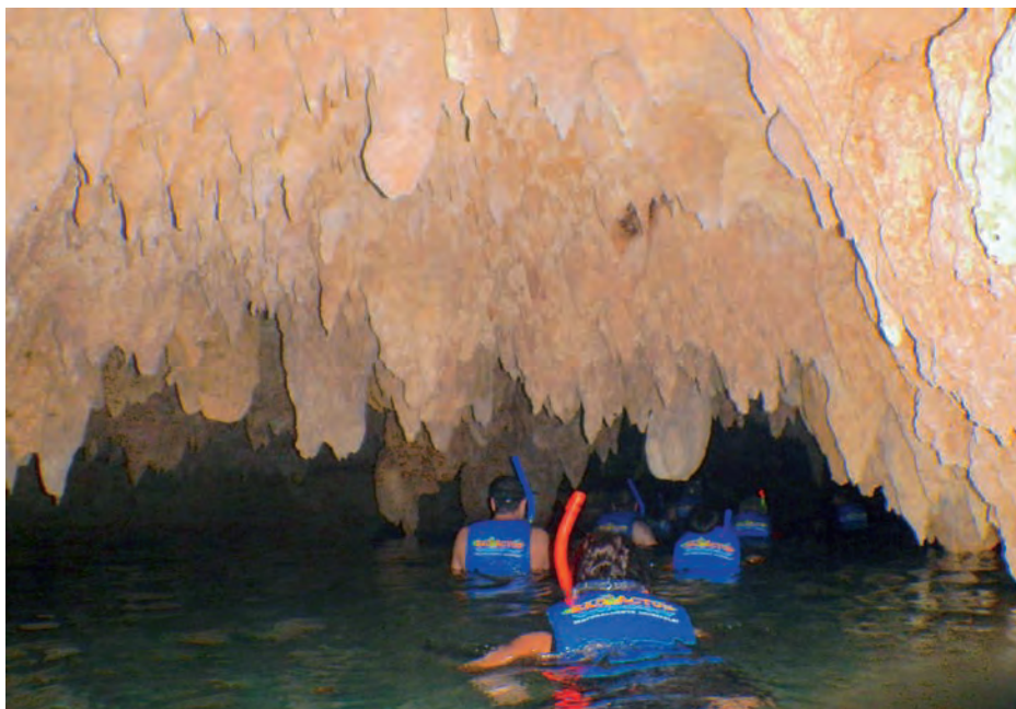
Figura 5. Turistas explorando las cuevas y galerías del cenote Sac Actún.

Los cenotes se disponen en un semicírculo de 160 km de diámetro y una anchura de 5 km. Se formaron preferentemente en las paredes internas del anillo principal del cráter que alcanza unos 180 km de diámetro. Según algunos el cráter podría alcanzar un diámetro máximo cercano a los 300 km, pero las anomalías de gravedad y los cenotes indican que no hay anillos más allá de los 170 km. Solo otro pequeño trozo de anillo de cenotes se encuentra exteriormente aumen-