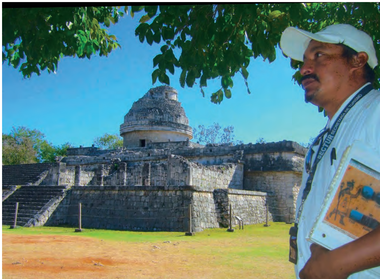
Figura 8. Guía maya explicando las características de las ruinas de Chichen Itzá.

Los cenotes albergan restos de la civilización maya, las cuevas y galería con estalactitas y estalagmitas ahora están anegadas al haber subido el nivel del mar y consecuentemente el nivel freático. Aparte de servir para suministrarles agua, los cenotes han tenido un papel relevante en la cultura de esta civilización, al parecer los mayas creían que las cuevas constituían la entrada al inframundo del miedo gobernado por dioses y demonios, que controlaban las enfermedades y la muerte. También suponían que Chaac el dios de la lluvia habitaba en las profundidades. Los mayas creían que podían comunicarse con los dioses y apaciguarlos arrojando valiosos objetos