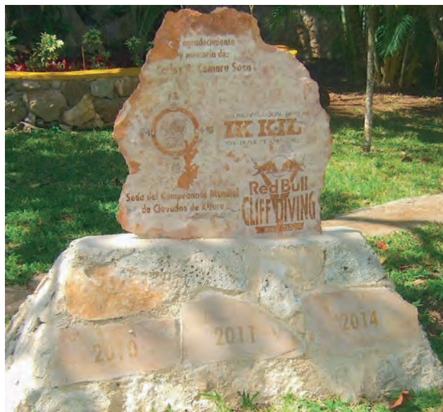
Figura 7. Inscripciones conmemorativas de los campeonatos mundiales de Clavados de Altura en el cenote Ik Kil.

de metal. Era una sociedad profundamente espiritual, que rendía culto a muchos dioses. Estas divinidades representaban las fuerzas de la naturaleza, los ciclos de la Tierra y el Cosmos. Realizaban ceremonias religiosas de sacrificios humanos para aplacar a los dioses. Desde el año 900 se conoce poco de los Mayas, los registros