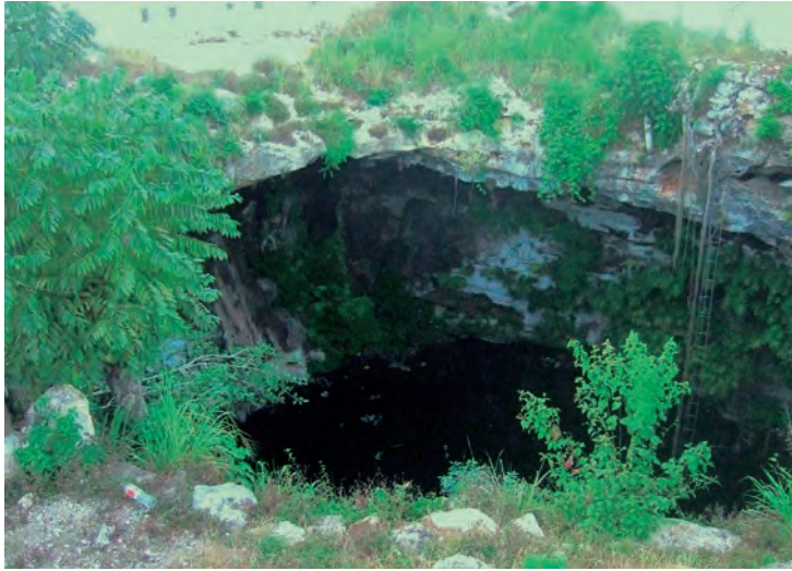
Figura 2. Cenote de abertura grande en las proximidades de X'Tut.