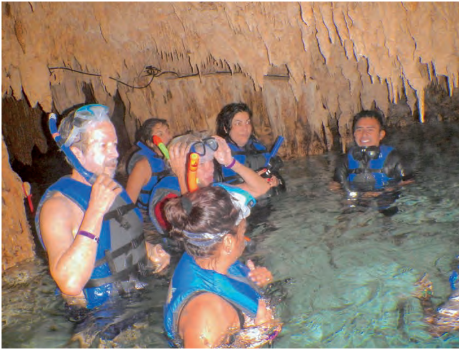
Figura 4. Guía impartiendo las instrucciones para explorar el cenote Sac Actún.

y sumergido en el sur del golfo de México.