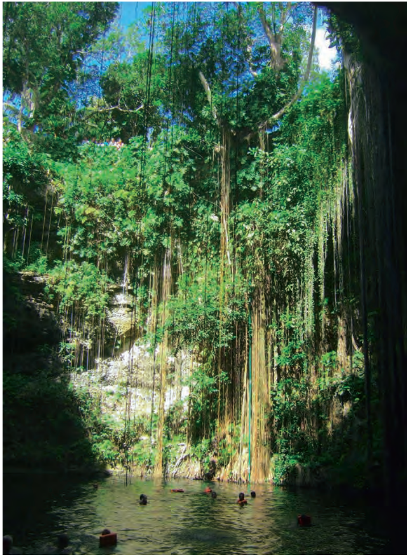
Figura 6. Turistas bañándose en el cenote Ik Kil.

han formado en los alrededores de Zaragoza.