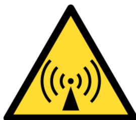
Figura 6. Señal genérica de riesgo de origen eléctrico.