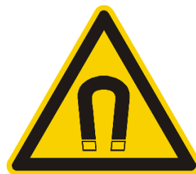
Figura 3. Señal de advertencia de exposición a campos magnéticos intensos.

Cuando el equipo vaya a ser utilizado, el operario deberá delimitar un área en torno al lugar de trabajo a una distancia de 1,5 m del equipo, que se corresponda con el área delimitada por los niveles de referencia de la Recomendación del Consejo, de acuerdo con el manual de instrucciones. En cualquier caso, cuando no se pueda medir con exactitud su tamaño, el área deberá cubrirse por exceso. Esta zona se demarcará mediante una cinta amarilla y negra sobre postes portátiles.