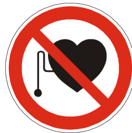
Figura 4. Señal de acceso prohibido a personas con implantes médicos (marcapasos).

Debe informarse en particular de la prohibición a los trabajadores con implantes médicos activos y embarazadas de acceder a las zonas delimitadas. Esta información deberá ser dada a todos los trabajadores, recalcando su importancia, puesto que ambas condiciones son privadas y no tienen por qué ser conocidas por el responsable de prevención. Adicionalmente, deberá señalizarse sobre los postes de demarcación este riesgo específico, por ejemplo, mediante la señal de la figura 4.