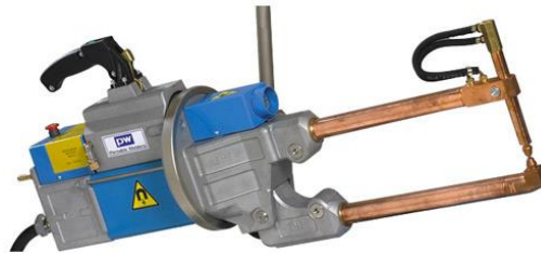
Figura 1. Equipo de soldadura por puntos portátil.

En este caso, el fabricante del equipo proporcionó incluido en el manual del equipo una evaluación de los riesgos de este, con referencia al riesgo por exposición a campos electromagnéticos. Tal y como recomienda la guía de la Comisión Europea, esta evaluación especifica que el equipo puede suponer un riesgo para trabajadores que lleven marcapasos y para trabajadoras embarazadas y el nivel de riesgo se representa mediante un esquema en el que se indica la distancia relativa en la que la exposición alcanza los valores de los niveles de acción y los niveles de referencia establecidos por la Recomendación del Consejo, de 12 de julio de 1999, relativa a la exposición del público en general a campos electromagnéticos (0 Hz a 300 GHz).