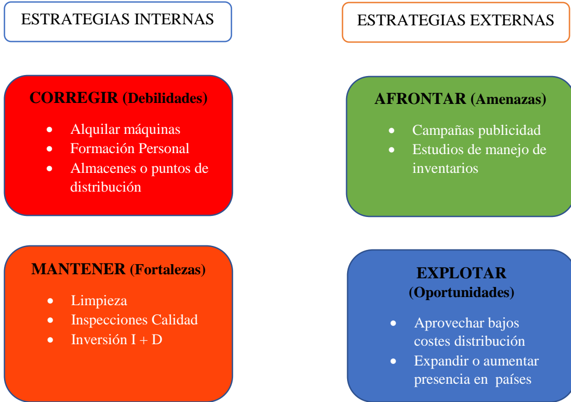
Tabla 2: Análisis CAME