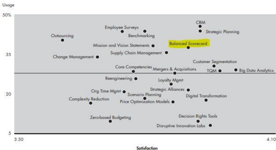
Gráfica 1: 2014 Utilización y satisfacción