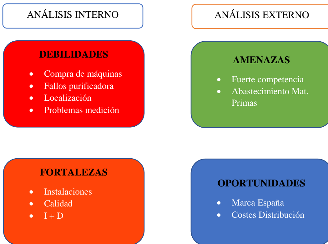
Tabla 1: Análisis DAFO