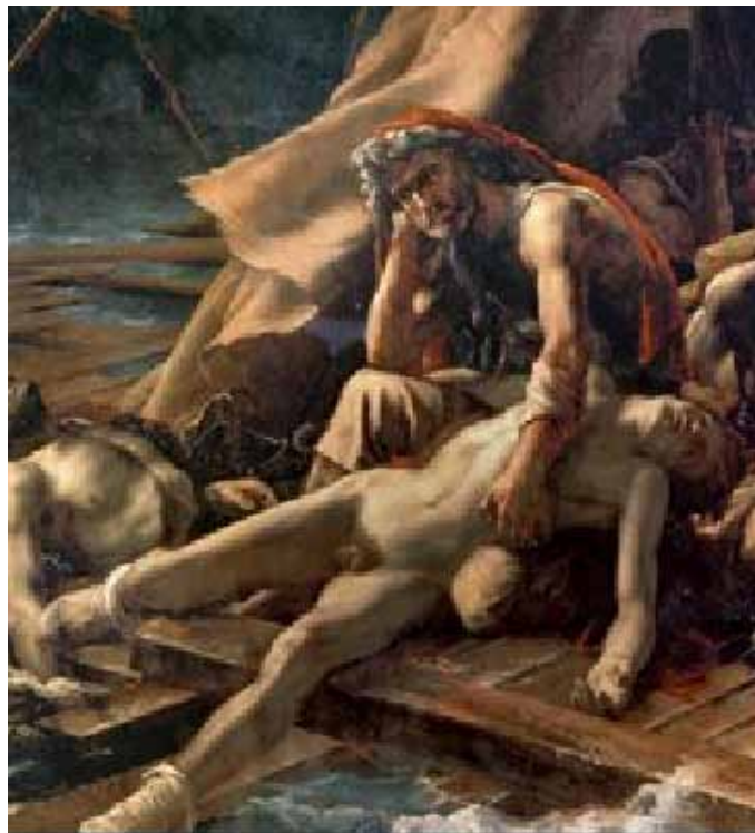
Figura 2. Detalle de Escena de un naufragio en que aparece el anciano que sostiene un cadáver y que, en vez de dirigirse hacia el bergantín, mira en dirección al público.