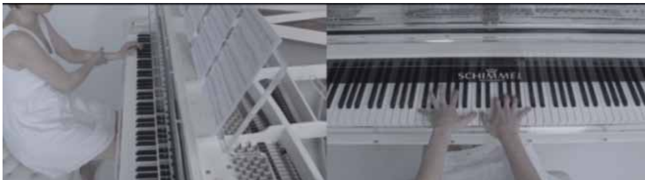
Rego Robles, Miguel Ángel (2016). Post-Contingent Coherence. Still Frame.

En esta pieza audiovisual, una pianista toca el Nocturno Op.55, No.1 en Fa Menor de Frédéric Chopin. La pianista sufre una enfermedad poco común llamada anosognosia, dolencia que suele producirse por un daño en el lóbulo derecho del cerebro. Además, estas perturbaciones pueden causar parálisis lateral izquierda en el cuerpo.