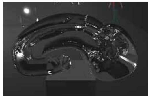
Rego Robles, Miguel Ángel (2017). Soliloquium Boceto 3D de escultura de vidrio