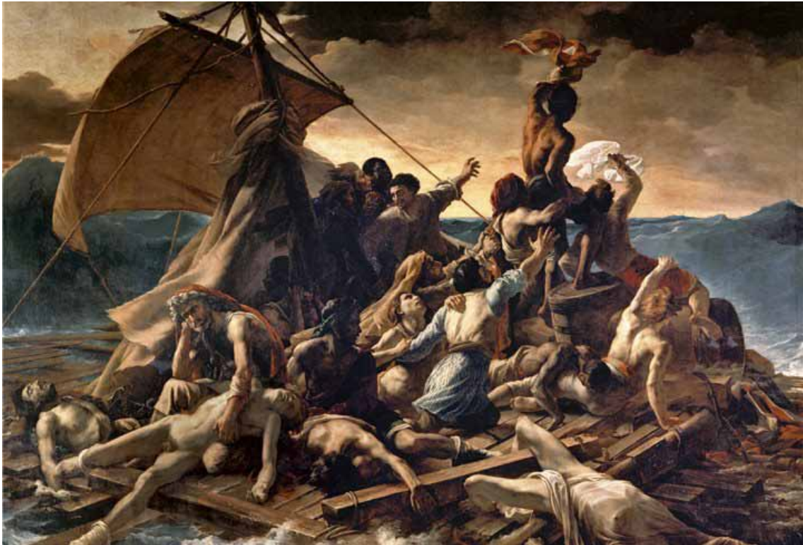
Figura 1. Théodore Géricault (1819), Escena de un naufragio , Museo del Louvre.