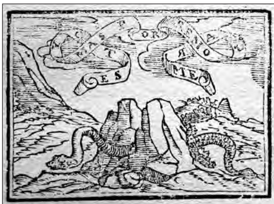
Fig. 24. Sebastián de Covarrubias, Emblemas morales . Cent. II, emb. 93.