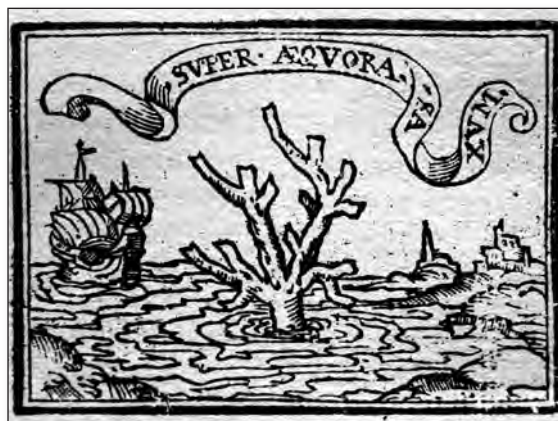
Fig. 16. Sebastián de Covarrubias, Emblemas morales . Cent. I, emb. 41.

pájaros; en el epigrama enseña que, tras formar los padres en la religión y en la vida al hijo, éste debe despegarse de ellos, incluso aunque su madre lo quiera mucho, y lo compara con el pájaro que una vez emplumado se arroja del nido paterno y busca un lugar propio. En la glosa insiste en que los hijos que no saben apartarse del regalo de sus padres son de ánimo vil y apocado y se convierten en viciosos y holgazanes, y, entre otras cosas, difaman la honra de doncellas y mujeres muy recogidas y son alborotadores del pueblo; no obstante, la justicia no sabe cómo hacerles frente por no contrariar a sus padres y deudos, hecho que nos hace tener en cuenta que se refiere a familias con una posición destacada como hemos visto antes en los emblemas dedicados a la paternidad. Da una solución al problema y es que los mismos padres los fuercen a marcharse a Flandes, Italia y las dos Indias o al mundo en general, que es muy amplio, y donde podrán convertirse en hombres. Termina señalando de nuevo la semejanza de la