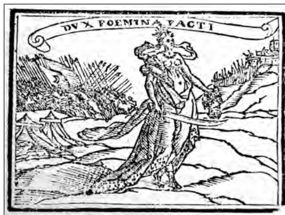
Fig. 2. Sebastián de Covarrubias, Emblemas morales . Cent III, emb. 49.

Termino este apartado con la cent. II, emb. 64 [fig. 3] que Covarrubias dedica al tema del hermafrodito. Este emblema, con el lema « Neutrumque et utrumque » (ni una cosa ni la otra y ambas), que toma de Ovidio, Metamorfosis IV, 379, donde se narra la historia de Hermafrodito, 5 al que se refiere nuestro autor en el epigrama y en la glosa, le da pie para mencionar a una mujer real de su época, 6 al decir al final de la