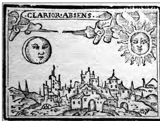
Fig. 7. Sebastián de Covarrubias, Emblemas morales . Cent. II, emb. 42.

Nuestro autor no solo se refiere a la mujer casada sino que también trata sobre el marido y se ocupa de temas relativos al matrimonio que afectan a ambos cónyuges. A la casada dedica la cent. II, emb. 41 [fig. 7], donde, bajo el mote « Clarior absens » (más resplandeciente cuando está ausente), en la pictura aparecen la luna y el sol, simbolizando a la mujer y el marido respectivamente, comparación que se halla en Plutarco; 11 el epigrama señala que la fe