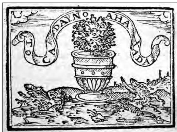
Fig. 10. Sebastián de Covarrubias, Emblemas morales . Cent. I, emb. 53.

Al marido se dirige en la cent. I, emb. 53 [fig. 10], donde habla del trato que debe a su mujer, sirviéndose de la albahaca para significarlo. En el grabado representa una planta de albahaca, bajo el mote «Tocada y no ahaxada», mostrándose en el epigrama partidario