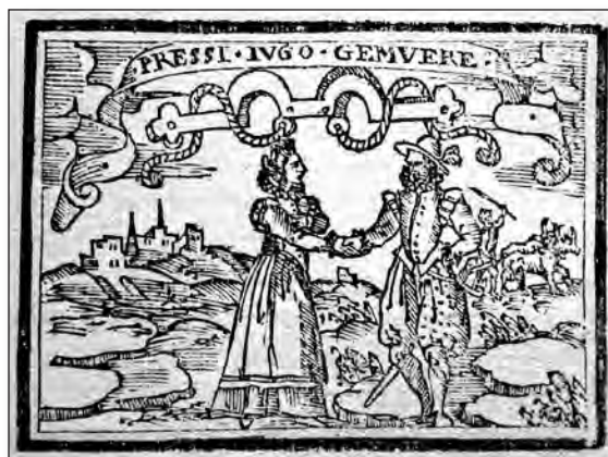
Fig. 8. Sebastián de Covarrubias, Emblemas morales . Cent. II, emb. 46.

de las rencillas dentro del matrimonio y considera que si están basadas en algo grave resulta penoso y supone vivir con descontento y peligro; no obstante, aconseja que si no son