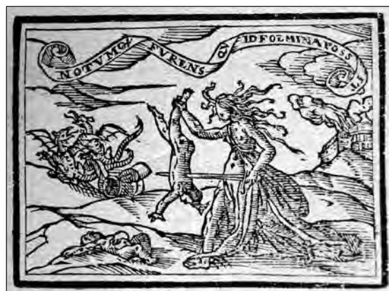
Fig. 11. Sebastián de Covarrubias, Emblemas morales . Cent. III, emb. 80.

En la cent. III, emb. 80 [fig. 11], nos dice qué puede llegar a hacer una mujer, cuando contrariada, muestra toda su furia. En el epigrama menciona que no existe furor que se iguale al de la hembra, que irritada puede llegar a matar al marido y al padre, e, incluso, desmembrar a su pequeños hijos, sirviéndose como ejemplo de la figura de Medea. Efectivamente, bajo el mote « Notumque furens quid femina possit » (sabido es qué puede hacer una mujer furiosa), que toma de Virgilio, Eneida V, 5-6, el grabado nos muestra a Medea, con el cabello revuelto como una Furia, con uno de sus hijos muerto en el suelo y con el otro pendiente de su mano mientras le clava una espada, señalándose al final del epigrama que ello no parece posible, aunque ésta fuera Alecto, Tisífone o Megera; los nombres que cita son precisamente los de las Erinias griegas con las que se identifican las Furias romanas. En la glosa muestra que cuando se contraria el amor de una mujer la saña de ésta es tan grande que su venganza le lleva a matar a los hijos para que paguen por sus padres, por lo que pone