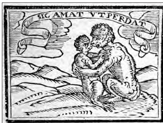
Fig. 17. Sebastián de Covarrubias, Emblemas morales . Cent. II, emb. 87.

En la cent. I, emb. 41 [fig. 16], bajo el mote « Super aequora saxum » (piedra sobre las aguas), con un grabado donde aparece en primer plano un coral en el mar delante de un barco y al fondo un faro, el epigrama compara el coral que en el mar bajo las aguas profundas es blando, pero sobre las aguas se convierte en dura piedra, con el joven que en su patria se dedica a amoríos, si se lanza al otro lado del mar. En la glosa de la misma manera en primer lugar habla del coral, citando como fuente a Teofrasto, y luego se vuelve a referir a los caballeros mozos que viven regalados de su padres, que si se les compele a salir a otros reinos se endurecen con el trabajo y cambian su condición.