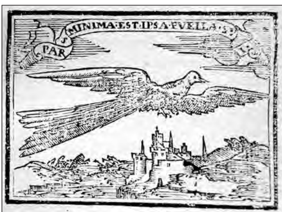
Fig. 25. Sebastián de Covarrubias, Emblemas morales . Cent. III, emb. 72.

275, donde se cuenta que las mujeres arreglan con refinamiento los desperfectos de los años para conseguir con sus cuidados no parecer viejas y otra de Virgilio, Eneida II, 469-472, en la que se hace alusión a que la culebra pierde su piel a la vez que su vejez.