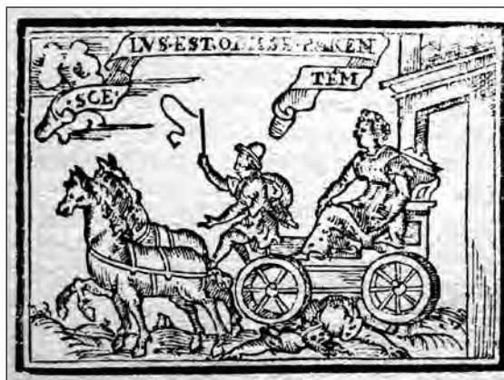
Fig. 6. Sebastián de Covarrubias, Emblemas morales . Cent. II, emb. 29.

jer, menciona que la hija del rey Servio Tulio mató a su padre, y estando su cuerpo tendido en una calle pasó con su carro sobre él, hollándole los caballos y las ruedas. En la pictura representa la escena que se acaba de describir, con el cochero guiando el carro, y en el epigrama se refiere a esta misma acción, llamando a Tulia mal nacida, después de señalar que Solón no castigó al hijo patricida, al considerar que este hecho era inconcebible, como repite en la glosa. El mote « Scelus est odisse parentem » lo toma de Ovidio, Metamorfosis X, 314, pero no tiene relación con Tulia, ya que se documenta en el mito de Mirra que enamorada de su propio padre cometió incesto, por ello lo que Ovidio dice es que odiar a un padre es un crimen, pero amar a un padre como hace Mirra es un crimen mayor. Fuente fundamental para esta historia, aunque no se cite, es el historiador de la época de Augusto, Tito Livio, Historia de Roma desde su fundación I, 48, que cita a Tulia como instigadora de la muerte de Servio por parte de Tarquinio, su marido, y cómo deteniéndose el cochero ante el cadáver de su padre hizo que pasara el carro por encima de su cuerpo. Frente a esta acción impía de matar a un padre, en la cent. II, emb. 89, Covarrubias presenta a la cigüeña como símbolo de la piedad filial.