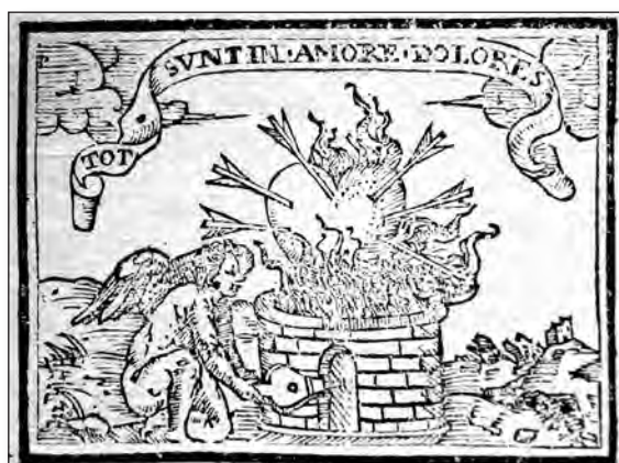
Fig. 19. Sebastián de Covarrubias, Emblemas morales . Cent. III, emb. 63.

soplando con unos fuelles, y encima el lema « Tot sunt in amore dolores » (tantas son en el amor las penas), tomado de Ovidio, Arte de Amar II, 519. En el epigrama se refiere a la mujer hechicera que ejerce sus artes para que el hombre consienta ante la mujer que lo ama, pero ésta no repara en que el amado pueda morir, si no consiente; además, aunque consienta el enamorado, el amor le va a dar mil dolores. En la glosa insiste en el arte de la hechicera y considera lo que ésta hace para afligir al hombre que huye de la amistad de una mujer --clavar un corazón de cera con muchas agujas, diciendo ciertas palabras, que hacen el efecto-- como una superstición y piensa que es una mentira y un embuste; asimismo, señala que si de la acción de la hechicera surge algún efecto, éste es debido a la acción del diablo, con el que tienen pacto este tipo de mujeres, si bien permitiéndolo dios. Al referirse a que los enamorados dicen muchas exageraciones y encarecimientos, entre ellos el que tiene el corazón atravesado por mil flechas, cita a Propertio y Terencio.