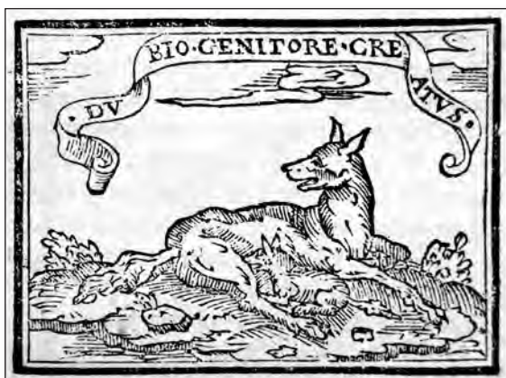
Fig. 13. Sebastián de Covarrubias, Emblemas morales . Cent. I, emb. 54.

En la glosa de la cent. I, emb. 62 [fig. 12], se dice que la tórtola es símbolo de la viuda que muerto su marido, pasa la vida en soledad, pero continúa señalando que el emblema lo aplica a los que disimulan su dolor con el lema «Cantando lloro». Efectivamente, en el grabado aparece bajo dicho mote una tórtola posada en la rama seca de un árbol. La tórtola es un ave que pertenece al orden de las palomas, que según algunos autores 13 guarda fidelidad a su pareja, de manera que cuando ésta se muere no se une a otra, razón por la que se le identifica con la viuda que no se vuelve a casar.