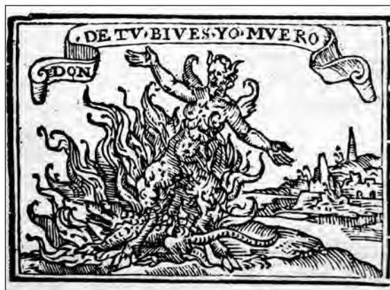
Fig. 18. Sebastián de Covarrubias, Emblemas morales . Cent. I, emb. 63.