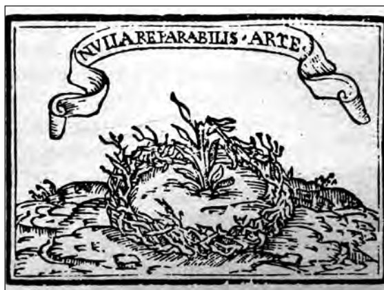
Fig. 4. Sebastián de Covarrubias, Emblemas morales . Cent. I, emb. 5.

Poco es lo que nos dice nuestro autor sobre la mujer núbil. En dos de los emblemas que se van a ver, aparece la doncella en un estado que antecede al de mujer casada, el papel fundamental de la mujer de su época, tal como documenta también en nuestros emblemas; en un tercero se muestra un ejemplo de mala hija. La cent. I, emb. 5 [fig. 4], está dedicado a la flor virginal, a la que ensalza en el epigrama, en el que también exhorta a los pechos virginales a no perderla, pues no puede ser reparada, haciendo alusión a ello el mote « Nulla reparabilis arte », 8 que forma parte de un dístico elegíaco de una de las Heroínas de Ovidio, en concreto la