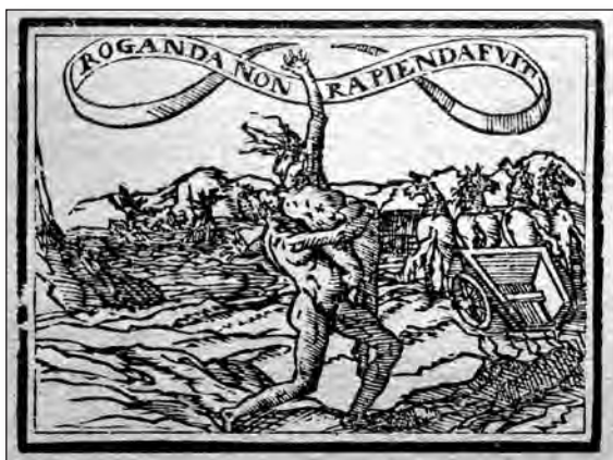
Fig. 5. Sebastián de Covarrubias, Emblemas morales . Cent. II, emb. 39.

La cent. II, emb. 39 [fig. 5], presenta en cierta manera, como en Catulo, la idea de que el padre y la madre entregan a la joven al marido. Luis Vives, por otra parte, también considera que nadie mejor que el padre para encontrar un marido apropiado para la hija. En concreto, Covarrubias critica en dicho emblema a quien rapta a una mujer sin su consentimiento en vez de pedírsela al padre; en la glosa se puede observar que en la época de nuestro autor era una práctica no inusual, pues tal como indica existen leyes tanto civiles como canónicas que castigaban esas conductas. En el grabado se