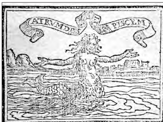
Fig. 21. Sebastián de Covarrubias, Emblemas morales . Cent. I, emb. 94.

En las fuentes latinas podemos encontrar los pensamientos que hallamos en estos emblemas; en Plinio el Viejo, Historia Natural XVI, 34, se documenta el hecho de que la hiedra ahogue a un árbol o derribe a un muro sobre los que se apoya. Horacio significa a la prostituta con la hiedra en dos composiciones con el aspecto negativo que se observa en los libros de emblemas, así en Odas I, 36, 17-20, y Epodos XV, 5-6. Con anterioridad a estos autores, ya en el siglo I a. de C., Catulo usa esta metáfora, pero sin valor negativo; en el poema 61, un epitalamio o canto de bodas, simboliza la feliz unión por el matrimonio del hombre y la mujer, y en este mismo poema también se sirve de la metáfora de la vid y el olmo para representar también esa unión feliz de los esposos, que se ha visto antes en su poema 62. En el siglo IV en una composición del mismo género que las anteriores de Catulo, los Versos fesceninos