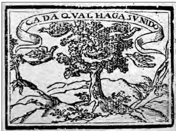
Fig. 15. Sebastián de Covarrubias, Emblemas morales . Cent. I, emb. 35.

VII, 2. Antes menciona que en tiempos pasados fue muy usado que los hijos que doncellas principales concebían clandestinamente, cuando los padres de ellas se enteraban, fuesen arrojados a algún desierto para que las fieras se los comiesen, aunque éstas más piadosas que los hombres los criaban. Sigue la glosa, sin duda haciendo alusión Covarrubias a su