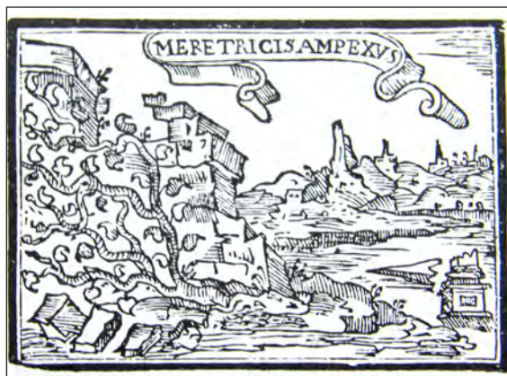
Fig. 20. Sebastián de Covarrubias, Emblemas morales . Cent. I, emb. 37.

A la hiedra significando a la ramera dedica la cent. I, emb. 37 [fig. 20], con el lema « Meretricis amplexus » (el abrazo de la meretriz), en cuyo grabado se representa un muro y la hiedra que terminará por derrumbarlo. En el epigrama compara el daño que causa la prostituta con sus dulces caricias y halagos con el que produce la hiedra que puede secar un árbol e incluso derribar un muro. En la glosa sigue insistiendo en simbolizar con la hiedra a la ramera, ya que ésta, cuando coge a alguien entre sus brazos, que parecen amorosos, no lo deja hasta que le ha consumido honra, hacienda, salud y vida; en la segunda parte en vez de