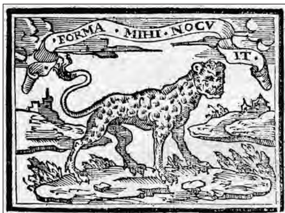
Fig. 22. Sebastián de Covarrubias, Emblemas morales . Cent. II, emb. 62.