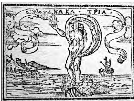
Fig. 1. Sebastián de Covarrubias, Emblemas morales . Cent. II, emb. 47.

El primer emblema que se va a tener en cuenta es la cent. II, emb. 47 [fig. 1] en cuya pictura , según indica en la glosa el propio Covarrubias, aparece una mujer sobre una concha, llevando en su mano un vaso de fuego, con el mote griego « Kaka tria » (tres males). En el epigrama, compuesto por una octava real como en el resto de los emblemas, señala que las tres cosas malas y dañosas son el mar, el fuego y la mujer, a la que considera un mal necesario para muchos. No obstante, a pesar de esta afirmación general de la maldad de las mujeres en la glosa dice que no es amigo de ultrajarlas y que a pesar de este proverbio u otros semejantes existen mujeres buenas y dignas de ser celebradas con eterna memoria.