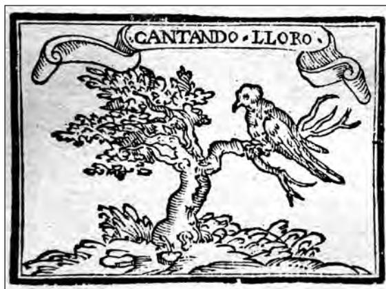
Fig. 12. Sebastián de Covarrubias, Emblemas morales . Cent. I, emb. 62.

En la glosa de la cent. I, emb. 62 [fig. 12], se dice que la tórtola es símbolo de la viuda que muerto su marido, pasa la vida en soledad, pero continúa señalando que el emblema lo aplica a los que disimulan su dolor con el lema «Cantando lloro». Efectivamente, en el grabado aparece bajo dicho mote una tórtola posada en la rama seca de un árbol. La tórtola es un ave que pertenece al orden de las palomas, que según algunos autores 13 guarda fidelidad a su pareja, de manera que cuando ésta se muere no se une a otra, razón por la que se le identifica con la viuda que no se vuelve a casar.