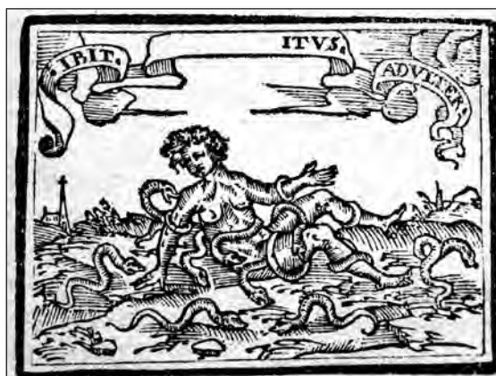
Fig. 14. Sebastián de Covarrubias, Emblemas morales . Cent. II, emb. 52.

En la cent. II, emb. 52 [fig. 14], también presenta el tema de la paternidad, con la idea de que el padre lo sea realmente, pero aquí en vez de censurar especialmente a la mujer, censura al hombre que abandona a los hijos que son los que sufren las consecuencias. En el grabado aparece un niño con serpientes, tanto enroscadas en su cuerpo como a su alrededor, relacionado con lo que se dice en el epigrama sobre la