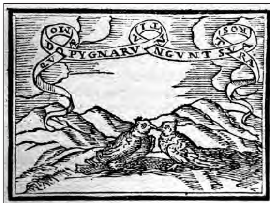
Fig. 9. Sebastián de Covarrubias, Emblemas morales . Cent. II, emb. 99.