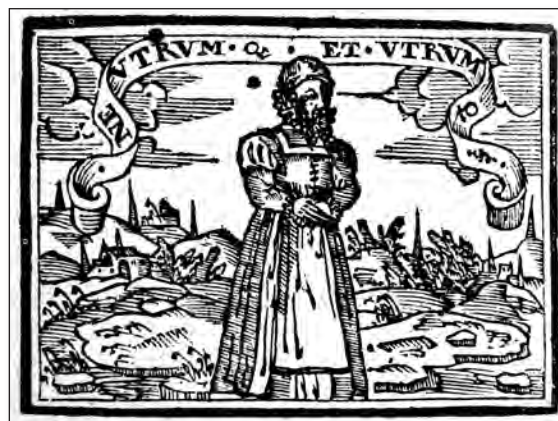
Fig. 3. Sebastián de Covarrubias, Emblemas morales . Cent. II, emb. 64.