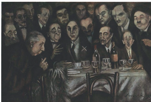
Francisco Sancha, “ Supuesto banquete al escultor Miranda ”, La Esfera , núm. 696, 7/IV/1927.