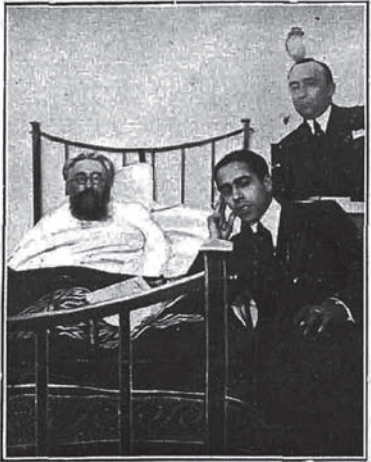
Don Ramón del Valle Inclán en el Hospital de Santiago