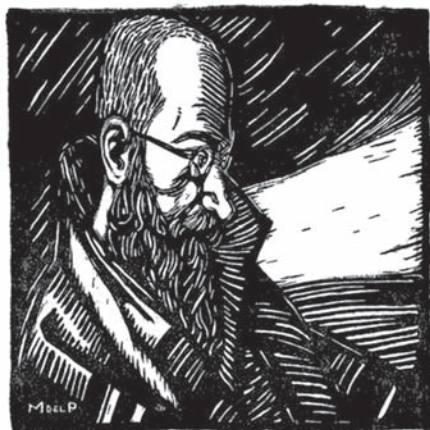
Moya del Pino, “Valle-Inclán”, La Pluma , núm. 32, enero de 1923.

Todo el número monográfico de La Pluma ofrece una galería de retratos literarios, complementarios de los anteriores, que podríamos analizar aquí como un modelo perfecto de homenaje. Me limito, sin embargo, a