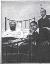
Don Ramón del Valle Inclán en el Hospital de Santiago

Don Ramón María del Valle Inclán ha estado internado en un sanatorio, desde el mes de septiembre. El león de pelo entrecisado tiene una cabeza imponente que dan a la cabeza aspecto de trago. Sus barbas fornidas y desliadas un pelo negro, en sus frentes le cubren como la lluvia un agua blanca.