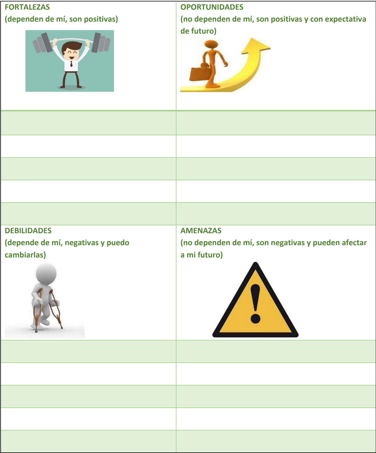
TABLA 16 FICHA DE ANÁLISIS DAFO