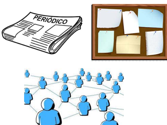
TABLA 15 HERRAMIENTAS DE BÚSQUEDA DE EMPLEO