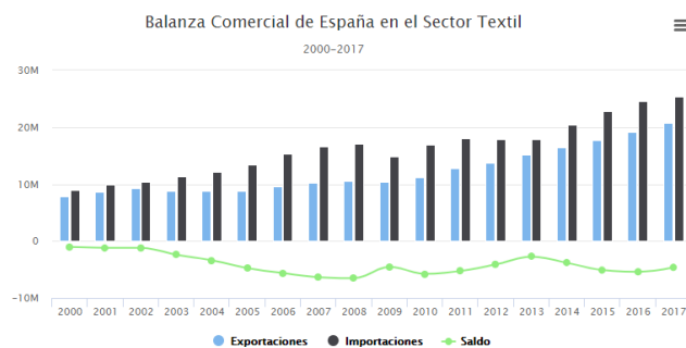
Figura 1. Balanza comercial española en el sector textil

El papel de la industria textil también es importante en nuestra balanza comercial. Como se observa en la figura 1, se puede afirmar que en lo que llevamos del siglo XXI el saldo de la balanza comercial en este sector ha sido siempre negativo. Las importaciones superan a las exportaciones, produciéndose un déficit que en los últimos siete años ha ido menguando, gracias al aumento de las exportaciones que han llegado a batir un récord en 2016, año en el que las empresas textiles vendieron al exterior por valor de 22.836,6 millones de euros, un 6,7% más que en 2015.