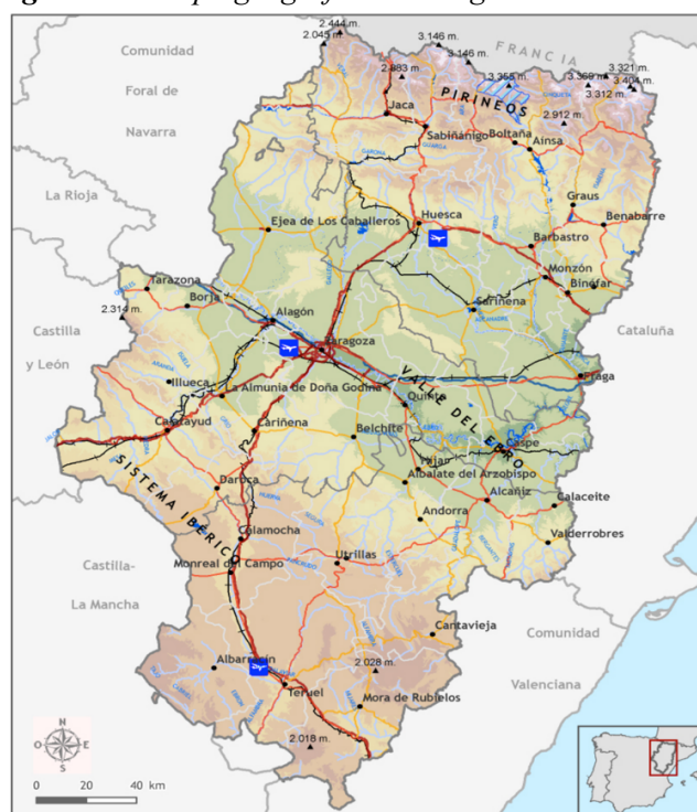
Figura 2.1. Mapa geográfico de Aragón.

Desde el punto de vista geográfico Aragón cuenta con dos cadenas montañosas que se extienden por el norte (Pirineos) y por el sur (Sistema Ibérico) dejando en la zona central el valle del Ebro. La región montañosa supone el 43,7% de la superficie de Aragón (figura 2.1).