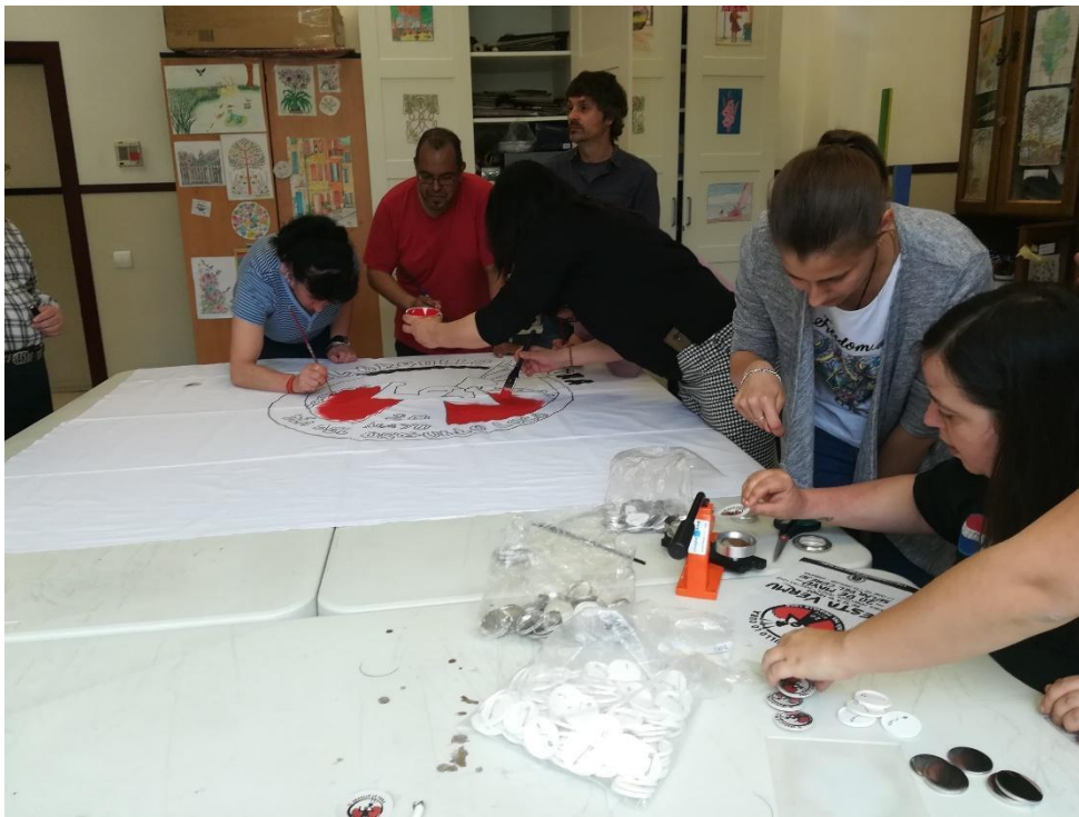
Usuarios participantes en el día del Orgullo Loco. Preparación de Pancarta y Chapas.