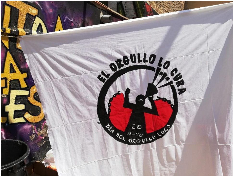
Pancarta elaborada por los participantes en el día del Orgullo Loco.