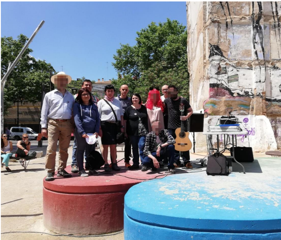
Usuarios participantes en el día del Orgullo Loco