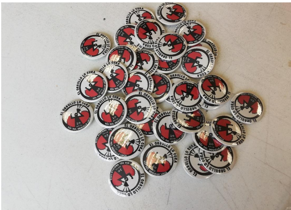
Chapas elaboradas por los participantes en el día del Orgullo Loco.