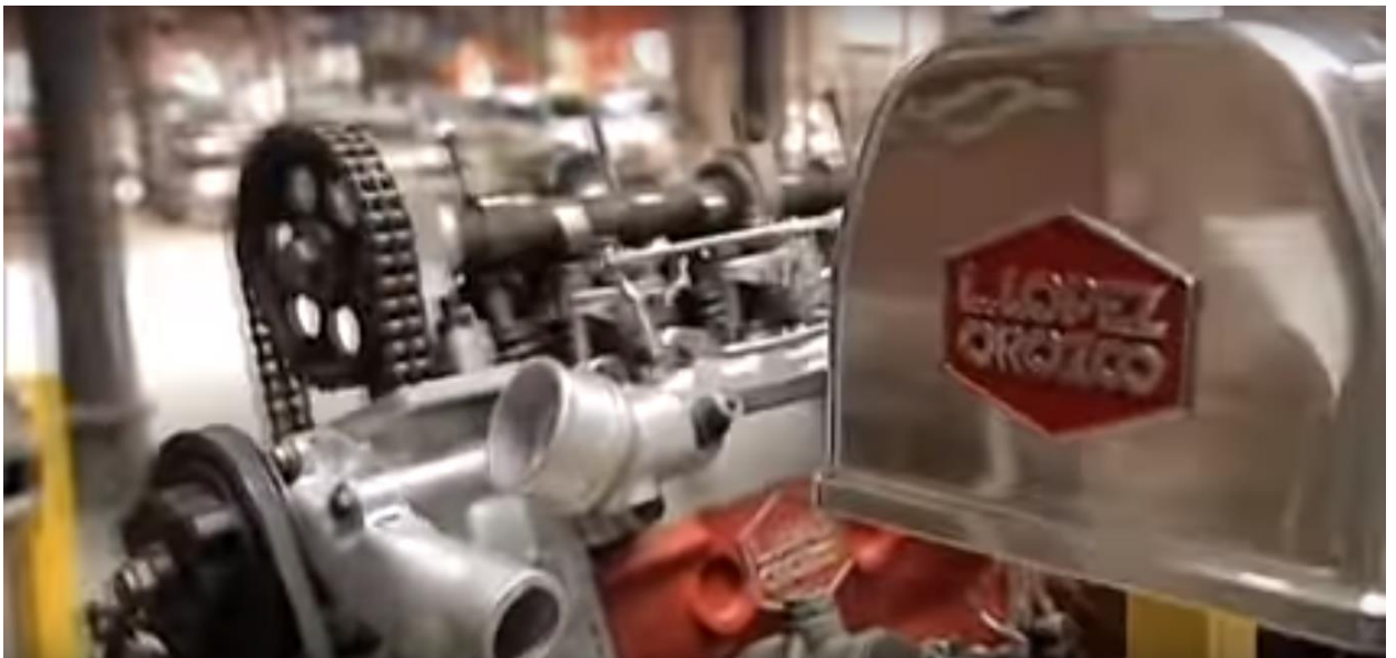
Figura 5: Nombre Orozco en la matriz del motor del Rastrojero. Argentina Latente (2007)

que los modelos y matrices mecánicas mostradas en el documental, fueron pensados para lograr hacer un motor netamente argentino. Seguido a esto, se muestra el nombre grabado sobre el molde metálico del motor fabricado para el utilitario Rastrojero diésel: “Orozco”. Explicando de esa manera, que el vehículo en sus comienzos no tenía motor nacional, por lo cual debía pagarse un royalty o derecho de patente. El entrevistado sigue aclarando que el Rastrojero tenía un bajo costo y que su construcción estaba pensada en función de la satisfacción de una necesidad particularmente latinoamericana, lo cual implicó el desarrollo de un vehículo 4x4 para caminos auxiliares y su motor había sido creado y diseñado para que funcionase tanto en una ambulancia, como en un grupo electrógeno.