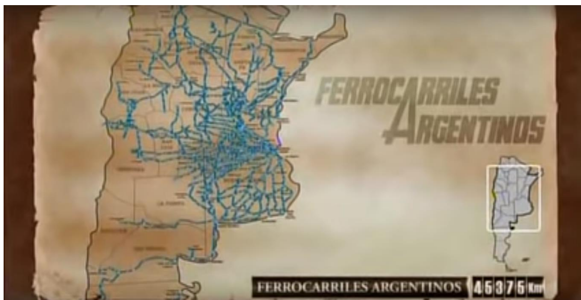
Figura 3: Red ferroviaria argentina en su máxima extensión. La Próxima Estación (2008) 00.26.21