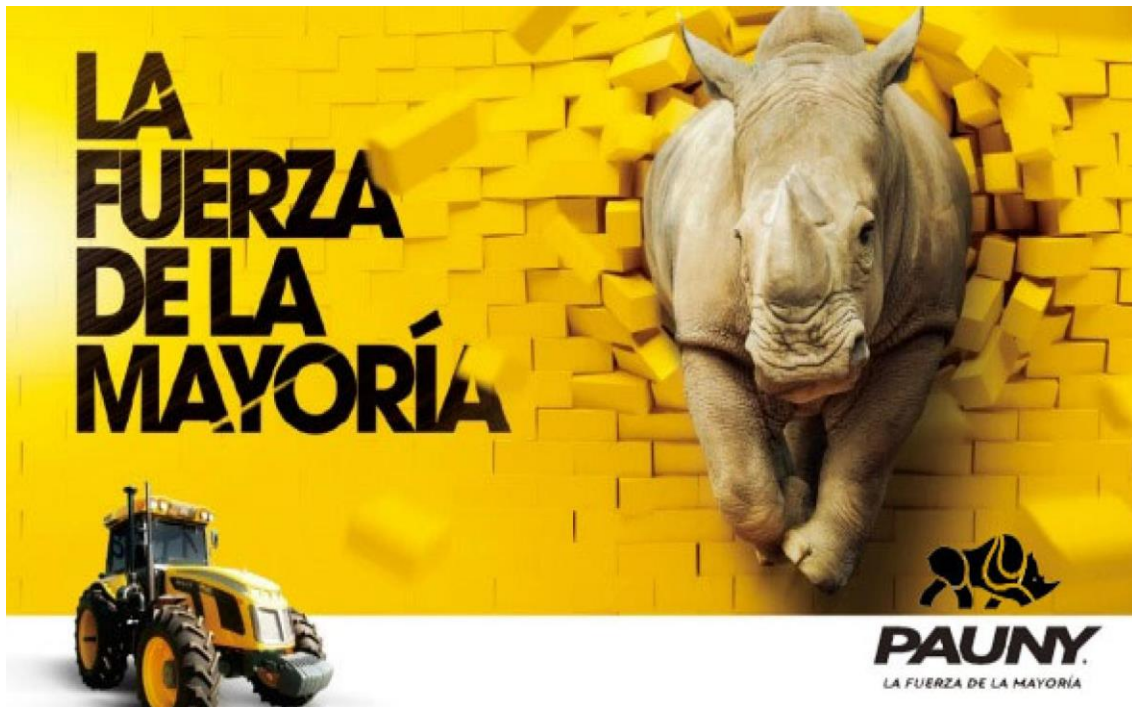
Figura 21: Slogan institucional empresa recuperada Pauny, 2002-presente

Tal vez, las empresas no deban crear un mundo sólo para el consumidor, sino también para el trabajador. Trabajar en una empresa contemporánea significa pertenecer, adherir a su mundo, a sus deseos, a sus creencias (Lazzarato, 2006). Y si bien las abordadas en los films fluctúan entre entidades de carácter público, en su mayoría, y empresas privadas, la horizontalidad tanto en las formas de administración, como en el trato y la toma de decisiones, la cooperación de flujos de creatividades, de saberes y la contención institucional, significan en Solanas los métodos, los modelos. Es decir, los modos necesarios para la cuadrícula de estos flujos en sentidos de pertenencia, de confluencia de deseos, de creencias. Todo aquello, gracias a un cierto grado de democratización institucional que los miembros integrantes de dichas empresas (trabajadores, ingenieros, administradores, técnicos, etc.) han implementado.