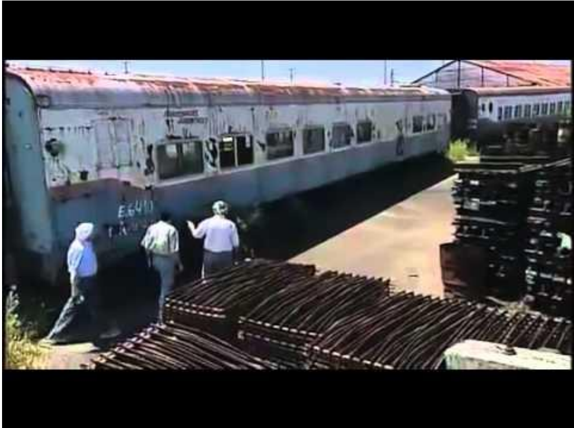
Figura 14: Equipo de filmación recorriendo chatarra ferroviaria. La Próxima Estación (2008)