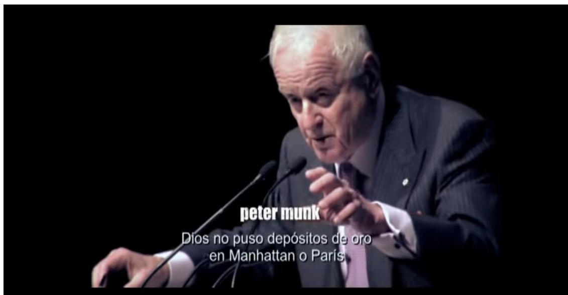
Figura 16: Tierra Sublevada - Oro Impuro (2009) 01.32.10

“El buen Dios no puso depósitos de oro en el medio de Manhattan o Paris. Por alguna obscura y desconocida razón, Dios eligió poner oro en la cima de los Andes, en comunidades remotas donde las oportunidades para escapar a la pobreza son nulas”. Tierra Sublevada: Oro Impuro (Solanas, 2009).