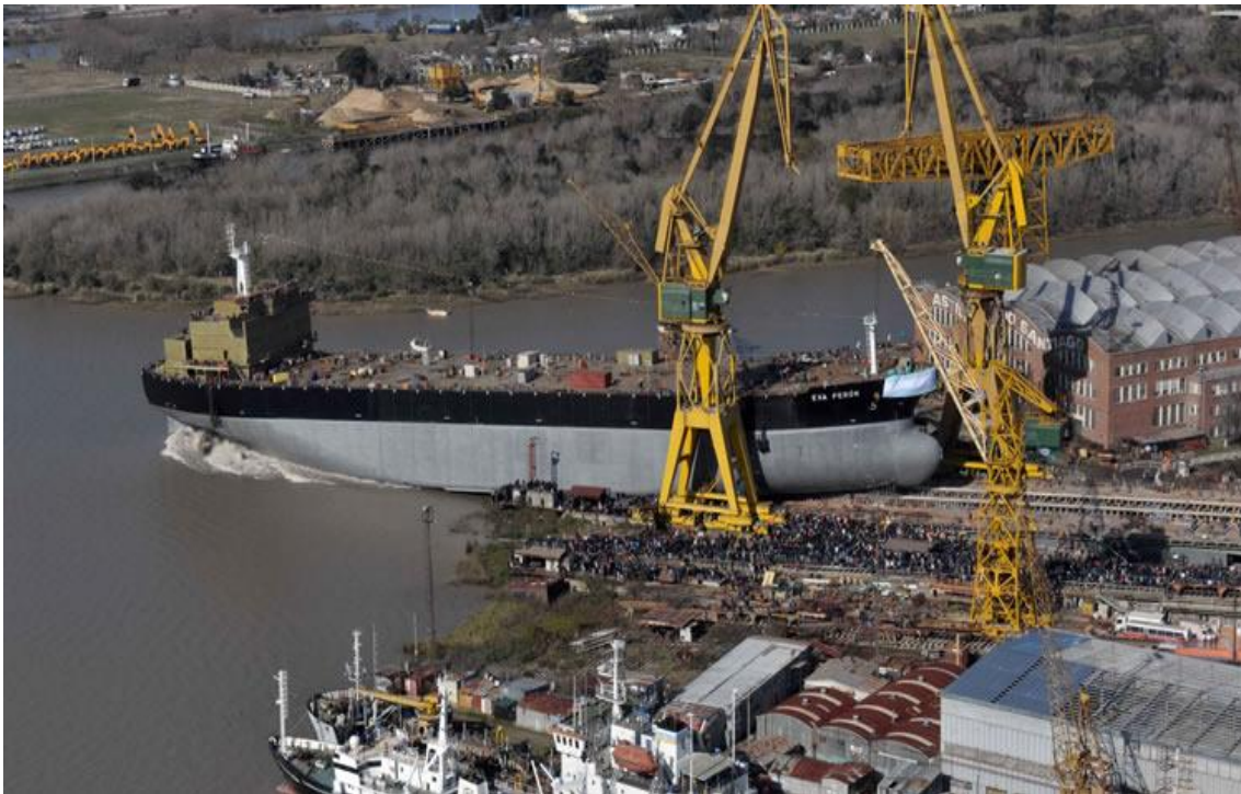
Figura 19: Astilleros Río Santiago. Argentina Latente (2007) 01.35.37

El cambio cualitativo está condicionado por la planificación a favor de la totalidad de intereses (Marcuse, 1993), esto se halla en sintonía con la constante relación discursiva de indagatoria entre director y entrevistados sobre cuáles podrían ser los proyectos o modelos superadores de las situaciones pauperizadas descritas. En este sentido, se da una proyectiva codificadora de flujos y saberes en el seno mismo de las instituciones, y existe también la intencionalidad de aplicarlas y orientarlas hacia un supuesto beneficio social. Para ello, Solanas promueve una ponderación de lo público y local, antes que lo privado y lo tras-nacional.