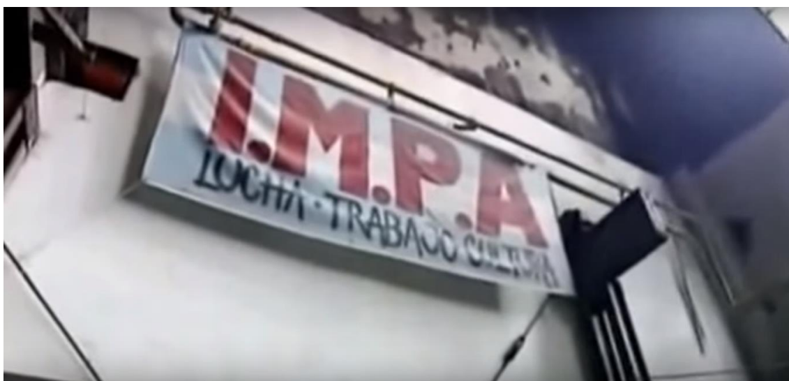
Figura 22: Cooperativa IMPA. Argentina Latente (2008) 01.13.27

En la película se expone que bajo este nuevo mecanismo productivo-cooperativo, IMPA consiguió un gigantesco contrato con Johnson & Johnson, una multinacional norteamericana, la cual pidió no solamente que el producto sea totalmente producido en la empresa, sino que desde esta cooperativa se abastezca a toda Latinoamérica. Produciéndose así, el caso inédito de una institución otrora tradicional-verticalista, que al momento de cooperativizarse y gracias a la experiencia de distribución e ingeniería social, pasa de un estado de abandono y producción cero, a ser líder en el mercado.