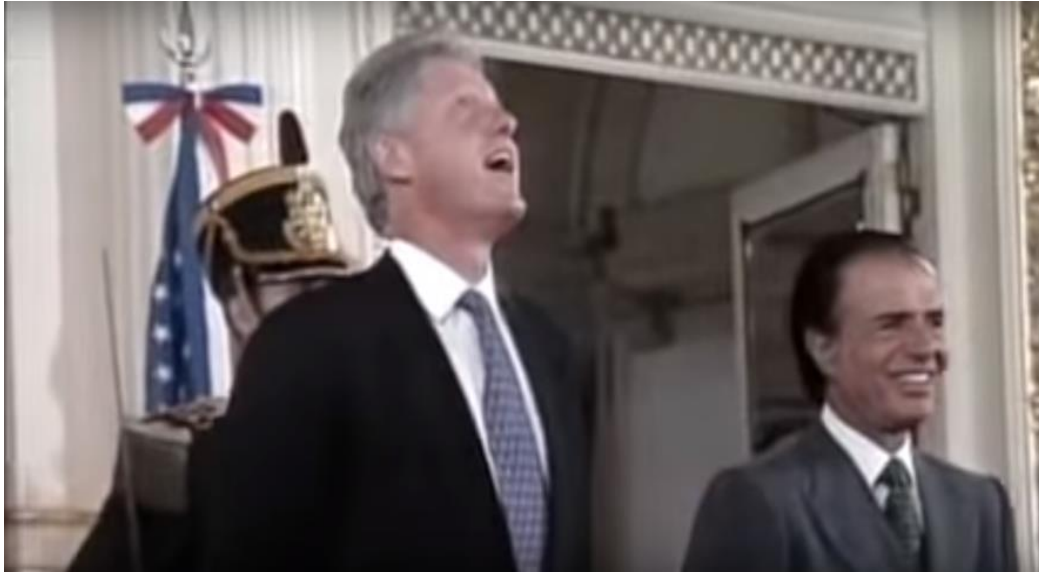
Figura 11: La Próxima Estación (2008) 01.52.03