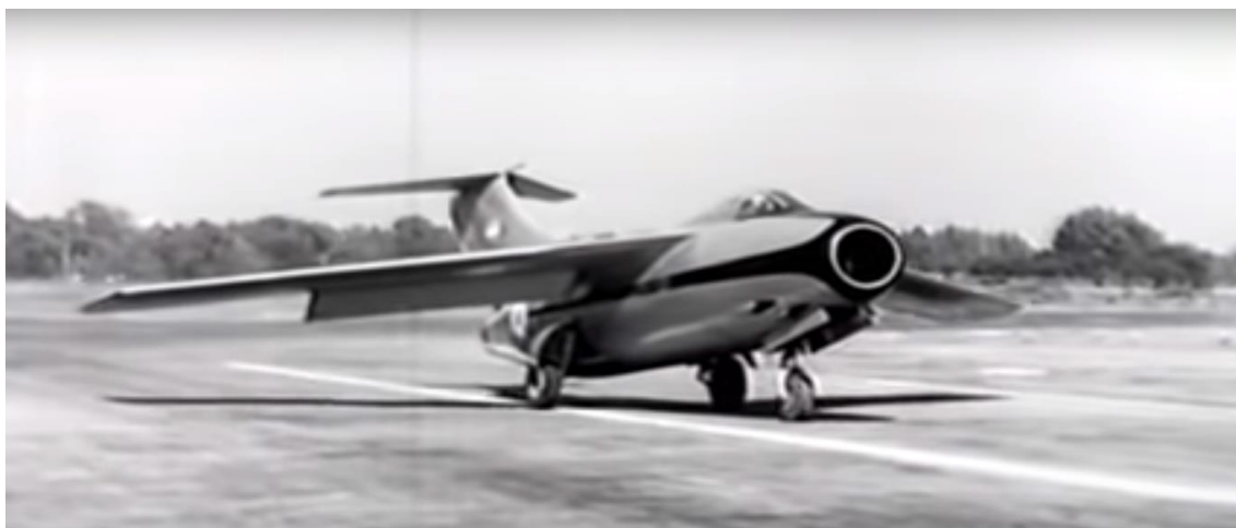
Figura 1: Avión I.Ae. 33 Pulqui II. Argentina Latente (2007) 00.18.07

Finalmente, el entrevistado concluye que el desarrollo evolucionó con el Pulqui I 54 , que en el año 1947, se convirtió en el primer aeroplano a reacción fabricado en el hemisferio sur, el octavo en el mundo. Y teniendo como zénit al Pulqui II en el año 1950 55 , un avión de combate similar al MiG 15 ruso 56 , que puso a Argentina al nivel de Francia en lo que a tecnología aeroespacial respecta.