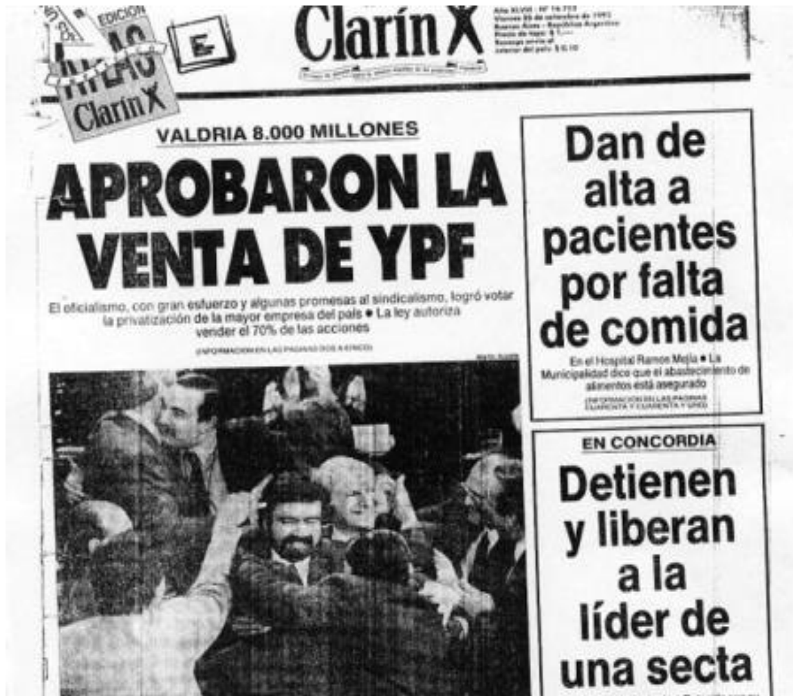
Figura 15: Tapa del diario Clarín, Viernes 25 Septiembre de 1992

pueda tener una política petrolera, una política energética autónoma, sin una empresa petrolera estatal. Ninguno de los otros países de América Latina que tuvo su empresa petrolera estatal la privatizó, sentencia Solanas.