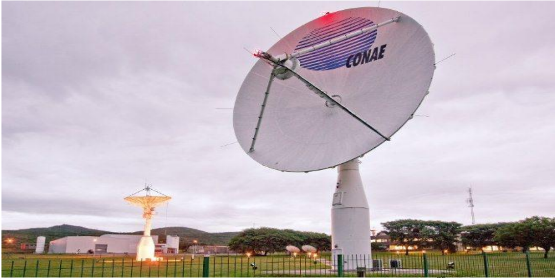
Figura 26: Centro de Monitoreo CONAE, 1991-presente 95

En el universo tecnológico, la sociedad industrial avanzada es un universo político, es la última etapa en la realización de un proyecto histórico específico (Marcuse, 1993 p. 26). Por lo cual, la centralidad de significancia en este discurso sería el propósito de fomentar una sociedad que le otorgue una razón política a la tecnología. Para ello, se requeriría de la articulación codificadora de varios dispositivos como lo sería una educación superior pública y de calidad que fomente la cooperación de flujos creativos. Facultando de esta forma a los profesionales de gozar de una inventiva tal que les permita disponer de propias perspectivas. Sin la interferencia de ecuaciones calcadas o impuestas para la solución de situaciones particulares, y que puedan plantear, en diversos ámbitos, el uso, creación y articulación de tecnologías de diversa complejidad, para resolver cuestiones estratégicas vinculadas a la soberanía. Hay una clara premeditación política en Solanas de ponderar estos arquetipos semióticos como uno de los núcleos vertebradores de significancia que hacen a la coherencia y unicidad política, ideológica y discursiva de su modelo deseado de país .