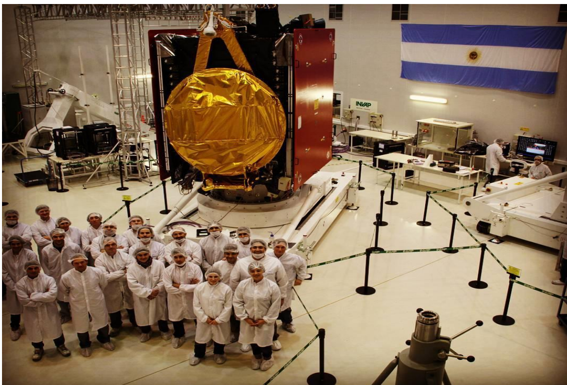
Figura 24: Centro de integración satelital, empresa INVAP, 1976-presente 92

En el film Oro Negro se remarca que gran parte de los países que habían privatizado su petróleo, lo recuperaron ya a comienzos del siglo XXI, como el caso de Rusia, Bolivia o Ecuador, los cuales anularon sus concesiones hidrocarburíferas, principalmente por la falta de cumplimiento por parte de los concesionarios. Convirtiéndose así Argentina en un caso único, un país que con todos los antecedentes degradantes anteriormente recorridos respecto a la su complejo industrial petrolífero, continuó manteniendo una política energética privatista.