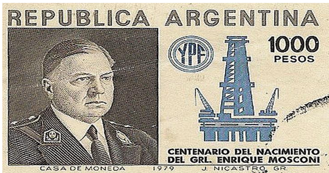
Figura 8: Homenaje filatélico al General Enrique Mosconi, 1979

existentes sobre el Estado. El lugar que Solanas da a la historia en la construcción de estos relatos sobre lo nacional, es un lugar central y fundamental al momento de configurar la narración nacional (Bilyk en Del Valle Rojas y Silva Echeto, 2017 p. 167).