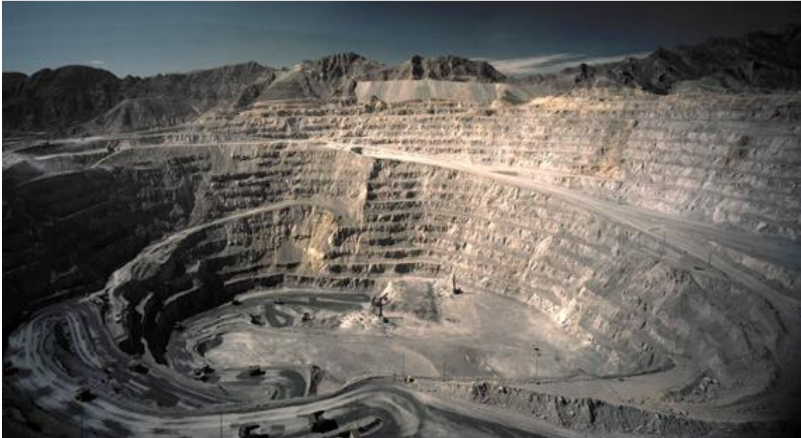
Figura 12: Yacimiento Bajo de la Alumbreira. Tierra Sublevada - Oro Impuro (2009) 00.14.19

En este tipo de construcciones de sentido, las composiciones visuales que el director ordena, adquieren un valor esencial, ya que se le presta especial atención a los elementos de la puesta en escena que se conjugan para crear imágenes cargadas de significación. Solanas opta por la representación de grandes paisajes o espacios interiores, la búsqueda de espectacularidad desde lo fotográfico en las imágenes, los movimientos de cámara sumamente estilizados, el uso expresivo del color, las actuaciones que tienden a lo hiperbólico, cierta tendencia a los relatos corales o a la multiplicidad de personajes que, habitualmente, se delinean como arquetipos o estereotipos sociales.