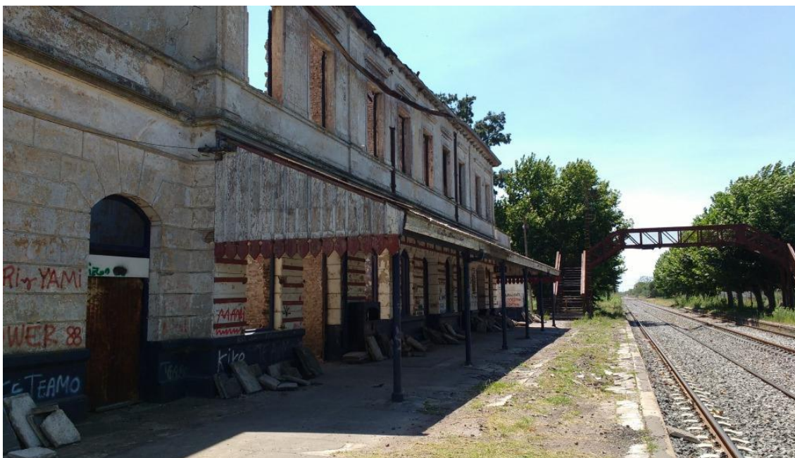
Figura 13: Estación abandonada Ferrocarril Buenos Aires-Rosario (Elaboración propia, 2015)

Esta sensación de desasosiego se produce por la visibilización de una expandida manifestación de corrupción, al mostrar la contracción del sistema de transporte ferroviario como un caso testigo de la política de privatizaciones que ha perjudicado tanto a los trabajadores como a los usuarios. Sensación generada por una razón instrumental (Taylor, 1994), que transformó en realidad los temores de que aquellas medidas que deberían determinarse por medio de ciertos parámetros éticos, se hayan decidido en unos términos de costo-beneficio completamente individuales. Y que los fines independientes que deberían confluir en las guías ético/morales de una sociedad, se vieran eclipsados por este estado de obtención máxima de beneficios particulares, convirtiendo a los hombres y mujeres en partícipes de esta realidad. Insensibles a las necesidades de los demás hombres y mujeres, así como a las del medio ambiente, hasta el punto del desastre.