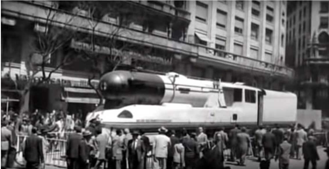
Figura 7: Primera locomotora aerodinámica del mundo. La Próxima Estación (2008) 00.36.38