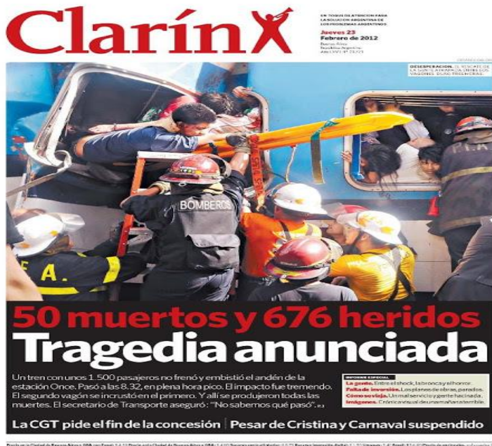
Figura 17: Tapa diario Clarín, Jueves 23 de Febrero 2012