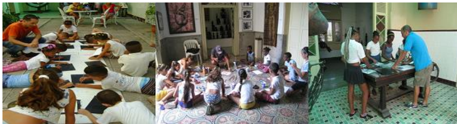
Figura 2: Fotos del Taller de Artes Plásticas. Rotación de los de los tres grupos

El segundo momento (Nuestras prácticas diarias), tuvo una duración de cuatro días. Se trabajó con pintura, escultura y grabado (Figura 2), se apoyó en la práctica interpretativa para la apreciación de las artes implementando las cuatro maneras de entender el arte y la interpretación. Se tuvo en cuenta las cuatro cualidades que distinguen a la interpretación del patrimonio de otros tipos de comunicación: amena, relevante, organizada y tiene un tema. Se dirigió la mirada hacia los mensajes que hay en las obras, su contenido, la manera de interpretarlo y comprenderlo. Se transitó de los análisis más simples a los más complejos para la apreciación de la obra, su interpretación y la apropiación del contenido patrimonial (Peñate, 2020). Se emplearon técnicas interpretativas como comentarios, sistema de preguntas, demostraciones, interacción con determinadas piezas, invitaciones al juego.