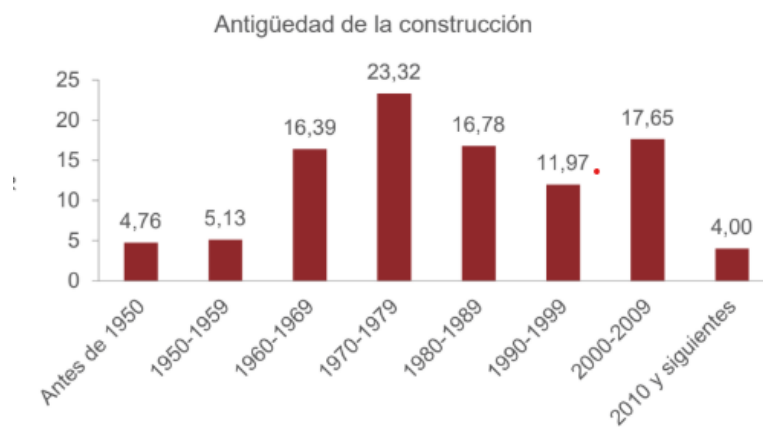
Ilustración 1. Antigüedad de las viviendas de Zaragoza