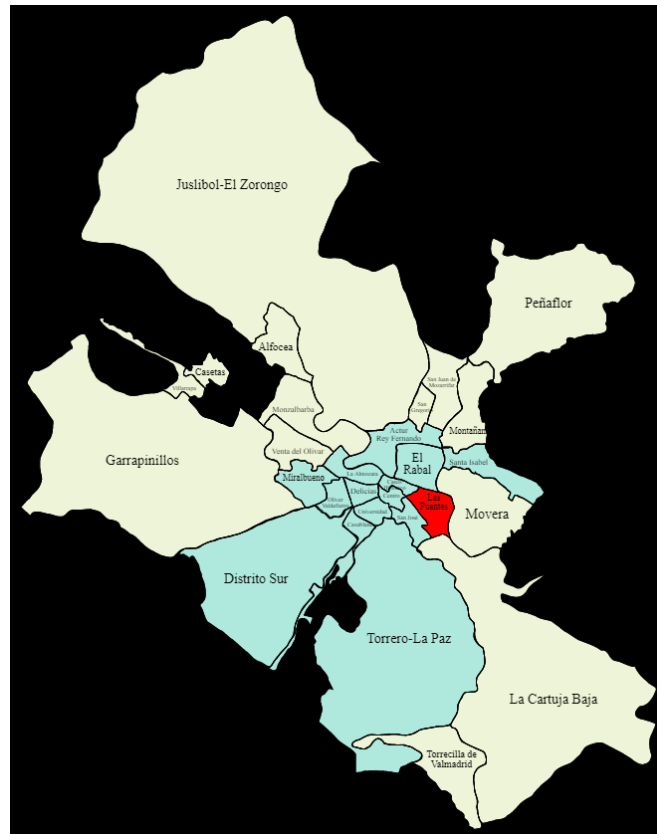
Ilustración 4. Ubicación barrio Las fuentes

El barrio Las Fuentes se trata de un barrio de carácter obrero , con un aspecto antiguo de las calles del barrio y de su desequilibrio entre la zona norte y la zona sur del barrio. El nivel de equipamientos es alto, y la mayor parte del tejido comercial se encuentra en el centro del barrio. Además, el barrio Las Fuentes posee una de las densidades de población más altas de la ciudad, ya que hay una incapacidad de desarrollo por su límite este, el barrio se ha venido concentrando y masificando, sin posibilidades de expansión urbana.