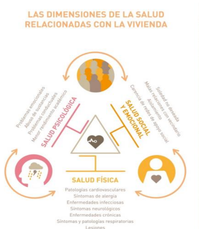
Ilustración 7. Las Dimensiones de la Salud relacionadas con la vivienda

Las malas condiciones en vivienda o la ausencia de esta enferman a las personas, y en mayor medida a la infancia. “La existencia o no de un hogar, las condiciones físicas de la vivienda, su entorno físico y/o el entorno social del barrio pueden repercutir sobre la salud física, psicológica y mental y el bienestar socio-relacional de las personas, en particular entre las personas más vulnerables” (Ubrich, 2019).