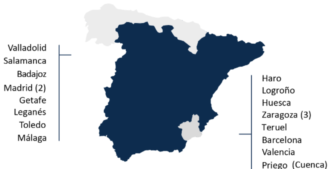
Ilustración 2 YMCA en España