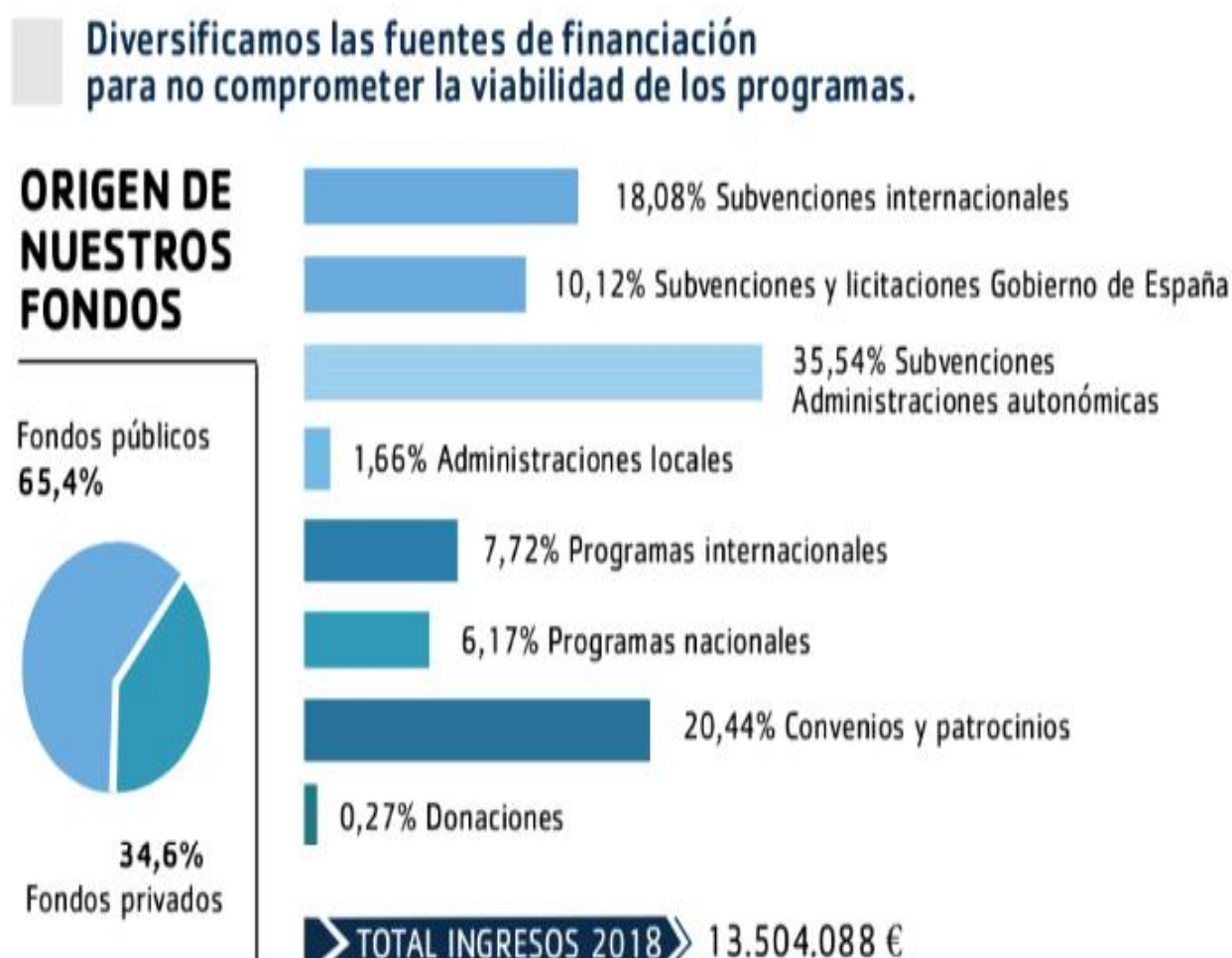
Ilustración 3 FINANCIACIÓN DE YMCA

A continuación, se muestran dos esquemas más sacados de la memoria 2018 de YMCA, donde en el primero vemos la financiación en porcentaje de la que sacan los fondos para realizar todos los programas y servicios, y en el segundo esquema se muestra el porcentaje de a donde van destinados esos fondos.