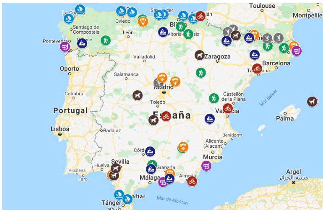
Mapa 1. Zonas de España donde se desarrollan las principales actividades deportivas del turismo activo

La oferta variará según las condiciones geográficas de cada territorio. De los posibles medios analizados anteriormente (tierra, agua y aire), destacan las actividades terrestres con una mayor y diversa oferta. Esto es así porque es el medio con mayor facilidad para desarrollarse en cualquier localización. Seguidas de las actividades terrestres, se ofertan las actividades acuáticas. Y, finalmente, la oferta más escasa se encuentra en las actividades aéreas debido, entre otras cosas, a la dificultad y la previa preparación que requiere el desarrollo de este tipo de actividades (Araújo et al., 2012).