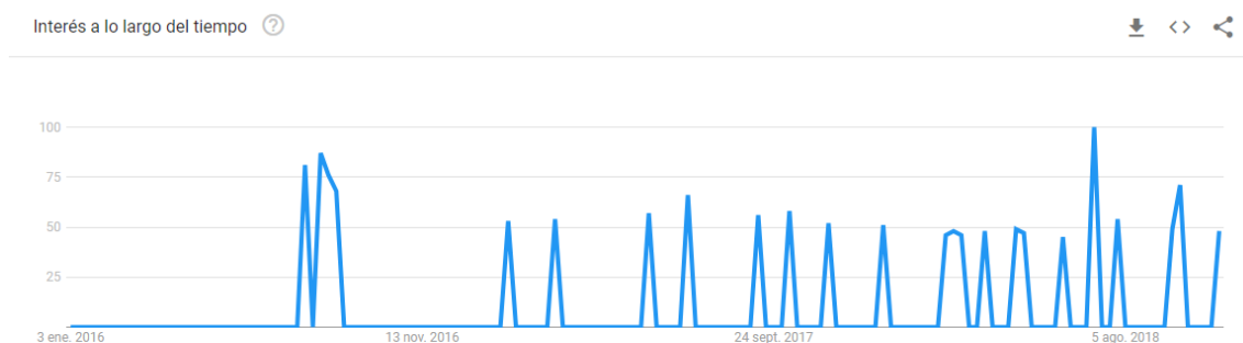
Ilustración 19. Interés exploración urbana en Aragón en los últimos 2 años.

El Sanatorio de Agramonte está en Zaragoza, así que he creído conveniente extraer los datos del interés sobre el tema 'Exploración Urbana' en Internet también del territorio aragonés en los últimos dos años, a pesar de que el interés por la búsqueda de esta temática en Aragón sea medio, únicamente con un indicador de 58.