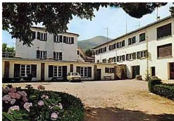
Ilustración 3. Sanatorio de Agramonte en los 70.