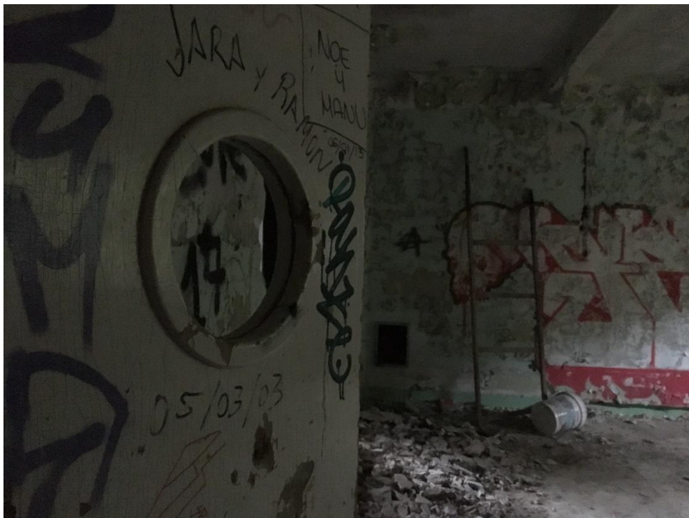
Ilustración 8. Quirófano del sanatorio.

- Quirófano . En la primera planta del sanatorio, al final del pasillo y tras una puerta con un ojo de pez, se encuentra otra de las salas más destacables y buscadas del edificio: el quirófano.