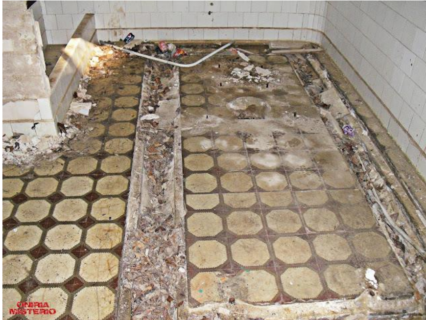
Ilustración 9. Sala de autopsias.

- Morgue : A esta dependencia se accede bajando unas escaleras que hay junto al quirófano. Quedan los restos de un conducto de extracción que perfectamente podría ser el de una mesa de autopsias.