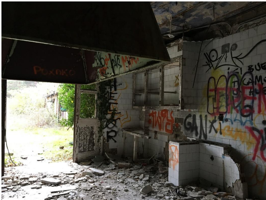
Ilustración 4. Cocinas del sanatorio.

- Cocina . Se llega a él a través del pasillo del sótano o por la puerta exterior. Reconocerlo en sencillo, puesto que tiene una enorme campana de extracción.