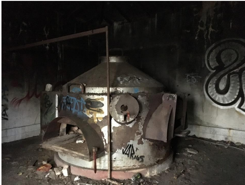
Ilustración 12. Horno del sanatorio.

podían recoger. Hay teorías que dicen que lo usaban para quemar la basura que se fuera acumulando. Nunca se ha llegado a confirmar ninguna.