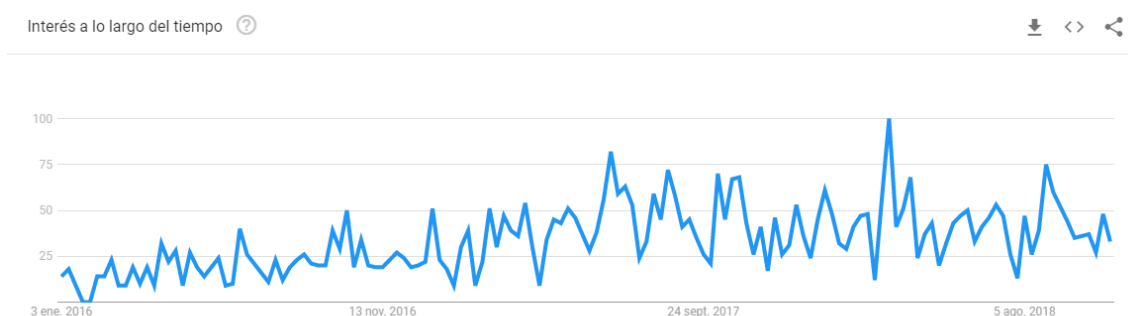
Ilustración 18. Interés por Exploración urbana últimos 2 años en España.

El primer gráfico plantea el interés que ha habido en la red en España durante los últimos dos años por el tema ‘Exploración Urbana’.