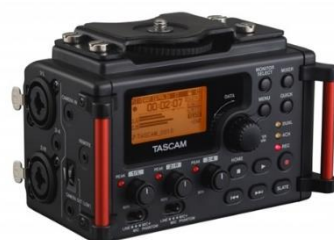
Ilustración 17. Tascam.