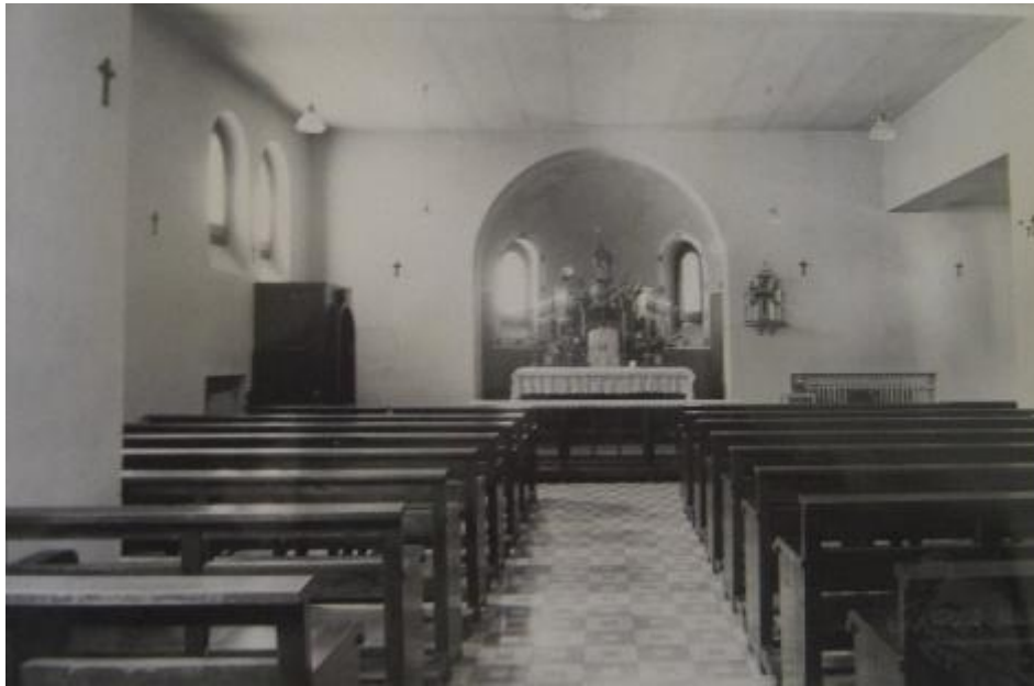
Ilustración 7. Capilla sanatorio años anteriores.

En ella no queda nada de lo que había en su época. Al fondo, en el hueco que se ve en la imagen superior estaba el altar.