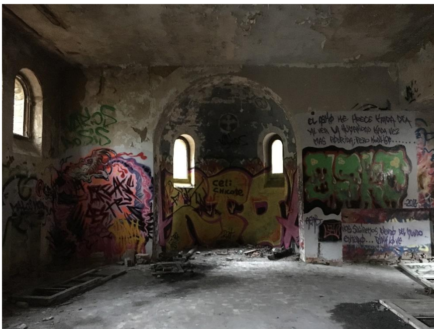
Ilustración 6. Capilla del sanatorio.

- Capilla . La capilla es otro de los enclaves del sanatorio más buscados. Se encuentra en la planta baja del edificio principal. La puerta de la capilla es convexa, así que es fácil de encontrar.