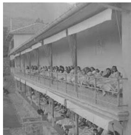
Ilustración 10. Terraza en años anteriores.

- Horno : El horno se encuentran en un cobertizo externo. Hay historias que cuentan que quemaban los cadáveres cuando ya no se podían hacer cargo de ellos o sus familiares no los