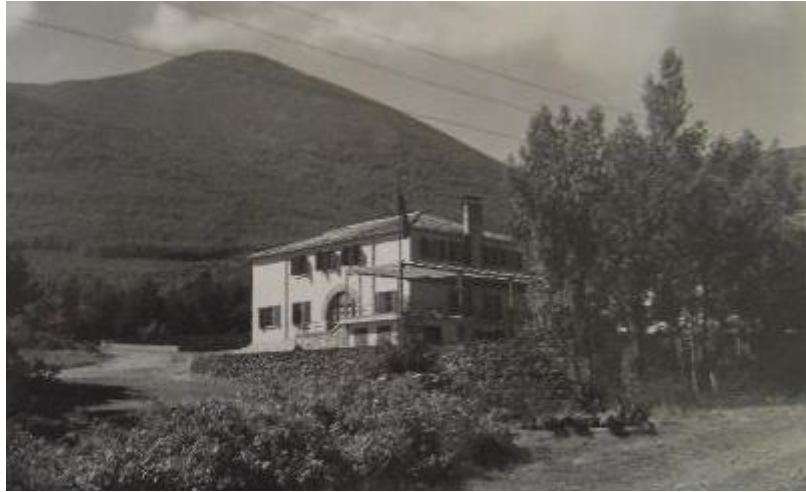
Ilustración 1. Hotel-refugio de Agramonte.

Los ruidos y las apariciones parecen estar a la orden del día, tanto en el edificio como en el cementerio anexo. («El Sanatorio de Agramonte, el hospital encantado», 2017)