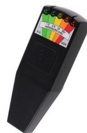
Ilustración 16. EMF K2.

El investigador llevará la grabadora encendida en todo momento, aunque no se esté llevando a cabo ninguna prueba y únicamente el grupo se esté desplazando de un enclave a otro. La razón: es muy probable que la grabadora capte sonidos sobrenaturales que durante la visita no se perciban, pero a la hora de revisar las cintas sí.