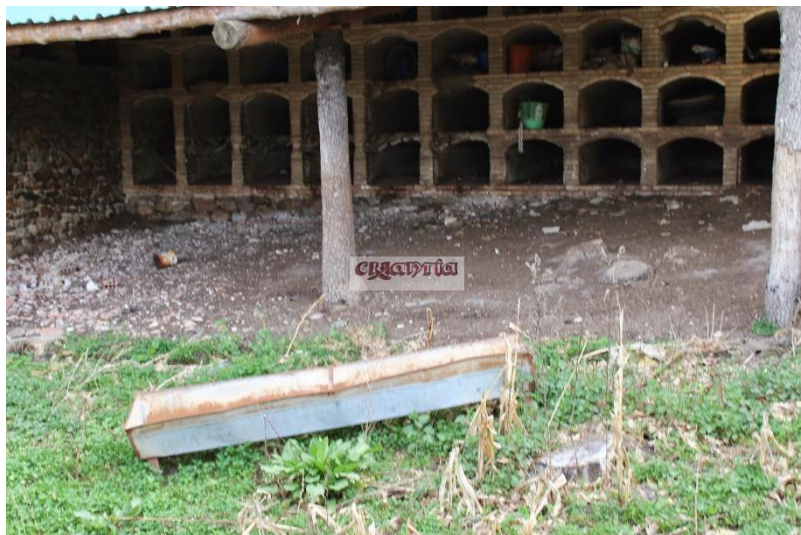
Ilustración 13. Cementerio del sanatorio.

- Cementerio . Situado a 500 metros del edificio principal, el cementerio se compone de cuarenta tumbas. Enterraron a los pacientes que perdieron la vida debido a la tuberculosis y cuyos cuerpos no llegaron nunca a salir del recinto sanitario. Con el paso de los años, las tumbas han sido saqueadas.