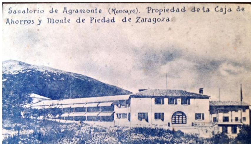
Ilustración 2. Sanatorio de Agramonte.

Los ruidos y las apariciones parecen estar a la orden del día, tanto en el edificio como en el cementerio anexo. («El Sanatorio de Agramonte, el hospital encantado», 2017)