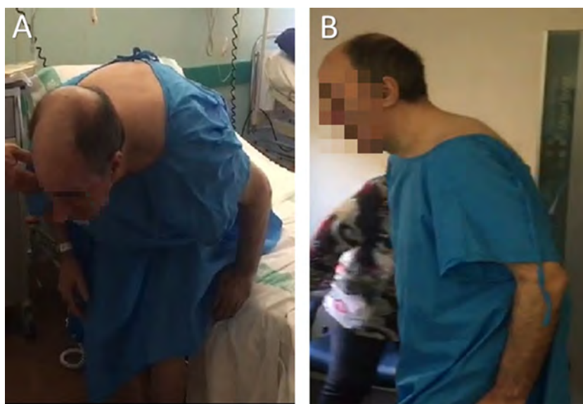
Figura 1 Paciente con camptocormia antes (A) y tras una hora de sobrecarga con 350 mg de levodopa (B), en la que se muestra una evidente mejoría en la antero-flexión del tronco.

paciente con otra co-mutación patogénica en el gen de la glucocerebrosidasa 12 . En nuestro caso, consideramos que la naturaleza de la camptocormia era el propio parkinsonismo, ya que el paciente mostró una severa flexión anterior del tronco en ausencia de posturas anormales de cabeza y cuello (como se describe en las camptocormias distónicas) y presentó mejoría (aunque subóptima) de la postura con levodopa. Además, el electromiograma no mostró hallazgos miopáticos.