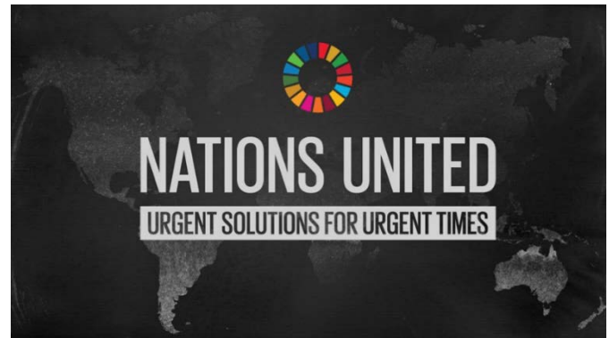
Fig. 4 “Nations United: Urgent Solutions for Urgent Times” Documentary

Pongamos un ejemplo concreto que se está desarrollando en clase durante el presente curso a los estudiantes del Programa Internacional del Doble Grado en Administración y Dirección de Empresas + Derecho: la visualización del documental titulado “Nations United: Urgent Solutions for Urgent Times”. Se trata de un documental creado por la propia organización con motivo de su 75 aniversario y con el que también quiere poner el foco en los 5 años transcurridos desde la aprobación de la Agenda 2030. El documental parte de la ruptura de nuestra cotidianeidad que ha supuesto la pandemia del Covid-19 y aprovecha para recordar que las bases para acabar con la pobreza, la desigualdad, la injusticia y el cambio climático están puestas en los ODS, por lo que solo falta la acción decidida de todos para seguir un camino difícil, con numerosos obstáculos, pero no incierto.