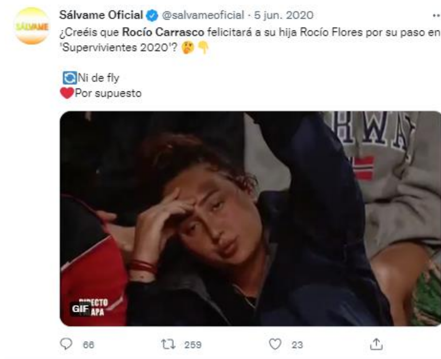
Imagen 2: Tweet de @salvameoficial publicado el 5 de junio de 2020