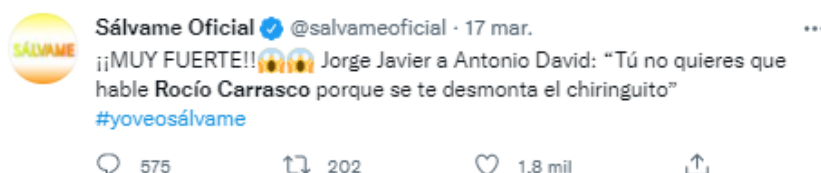
Imagen 6. Tweet de @salvameoficial publicado el 17 de marzo de 2021