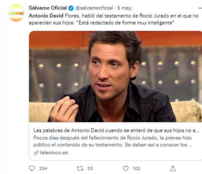
Imagen 8. Tweet de @salvameoficial publicado el 5 de mayo de 2021