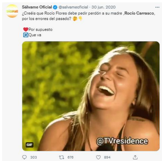
Imagen 4. Tweet de @salvameoficial publicado el 29 de junio de 2020.