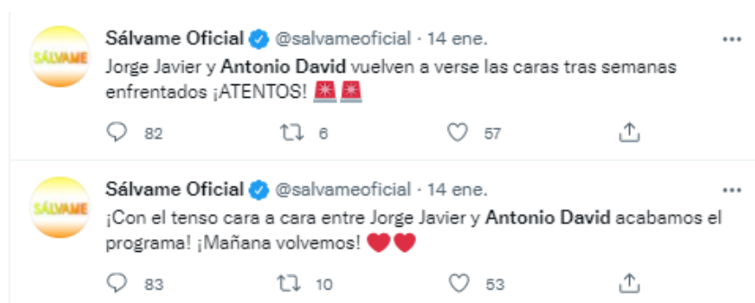
Imagen 5. Tweets de @salvameoficial publicados el 14 de enero de 2021