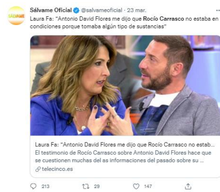
Imagen 7. Tweet de @salvameoficial publicado el 23 de marzo de 2021