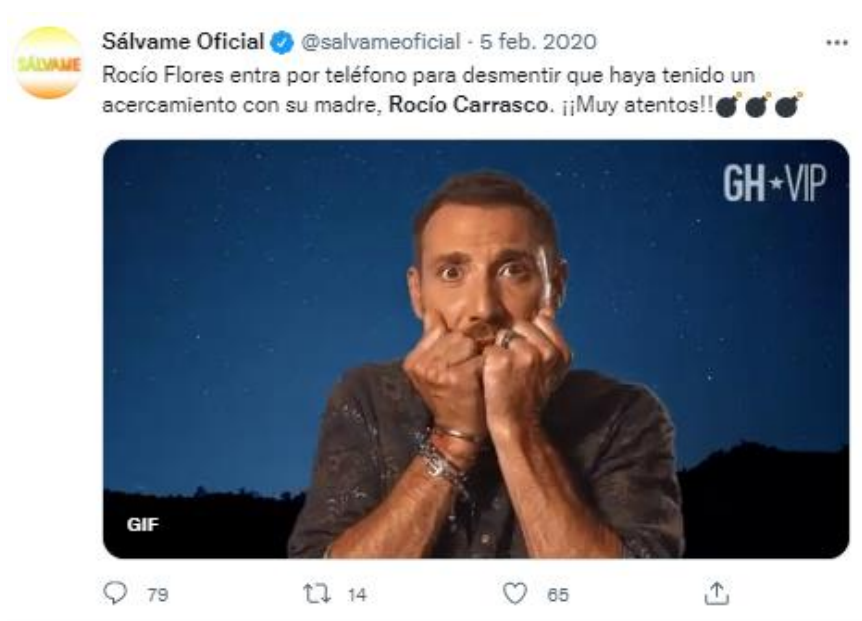
Imagen 1. Tweet de @salvameoficial publicado el 5 de febrero de 2020.

Si se habla concretamente de los tuits seleccionados, se ve un tono discursivo favorable hacia Rocío Flores y Antonio David. Preguntan sobre el tema central a debatir en el programa, relacionado con Rocío Carrasco, y lo acompañan con Gifs de estos dos personajes en tono burlesco. Unos ejemplos.