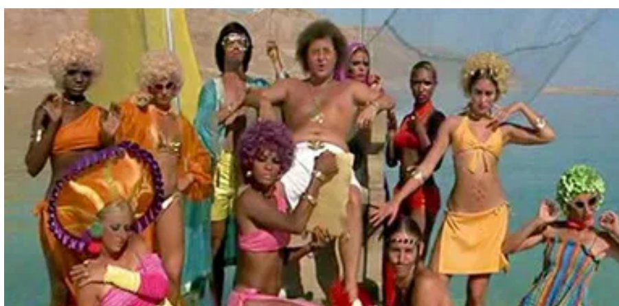
Fig. 33: Herodes y su troupe.

Enlazando secuencias por medio de la música y las canciones, en ocasiones dialogadas, presenciamos escenas de los últimos días de Jesús en la tierra (fig. 35). El relato se aprecia desde el prisma de Judas (fig. 36), mostrando su desacuerdo con el progreso ideológico y místico de Jesús a medida que se incrementan sus seguidores 47 y se muestra más centrado en su éxito que en lo que predica, siendo de ahí de donde se extrae el título del film. Tenemos ante nosotros un Jesús más humano y menos divino.