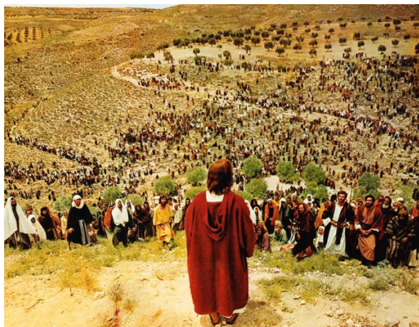
Fig. 13: Jesús predicando

La película americana Rey de Reyes ( King of kings , Nicholas Ray, 1961), vuelve a centrar el relato en los textos evangélicos sobre la Pasión y Muerte de Jesús, a la par que se inspira en los libros de Tácito. La Pasión de Cristo (fig.14) nos es presentada como el arrebatado drama interior de un hombre que duda. A nivel técnico destaca el uso del scope , generando encuadres magníficos. El film parece una sucesión de cuadros con rojos intensos e imponentes dorados, acompañados de una banda sonora que nos sumerge en el momento histórico.