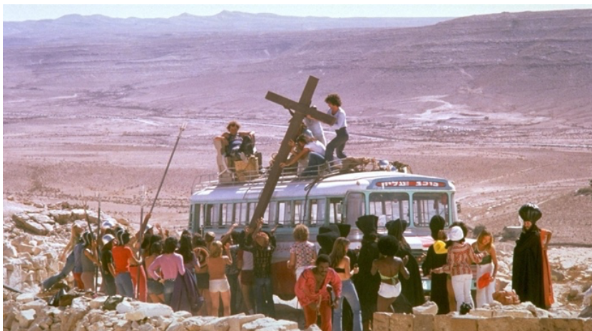
Fig. 31: Llega el bus, empieza la aventura.

El relato se inicia al ritmo de la obertura mostrándonos cómo un autobús escolar (fig. 32) repleto de actores, los lleva al lugar del rodaje. Allí van vistiéndose según su personaje, hasta que surge Jesús con su blanca túnica, focaliza toda la atención.