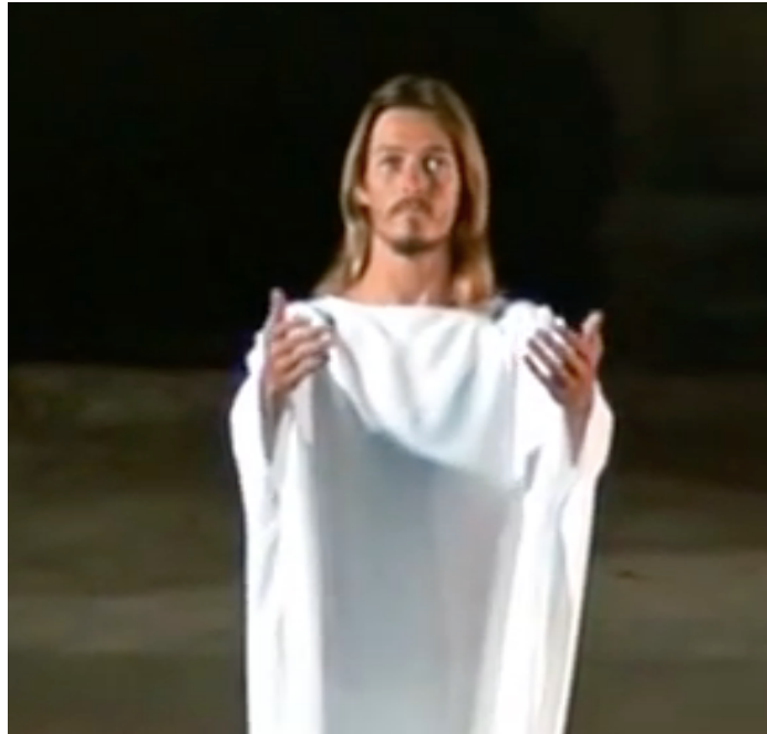
Fig. 49: Jesucristo Superstar, la Esperanza

No hay Resurrección. Solo si ansiamos un final feliz, podemos fantasear de su existencia en la escena de Judas y sus ángeles, cuando surge “Jesucristo Superstar” con una túnica de un blanco deslumbrante (fig.50), mientras ángeles claman su nombre, mostrando una estética propia de la época, monocroma y con estrellas que ascienden y descienden.