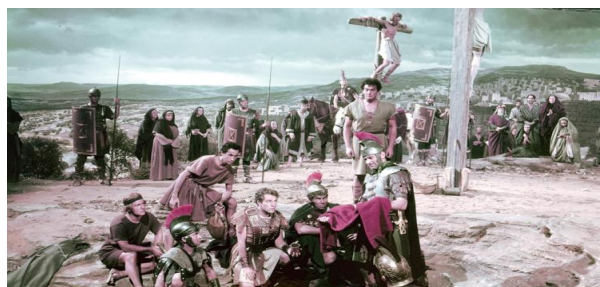
Fig. 11: La Sagrada Túnica

En el ámbito estadounidense, hay que destacar dos películas basadas en novelas, y pese a no ser Jesús el protagonista principal, su presencia es parte del argumento. La túnica sagrada ( The Robe , Henry Koster, 1953) basada en el relato homónimo de Lloyd C. Douglas, fue la primera película proyectada en cinemascope (fig. 12). Obra épica que contó con un elenco de actores de renombre. Su argumento nos introduce a Jesús de un modo secundario, mientras el protagonismo recae en el esclavo Demetrius, encarnado por el actor Victor Mature. El film obtuvo un Óscar a la mejor dirección artística y otro al mejor diseño de vestuario.