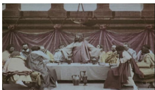
Fig. 3: Última Cena

Otra película relevante del mismo año fue Cristo caminado sobre las aguas ( Le Christ marchant sur flots , Georges Méliès, 1898). Pese a la brevedad de la cinta, podemos apreciar inéditos trucos visuales como la sobreimpresión empleada en la