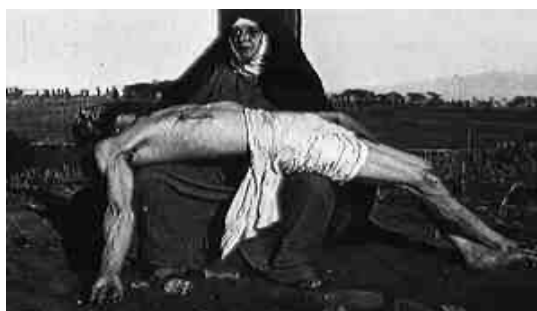
Fig. 6: La Piedad

La obra italiana titulada Cristo ( Christus , Giulio Antamoro, 1915) fiel a los textos sagrados (fig. 6), supone un recorrido por los hechos cristianos más significativos (empezando por el relato con la Anunciación y concluyendo con la Ascensión). Algunas escenas nuevamente son la escenificación de auténticos tableaux vivants de obras de arte inmortales de la pintura y de la escultura al cine 17 .