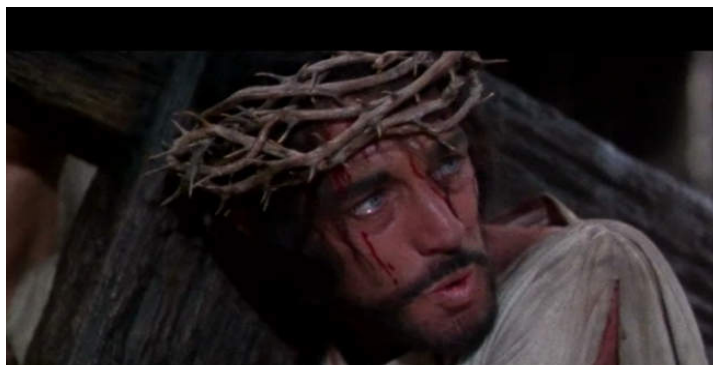
Fig. 14: Jesús camino del Calvario

Con la película, La Historia más grande jamás contada ( The Greatest Story Ever Told , George Stevens, 1965), cuyo guion se basa en el libro de Fulton Oursler, se cierra una etapa de grandes superproducciones. Como curiosidad destaca que se rodó únicamente en Estados Unidos. Contó con un Jesucristo (fig. 15) cuyo intérprete Max von Sydow, se encontraba en un momento místico y gozaba de gran popularidad, a lo que contribuye la música, que incorpora el Réquiem de Verdi y partes del Mesías de Händel adaptados al film.