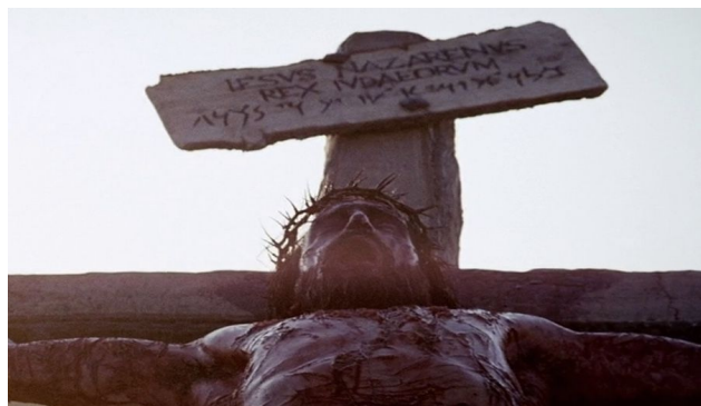
Fig. 21: Crucifixión

La Pasión de Cristo ( The Passion of the Christ , Mel Gibson, 2004), película rodada en Italia en los estudios de Cinecittá y en la antigua ciudad de Matera, sorprendió al público al mostrar la vida de Jesús (fig. 22) en sus últimas doce horas.