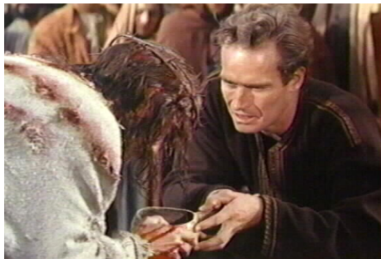
Fig. 12: Jesús atendido por Judah

Ben-Hur ( Ben-Hur , William Wyler, 1959), guion que adapta la novela del mismo título de Lewis Wallace, narra la historia de Judah, su caída en desgracia y su lucha por recuperar la dignidad. Coincidirá con Jesús (fig. 13) en momentos cruciales para ambos, breves pero suficientes para poder apreciar la paz que le transmite, así como el milagro que obra curando a su madre y hermana. Esquematismo, sencillez, pasiones como el perdón, la venganza o la lealtad están presentes en el personaje de esta superproducción de largo metraje y que obtuvo once premios Óscar.