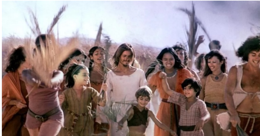
Fig. 34: Hosanna