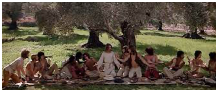
Fig. 39: Ultima Cena

La Última Cena (fig. 40) es una escena bucólica acompañada de una delicada y tranquila melodía. En su desarrollo, Jesús les manifiesta nuevamente la llegada de su muerte, la futura e inmediata traición, y cuando aflora el antagonismo con Judas, una música funky que contrasta con la relajada melodía inicial, amortigua la tensa discusión.