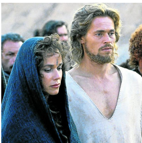
Fig. 18: Jesús y María Magdalena

El film abunda en sencillas tomas frontales (figs. 19 y 20) y estatismo de la cámara, llevando a contrastar la crispada gestualidad de los intérpretes. Destaca su banda musical, obra de Peter Gabriel, que contribuye a crear un entorno sugestivo alejado de