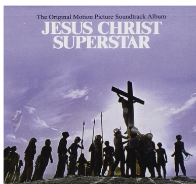
Fig. 25: Portada del disco

Los pasajes bíblicos y el mestizaje acústico discurren parejos entremezclando blues, folk y partes sinfónicas, mientras que los himnos se realzan gracias a los sonidos electrónicos.