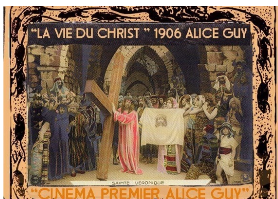
Fig. 4: Jesús camino del Calvario

La vida de Cristo ( La Vie de la Passion de Jesus Christ , Alice Guy y V. Jasset, 1906) destaca por su calidad plástica, decorados, vestuario, atrevidos encuadres, y dramatismo. “Fusiona lo teatral y lo realista, con predominio de la naturalidad y humanidad en una visión femenina de la historia 15 ”. Los principales pasajes del film se articulan por medio de 24 tableaux (fig. 4) inspirados en las acuarelas que James Tissot realizó en su estancia en Palestina ilustrando la vida de Jesucristo, con intertítulos en francés. Enfatiza la presentación frontal de la acción y la resolución completa de las secuencias en plano fijo. Es importante destacar que en esta cinta, el Vía Crucis y su recorrido son escenas clave del argumento.