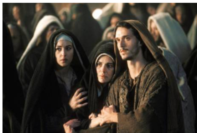
Fig. 22: María Magdalena, María y Juan

Fue rodada en latín y arameo, contando para la creación del guion con los Evangelios, diversas obras literarias y pictóricas, así como de las antiguas tradiciones cristianas (fig. 23), las visiones y espiritualidad de la beata y mística Ana Catalina Emmerick 29 (1774-1824), debiéndole a ella el matiz teológico del film. Le añadiríamos a lo expuesto, la intención que a Mel Gibson le inducía a llevar a cabo este proyecto: “dar respuestas al espectador (...) despertar la conciencia adormecida de tantos cristianos en todo el mundo” 30