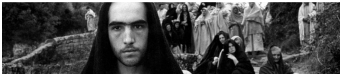
Fig. 15: Jesús ante la multitud

Evangelio según San Mateo ( Il Vangelo secondo Matteo , Pier Paolo Pasolini, 1964) se aleja del Jesús épico (fig. 16) y lo muestra con una imagen austera, “mirada penetrante, oscurecida por una ira contenida 22 ” y expresión turbadora.