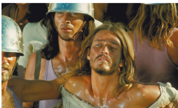
Fig. 43: Prendimiento

Llega el juicio de Pilatos, quien intenta eximir a Jesús de las acusaciones que sobre él recaen. La música que envuelve la escena presenta matices operísticos, apoyada en un coro que exige soluciones. Satisfacerlas conllevará la apabullante escena de los cuarenta latigazos (fig. 44 y 45), acompañados de una música enérgica a la par que trágica, que incrementa el ritmo al tiempo que el castigo va llegando a su fin.