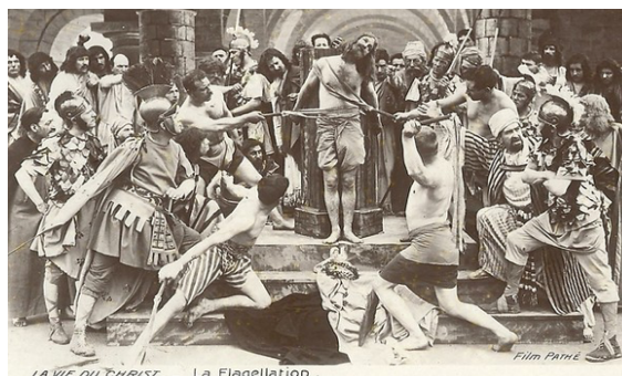
Fig. 5: Flagelación

La Vida y la Pasión de Cristo ( La Vie et la Passion de Christ , Ferdinand Zecca, 1907), proyecto de la casa Pathé, dio lugar a una cinta de mayor duración que la de 1903. Presentaba 37 lienzos coloreados a mano, cuya inspiración partía de obras de arte memorables. Comparte con el film de Alice Guy, la “articulación narrativa por medio de distintos tableaux ” 16 (fig. 5), similitud al representar determinadas escenas, e inspiración en ilustraciones empleadas como documentos, en este caso de Gustave Dore. Sirvió de entretenimiento para el público y guía de catecúmenos, debido a su carácter didáctico.