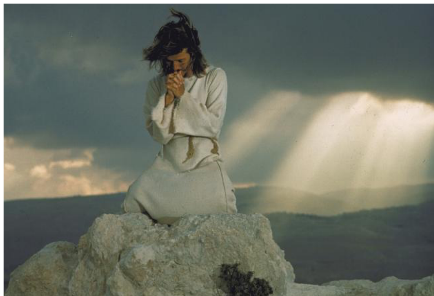
Fig. 40: Getsemani

Dios, yo no empecé, fue tu voluntad. Dame el cáliz de amargura (...) hazlo pronto o yo me voy a arrepentir”.