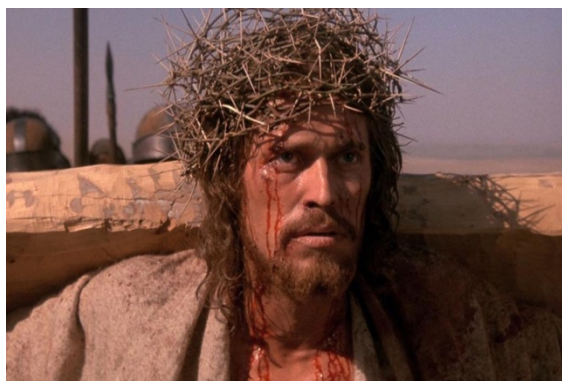
Fig. 19: La Pasión

“la tradición pseudo sinfónica característica del filón bíblico hollywoodiense 27 ”. En la actualidad sigue siendo una creación heterodoxa y provocadora.