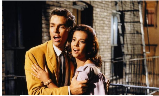
Fig. 29: West Side Story . Película