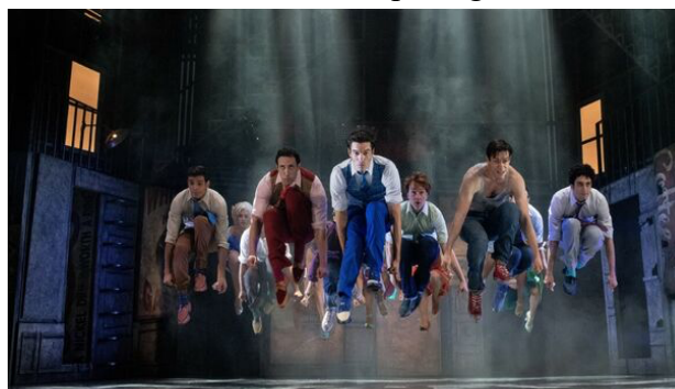
Fig. 28: West Side Story . Musical

Tras lo expuesto, antes de pasar al desarrollo de la película, debemos recordar que la trayectoria de musicales adaptados a películas ya se había experimentado cuando Jesucristo Superstar dio el paso al Séptimo Arte. Le precedieron títulos muy valorados como Singin' in the Rain , West Side Story (fig. 29 y 30), My Fair Lady , The sound of music , Funny Girl , fiddler on the Roof , Cabaret , Grease , Evita , The Phantom of the Opera , Chicago , Rent , Dreamgirls o Les Misérables ..., adaptaciones que algunas resultaron tan laureadas como exitoso su musical primigenio.