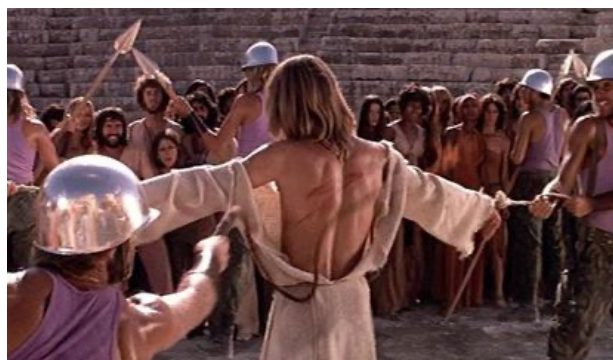
Fig. 44: Flagelación

Tras tan intensa escena, el ritmo de la historia cambia. Judas (ya fallecido) surge arropado por ángeles blancos (fig. 46), caracterizados acorde a los años setenta, con estética anacrónica, cantando a “Jesucristo Superstar”.