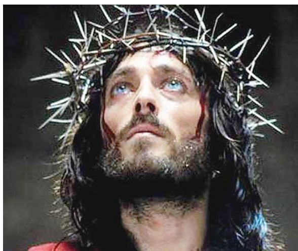
Fig. 20: Jesús coronado de espinas

Como contraprestación a estos últimos films un tanto alejados de la doctrina evangélica y con un Jesús un tanto heterodoxo, surgen proposiciones fieles a lo que expresan los Evangelios. Una de estas propuestas “canónicas” es la miniserie Jesús de Nazaret ( Jesus of Nazareth , Franco Zeffirelli, 1977), presenta una novedosa puesta en escena. La acertada imagen de Jesús (fig. 21) y el realismo que emana de la actuación de los Apóstoles, la llevó a ser una “obra alabada por la iglesia católica italiana en tanto que los puritanos la rechazaban 28 ”.