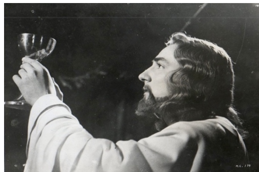
Fig. 10: La Eucaristia

El actor Enrique Rambal como el nazareno (fig. 11) conmovió al público y sentó un precedente en el imaginario nacional. Su actuación, tono, semblante, así como su acento, sirvieron de referencia para otras representaciones. Fue todo un éxito durante sesenta años, tiempo en el que la televisión la transmitía en Semana Santa.