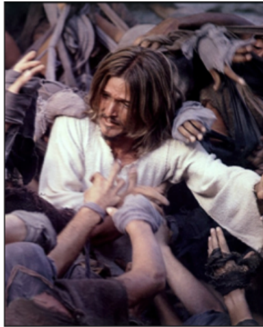
Fig. 37: Leprosos suplican curación

Se suceden escenas angustiosas generando un abanico de sensaciones, transitando de la quietud a la opresión, como cuando Jesús, siendo abordado por la miseria del ser humano, leprosos ansiosos de curación (fig. 38), parece engullido por ellos y anticipa su propia muerte; o el momento en que Judas traiciona a Jesús (fig. 39), sus remordimientos quedan enmascarados como la acción del patriota que salva a su pueblo impidiendo que los romanos declaren la guerra a los judíos.