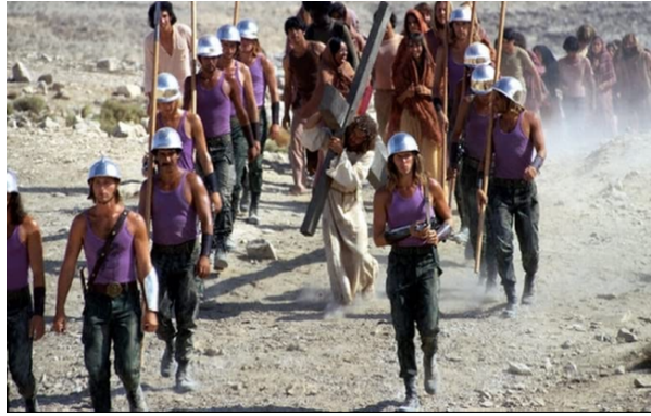
Fig. 46: Jesús camino del Calvario.