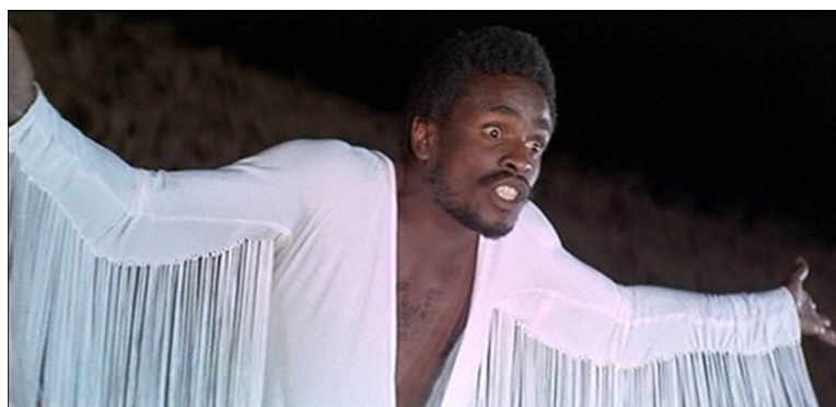
Fig. 45: Judas increpa a Jesucristo Superstar

Tras tan intensa escena, el ritmo de la historia cambia. Judas (ya fallecido) surge arropado por ángeles blancos (fig. 46), caracterizados acorde a los años setenta, con estética anacrónica, cantando a “Jesucristo Superstar”.