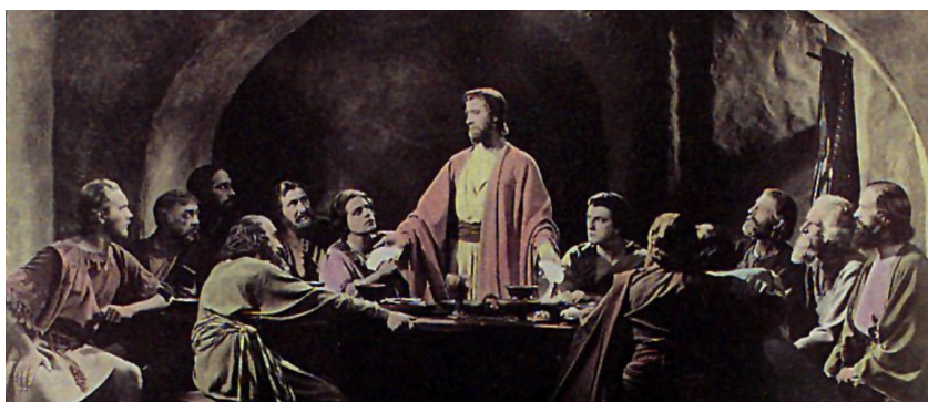
Fig. 8: Última Cena. Escena coloreada.

En otra línea diferente, estructurada atendiendo a los textos evangélicos, mencionaremos el film Rey de Reyes ( King of kings , Cecil B. DeMille, 1926). Muda, en blanco y negro, cuyas ultimas escenas son en tinte color (fig. 9). Aporta la novedad de que la historia ha sido contada desde la perspectiva de María Magdalena. Su propuesta visual se ajusta a la iconografía tradicional sin detenerse en exceso a reproducir el contexto.