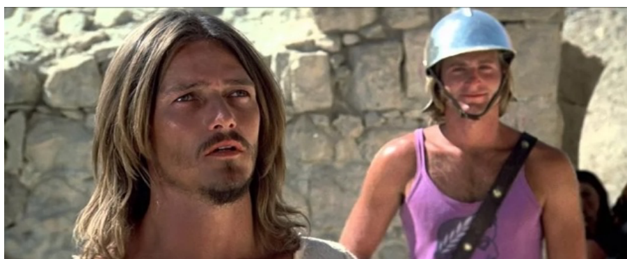
Fig. 32: Anacronismo: soldados en camiseta.

El ambiente combina elementos históricos con actuales. Romanos como guerrilleros (fig. 33) provistos de casco, ametralladoras y en camiseta, Herodes rechoncho (fig. 34) con bermudas y rodeado de féminas, parece una parodia de la mansión Playboy , Judas negro, único apóstol de color, aunque no fue intencionado, resalta como elemento discordante del grupo... y todo ello envuelto en una original puesta en escena adornada con continuos anacronismos que producen gran choque visual.