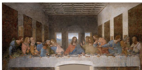
Fig. 2: La última Cena, Leonardo Da Vinci (1498)