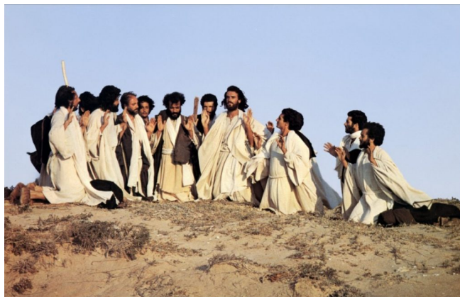
Fig. 17: Jesús y sus discípulos

El Mesías ( Il Messia , Roberto Rosellini, 1975) film neorrealista que muestra cómo transcurre la vida de Jesús (fig. 18), depurando todo hecho sobrenatural relacionado con su divinidad. Elude los milagros, la Pasión y su Resurrección y se centra en el valor de su tarea como hombre 25 .