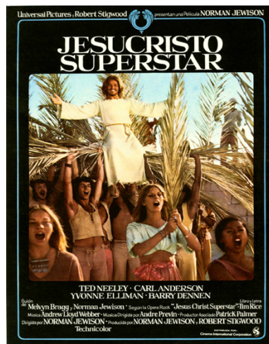
Fig. 30: Cartel del film Jesucristo Superstar .

El musical fue llevado a la gran pantalla en 1973 bajo la dirección de Norman Jewison, director experimentado en la adaptación de musicales al cine, como El violinista en el tejado ( Fiddler on the Roof , 1971), rodaje que estaba haciendo cuando le ofrecieron llevar a cabo este proyecto 44 . Jewison, realizador, productor y actor canadiense, debutó como director con el film Soltero en apuros ( 40 Pounds of Trouble , 1962) a la que siguieron otras de gran calado como En el calor de la noche ( In the Heat of the Night , 1967) o la oscarizada Hechizo de Luna . ( Moonstruck , 1987).