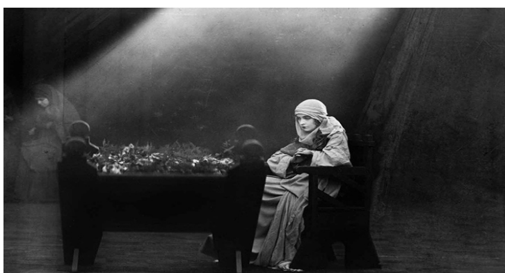
Fig. 7: Escena que va enlazando las cuatro historias

El film épico Intolerancia ( Intolerance , David. W. Griffith, 1916), dará un giro al tratamiento usual del personaje. Indaga en la esencia del título y estructura el relato en cuatro historias de injusticia acaecidas en diferentes momentos históricos (fig. 7), siendo una de ellas el martirio y Pasión de Jesús llevado a cabo por los judíos.