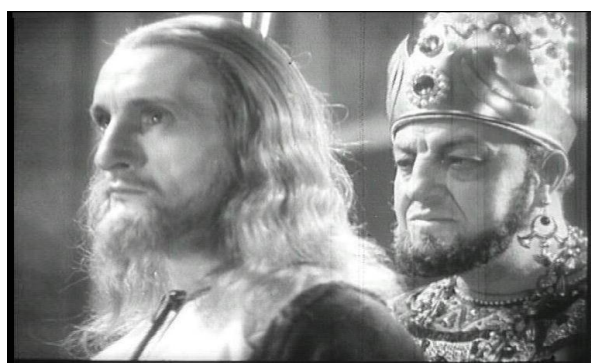
Fig. 9: Jesús ante Herodes

Francia también se ciñe en sus propuestas a la adaptación de los Evangelios. Con Gólgota ( Golgotha , Julien Duvivier, 1935) se centra específicamente en el de San Mateo. Muestra la historia de los últimos días Cristo (fig. 10) contada por sus antagonistas y ofrece una imagen de él muy humana a la par que atiende el contexto político y social del momento. Destaca la estética y tono lírico empleados, no visto en otras propuestas de films bíblicos.