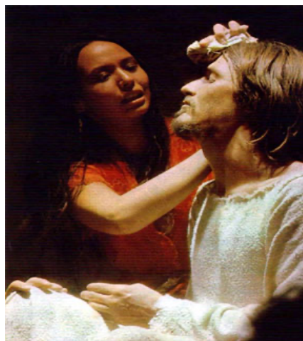
Fig. 41: María Magdalena calma a Jesús

La acción continua con el arresto de Jesús y la triple negación de Pedro, acompañados de una emotiva balada final interpretada por María Magdalena (fig. 42), en contraposición al tratamiento de la escena de Jesús ante Pilato (fig. 43), y más aún cuando es presentado ante un Herodes desvergonzado y cínico, que al son de un ritmo dinámico le pide extravagantes milagros y declara “ser su fan número 1 49 ” para nuevamente ser devuelto a Pilato.