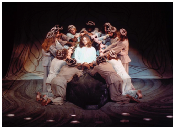
Fig. 26: Musical Broadway (1971) Mark Hellinger Theatre

La puesta en escena ofendió a grupos religiosos. Acusada de “rayar en la blasfemia y el sacrilegio” objetaban que “si no hay resurrección, no hay cristianismo 41 ”. También fue defendida por organizaciones como la estación de radio del Vaticano, que transmitía todo el álbum junto a comentarios de figuras religiosas y de sus creadores.