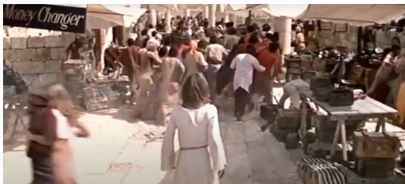
Fig. 36: Jesús en el Templo

Los Apóstoles parecen felices de seguir a Jesús, subliman su persona, se sienten relajados con la esperanza del cielo, mientras se aleja de sus mentes la resistencia que deben tener hacia los romanos. Proclaman que “Jesús es el Hijo de Dios 48 ”. Se encadenan escenas de emociones contrapuestas, como la expulsión de los mercaderes del Templo, que parece un mercado callejero actual (fig. 37). La música y cantos que acompañan a la acción, pasa de un mantra repetitivo a una suave melodía.