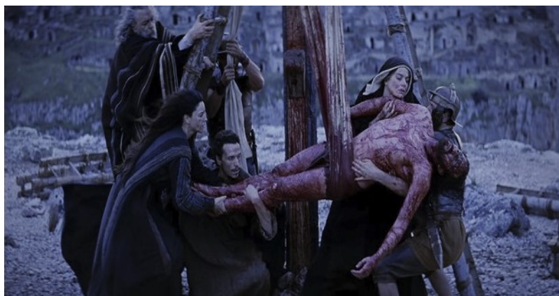
Fig. 24: Descendimiento

esperanza de Gibson de “que el mensaje de esta historia de tremendo coraje y sacrificio pueda inspirar tolerancia, amor y perdón 34 ”.