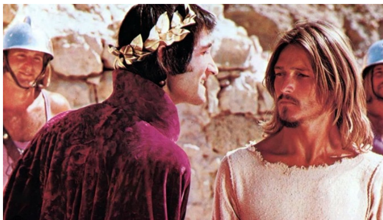
Fig. 42: Jesús ante Pilato.

El relato prosigue, destaca el momento que conduce a la muerte de Judas, escena arropada por el tema Judas' Death que en su parte final recupera el tema I don't know to love him , ya entonado anteriormente por María Magdalena; no queda claro si los sentimientos que Judas manifiesta, están relacionados con el afecto que siente por Jesús y por ella 50 o si su desencanto e ira son la consecuencia del cariz que van tomaban los hechos del supuesto “Mesías”.