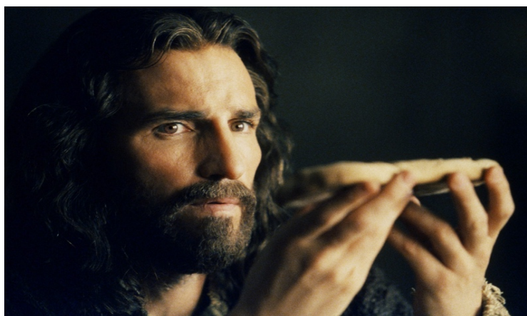
Fig. 23: Institución de la Eucaristía

En el desarrollo del metraje, Antiguo y Nuevo Testamento son entrelazados hábilmente, incluso se crean situaciones paralelas con la finalidad, atendiendo al deseo de Gibson, de que la película hablase por sí sola, sin traducir ni el latín platicado por los romanos ni el arameo de los judíos de la primera centuria 31 . El uso de primeros planos y del claroscuro (fig. 24), nos permiten visualizar con más detalle, los gestos y rasgos de los personajes, como si se tratase de un cuadro de Caravaggio 32 .