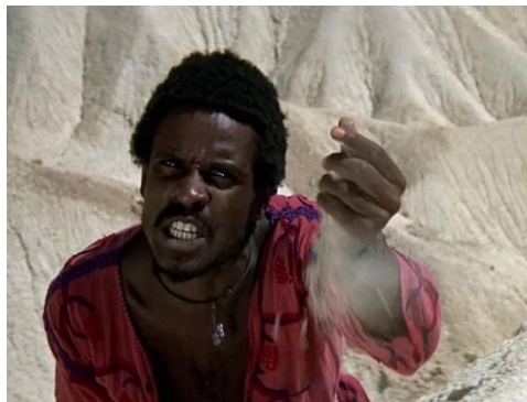
Fig. 35: Judas exultado

Los Apóstoles parecen felices de seguir a Jesús, subliman su persona, se sienten relajados con la esperanza del cielo, mientras se aleja de sus mentes la resistencia que deben tener hacia los romanos. Proclaman que “Jesús es el Hijo de Dios 48 ”. Se encadenan escenas de emociones contrapuestas, como la expulsión de los mercaderes del Templo, que parece un mercado callejero actual (fig. 37). La música y cantos que acompañan a la acción, pasa de un mantra repetitivo a una suave melodía.