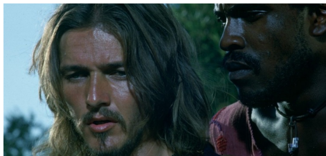
Fig. 38: Traición de Judas

La Última Cena (fig. 40) es una escena bucólica acompañada de una delicada y tranquila melodía. En su desarrollo, Jesús les manifiesta nuevamente la llegada de su muerte, la futura e inmediata traición, y cuando aflora el antagonismo con Judas, una música funky que contrasta con la relajada melodía inicial, amortigua la tensa discusión.