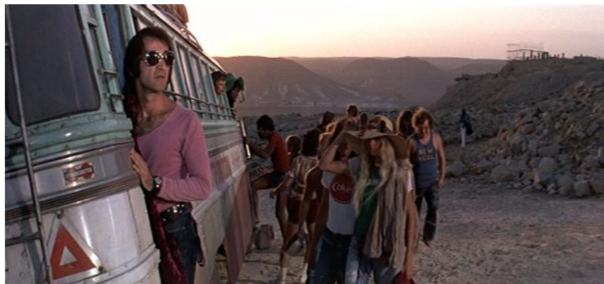
Fig. 48: Fin de la aventura

La escenificación ha llegado a su fin. Una melodía calmada, relajante y un tanto triste, John Nineteen-Forty-One -Juan 19, 41 52 acompaña al elenco de actores, cantantes y bailarines, que han intervenido en el rodaje y suben al autobús que les trajo (fig. 49). Es una escena estremecedora. No es una escena alegre. Muestran su cansancio y pesadumbre ante la experiencia que concluye. Montan ordenadamente en el autobús de retorno a sus vidas, simbolizando éste un paréntesis entre el inicio y el final del rodaje. Al fondo, cae el sol y ante él, una solitaria cruz vacía.