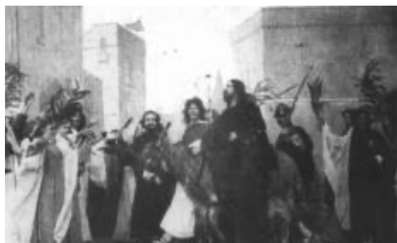
Fig. 1: Entrada en Jerusalén

Casi simultáneamente al citado film de Léar, se filmaba El juego de la Pasión de Oberammergau (fig.1) ( The Passion Play of Oberammergau , Henry C. Vincent 11 , 1898), una representación de la Pasión que acontecía en esa localidad. Su pretensión era filmar esa representación pero, debido a que hasta 1900 no se llevaría a cabo la próxima escenificación, decidió escribir la historia apoyado por Albert Eaves y Richard Hollamen.