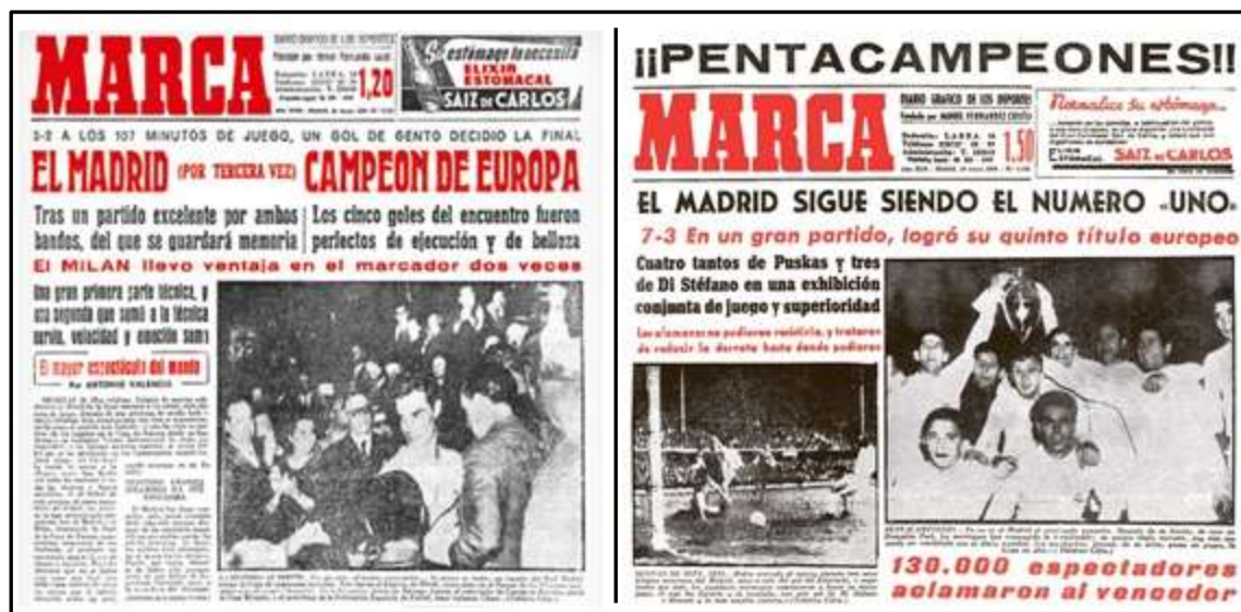
Ilustración 6. Portadas del 29 de mayo de 1958 (izq.) y del 19 de mayo de 1960 (dcha.) cuando el Real Madrid logró dos Copas de Europa

Respecto a los equipos que solía y suele tratar el diario Marca , los grandes clubes madrileños son el objeto principal de la información, es decir, el Real Madrid y el Atlético de Madrid (éste en menor medida). Al igual que en el apartado 4.1 sobre El Mundo Deportivo , se va a ejemplificar esta idea con algunas portadas de Marca correspondientes a la etapa franquista (Ilustración 6 e Ilustración 7).