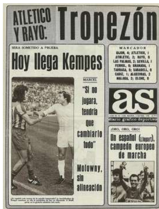
Ilustración 12 (derecha). Portada de AS del 3 de septiembre de 1978 donde ocurre lo mismo, esta vez con el atletismo y Jordi Llopart

Hacia los años 90 se va confirmando la tendencia que ya existía en el diario AS: las portadas son mayoritariamente con noticias de fútbol. A partir de ahí, con los títulos del Real Madrid y algunas hazañas del Atlético de Madrid, este deporte acapara casi todos los espacios en el periódico salvo logros tremendamente importantes en otros deportes (cuando Perico Delgado se impuso en el Tour de Francia en 1988, Arantxa Sánchez Vicario consiguió el primer Grand Slam para el tenis femenino en 1989, Carlos Sainz ganó el Mundial de Rallies en 1990, la inauguración de los JJOO de Barcelona 1992...).