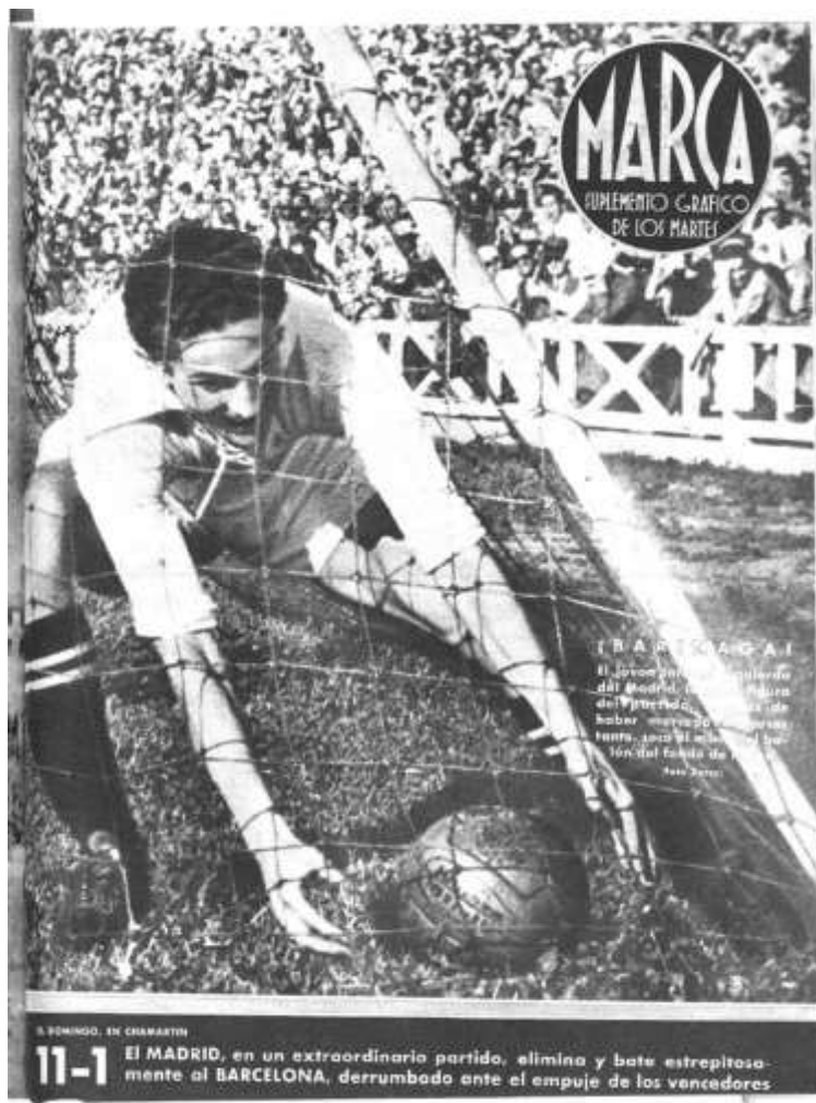
Ilustración 5. Suplemento gráfico del 15 de junio de 1943 cuando el Real Madrid le ganó 11-1 al Barcelona

Además, Marca tenía otro aspecto diferencial respecto a otros diarios y que tiene que ver con esa característica antes explicada de las fotografías e ilustraciones. El periódico publicó desde su inicio hasta 1958 un suplemento gráfico (al estilo de lo que fue Marca al comienzo) como complemento al diario, en general una vez a la semana (Ilustración 5). Trataba de buscar más el espectáculo tanto en el fútbol como en otros deportes, al margen de la cotidianeidad de los números del día a día. En él se mostraban grandes hazañas del deporte con un papel protagonista, por supuesto, de las fotos e ilustraciones 48 .