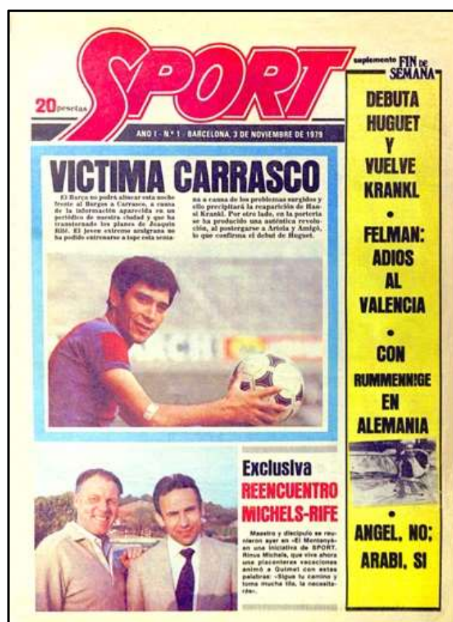
Ilustración 13. Portada del primer número de Sport (3 de noviembre de 1979)