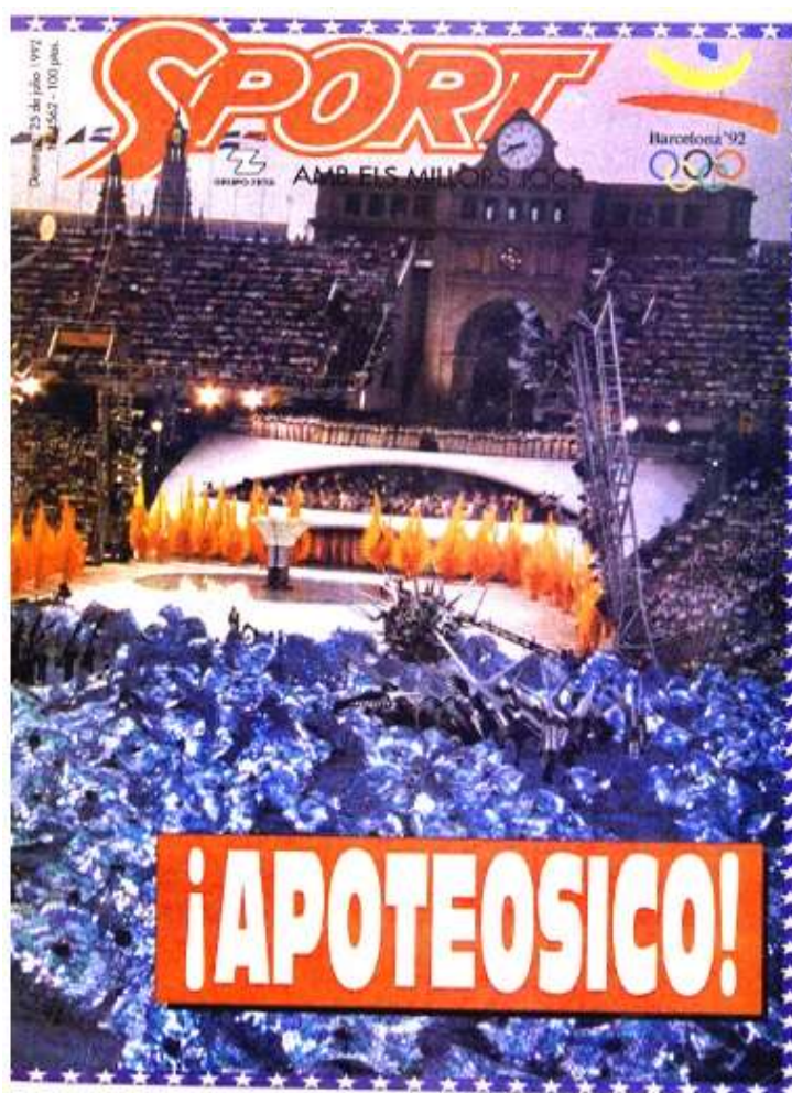
Ilustración 14. Portada de Sport del 25 de julio de 1992, día en el que se inauguraron los Juegos Olímpicos de Barcelona

Respecto a los equipos y deportes que trata el diario Sport , como ya se ha comentado, la línea está clara: el fútbol y el F.C. Barcelona eran los temas principales. A diferencia de los otros periódicos analizados (por ejemplo, Marca y AS siempre han informado sobre todo del Real Madrid pero no lo declaran públicamente), Sport sí que se ha reconocido como una cabecera barcelonista que lleva toda la información sobre el equipo culé.