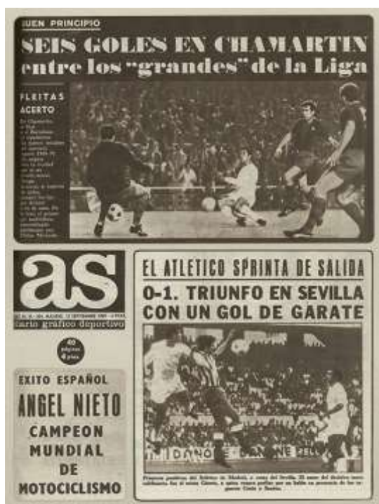
Ilustración 11 (izquierda). Portada de AS del 15 de septiembre de 1969 en la que se dedicó sólo un espacio pequeño al campeón de motociclismo Ángel Nieto

Sin embargo, es cierto que los espacios dedicados en algunas de estas portadas 61 a esos deportes no son los espacios principales sino huecos pequeños en favor del deporte estrella del diario: el fútbol (Ilustración 11 e Ilustración 12). Es el arma con el que compite frente a Marca , también porque distribuye información de los mismos equipos o al menos de la misma comunidad (Madrid), siendo el Real Madrid el mayor foco de noticias.