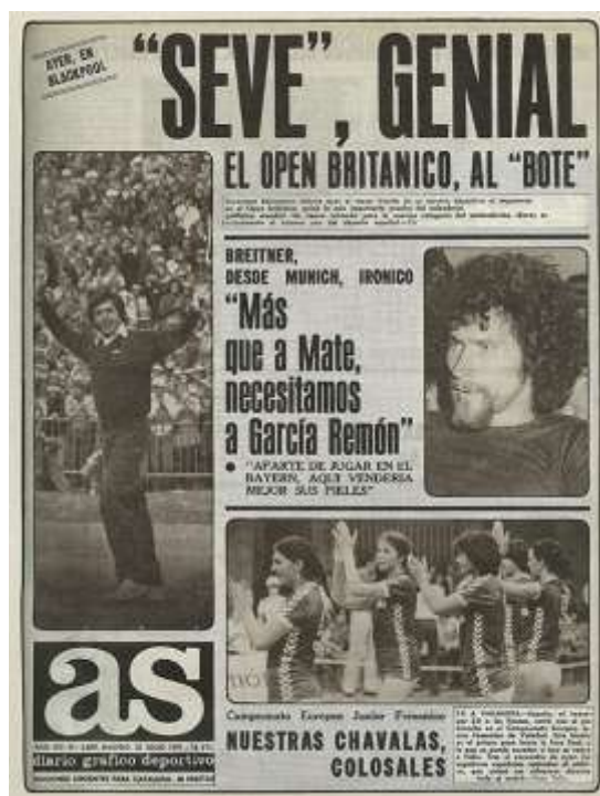
Ilustración 10 (derecha). Portada de AS del 22 de julio de 1979 cuando Severiano Ballesteros logró el British Open