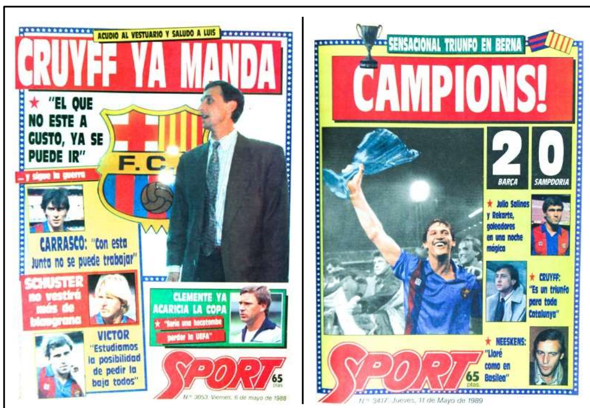
Ilustración 15 (izquierda). Portada de Sport del 6 de mayo de 1988 en la que aparece como noticia principal el debut de Johan Cruyff como entrenador del Barça