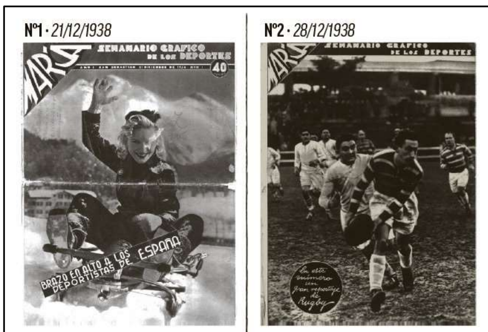
Ilustración 4. Primeros ejemplares de la historia de Marca

ilustraciones” 42 . Precisamente en estas fotos e ilustraciones se basaba el toque diferencial y especial de esta publicación, con las que se conseguía plasmar mejor la plasticidad y la fuerza del deporte (Ilustración 4). Esta característica fue clave en el éxito primerizo de Marca y se convirtió en algo fijo para su futuro.