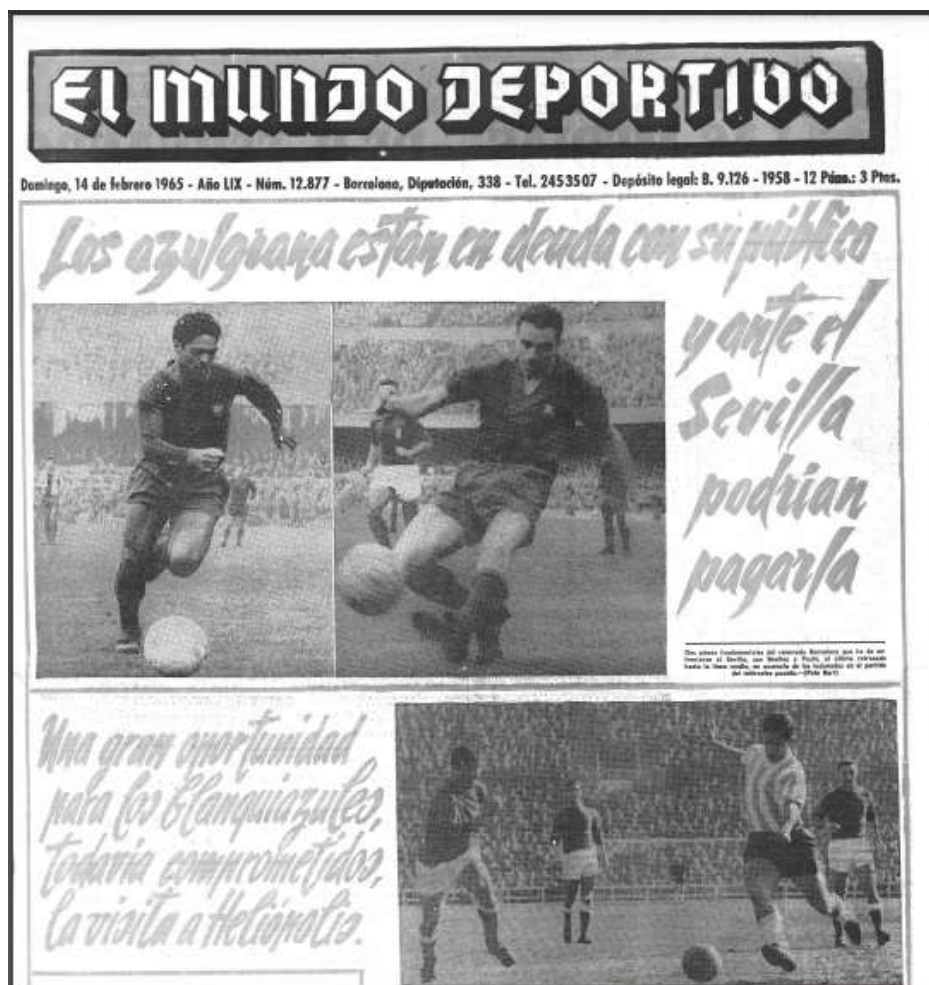
Ilustración 3. Portada de El Mundo Deportivo del 14 de febrero de 1965. Más referencias a los dos principales equipos catalanes ("azulgranas" y "blanquiazules")

El Mundo Deportivo no sería lo que es sin los directores que ha tenido durante toda su historia, de los que evidentemente algunos fueron más importantes que otros. El primero y del que es obligatorio hablar, pese a ser previo al franquismo, es Narciso Masferrer , nacido en 1867, curiosamente, en Madrid. Se trata de una persona capital tanto para el diario como para la ciudad de Barcelona porque fue el pionero y posiblemente la figura más importante en el desarrollo del deporte y de la prensa deportiva en la Ciudad Condal.