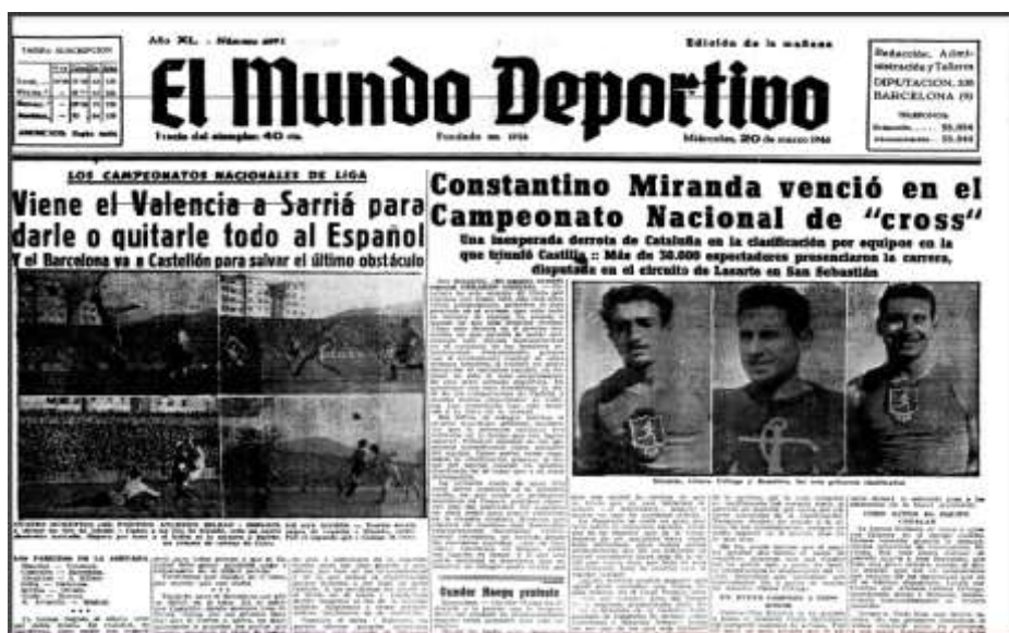
Ilustración 1. Portada de El Mundo Deportivo del 20 de marzo de 1946. En la parte superior izquierda se aprecia cómo se habla del Espanyol y del Barcelona

Al hilo del fútbol y del progresivo peso que adquirió en este medio, El Mundo Deportivo ha tenido como equipos prioritarios a lo largo de su historia al F.C. Barcelona y al R.C.D. Espanyol de Barcelona. Es decir, su contenido seguía tratando diversos deportes, pero fundamentalmente realizaban la cobertura de estos clubes y sus entornos (se debe, por lógica, a que el diario nació y se desarrolló en la Ciudad Condal), a los que daban preferencia en sus portadas (Ilustración 1, Ilustración 2 e Ilustración 3). Los siguientes ejemplos hacen referencia a tres décadas diferentes para una mejor demostración: 1940, 1950 y 1960.