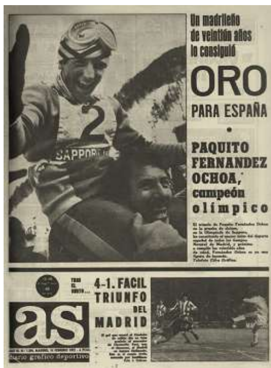
Ilustración 9 (izquierda). Portada de AS del 14 de febrero de 1972 con la medalla olímpica del esquiador Paquito Fernández Ochoa como noticia principal

El diario AS gozaba de un abanico muy amplio y realizaba noticias y portadas de otras disciplinas como el motociclismo, esquí (Ilustración 9), ciclismo, baloncesto o golf (Ilustración 10). Varias de las noticias sobre estas actividades tenían que ver también con los Juegos Olímpicos de turno.