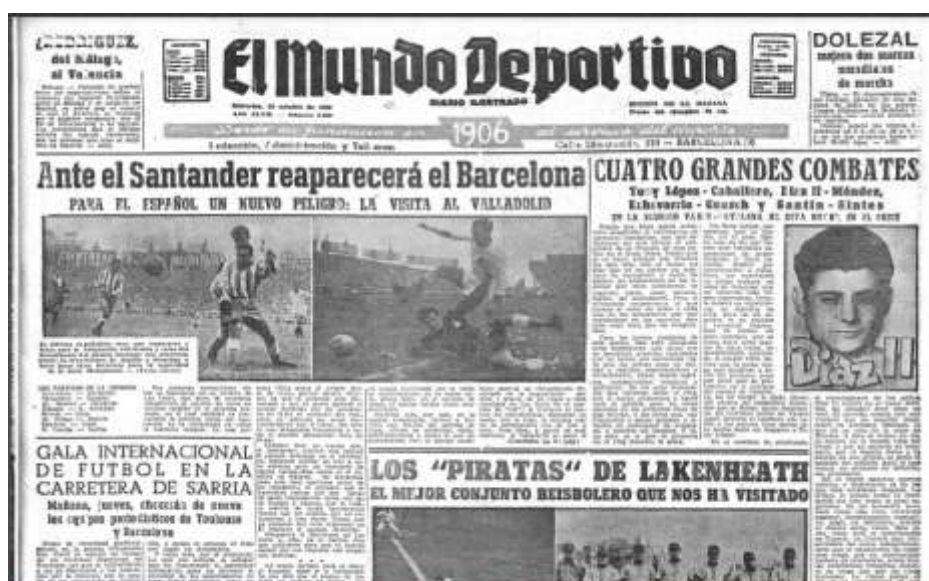
Ilustración 2. Portada de El Mundo Deportivo del 15 de octubre de 1952. Igualmente se observa arriba a la izquierda información del Barcelona y del Espanyol