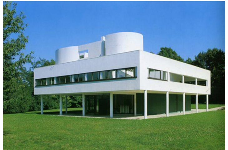
Fig.7. Villa Savoye, Francia