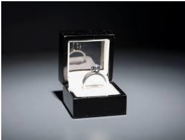
Fig.6. Anillo Luis Barragán