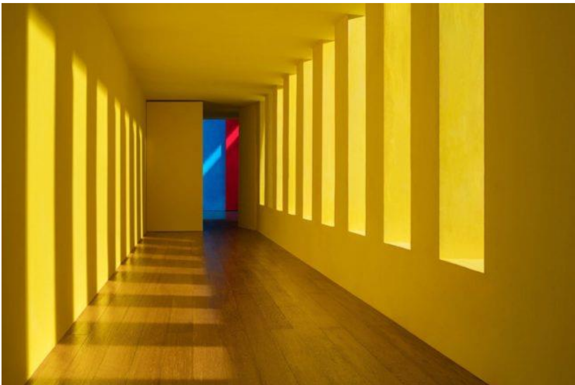
Fig.9. Casa Gilardi, México