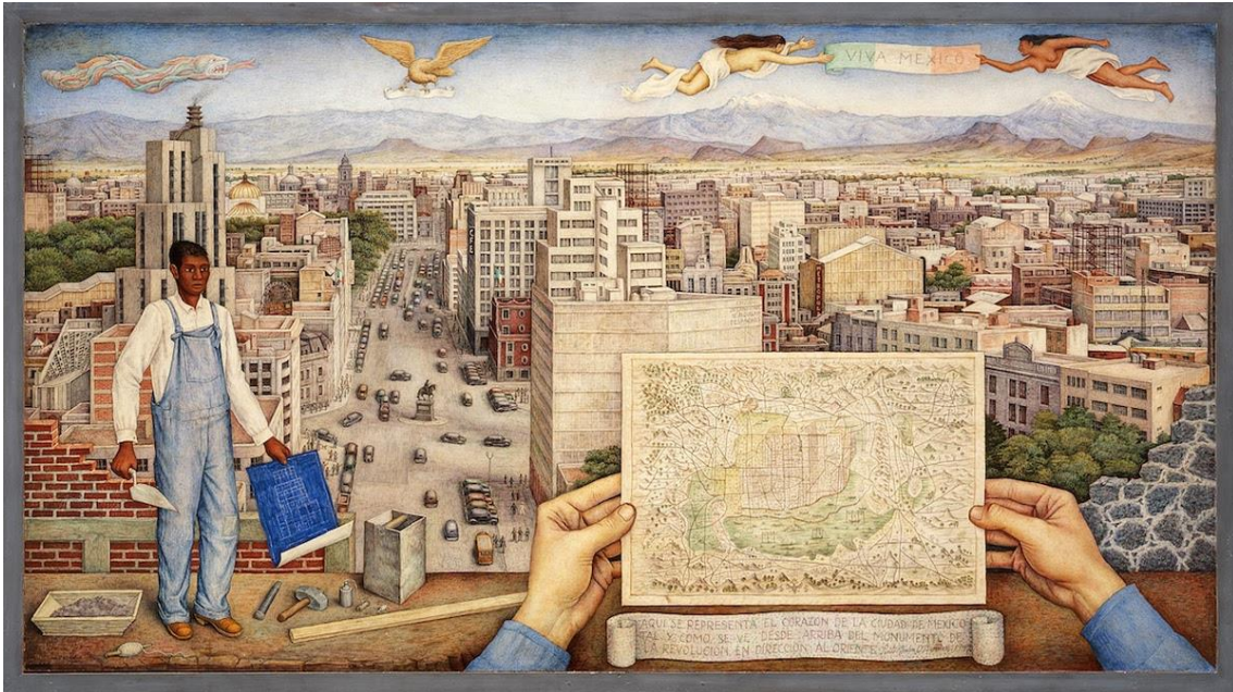
Fig.1. La Ciudad de Mexico, Juan O'Gorman