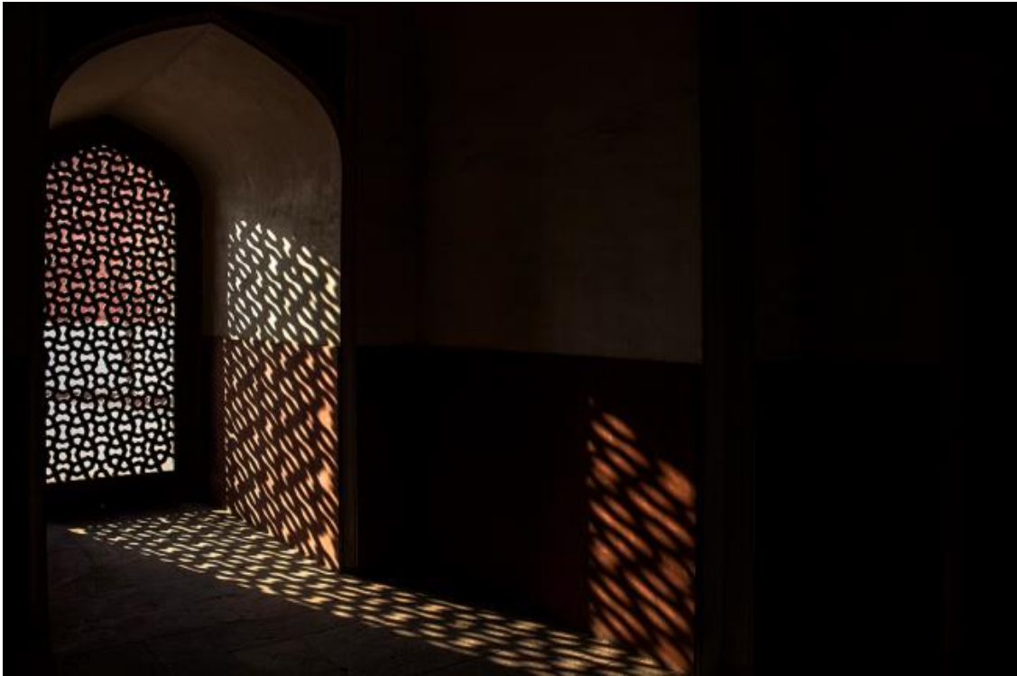
Fig. 8. Celosías