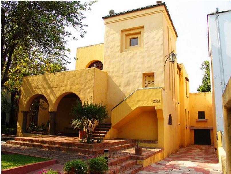
Fig. 16. Casa Luna