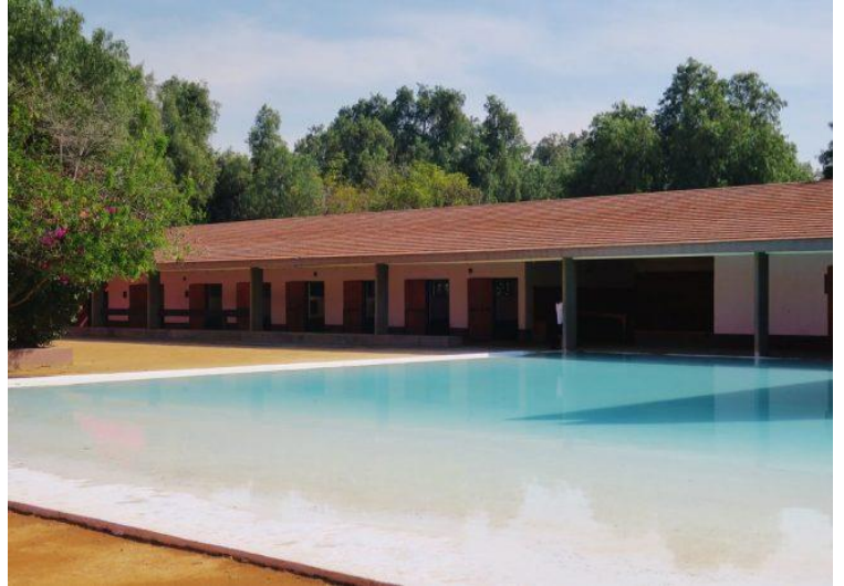
Fig.5. Cuadra de San Cristóbal