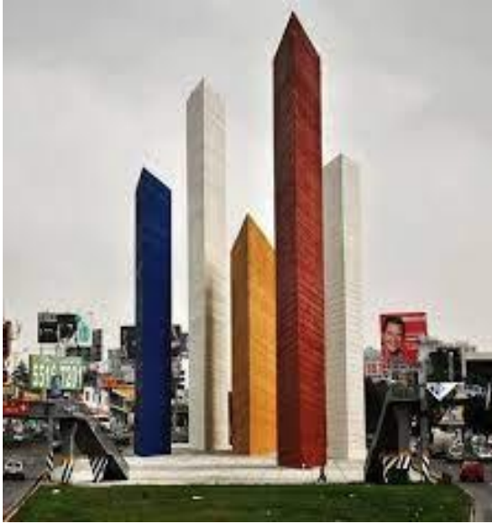
Fig.4. Ciudad Satélite