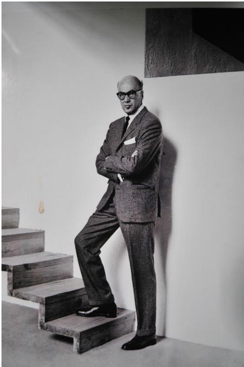
Fig.2. Luis Barragán