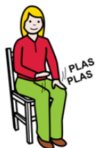
Darse golpes en las rodillas con las manos

Imágenes partes del cuerpo con las cuales se dirige a los alumnos para que realicen sonidos.