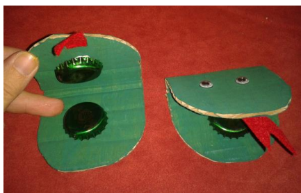
Castañuelas: Imagen de Pinterest , por Vanessa Nieto Perez (Visitado el 22 de mayo de 2021)

https://educaimagenes.com/manualidades/instrumentos-musicales-caseros-para-ninos/