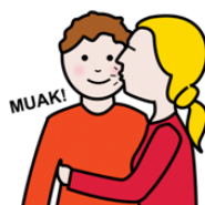
Dar un beso