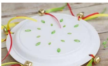
Pandereta: Imagen de Educaimágenes , 10 instrumentos musicales caseros para niños (visitado el 22 de mayo de 2021)

http://www.clubpequeslectores.com/2015/06/manualidad-instrumentos-musicales-caseros.html