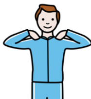
Darse golpes en los hombros