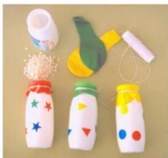
Maracas: Imagen de Pinterest , por Maria Irosa (visitado el 22 de mayo de 2021)

Al finalizar la creación de los instrumentos nos reuniremos en asamblea y todos los tocaremos los instrumentos que hemos creado a la vez, como una pequeña orquesta, y también podemos dirigirles para que la melodía sea más armónica, por ejemplo, “Ahora tocan las maracas, paramos y tocan los tambores...”