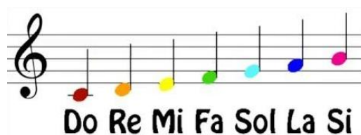
Fig. 7 – Las siete notas coloreadas, en la escala ascendente de Do mayor (Anexo III)