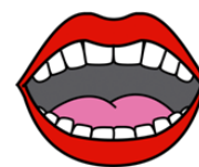
Realizar sonidos con la boca

La imagen en la cual se indica que hay que hacer sonido dándole un beso a un compañero, se llevará a cabo según el momento que se esté viviendo. Por lo que en este momento actual de COVID-19 no se puede realizar de esa manera si no que el beso se lanza al aire, esto hay que explicárselo a los niños.