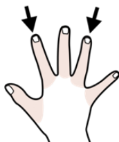
Hacer chasquidos con los dedos