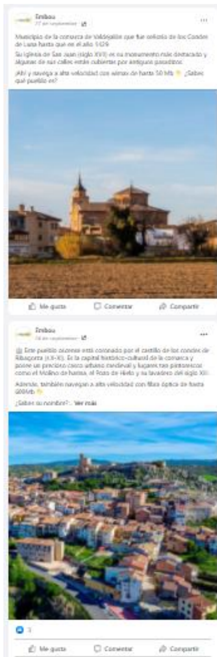
Ilustración 2 Publicaciones sobre pueblos de Aragón en el perfil de Facebook