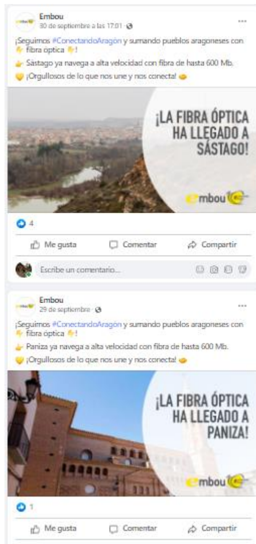
Ilustración 3 Publicaciones sobre noticias en pueblos de Aragón en Facebook