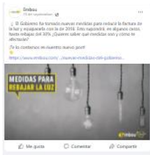
Ilustración 4 Publicación del post de blog semanal en Facebook