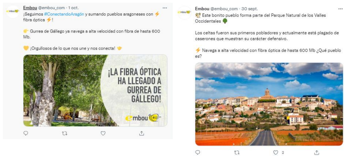
Ilustración 6 Publicaciones sobre pueblos de Aragón en Twitter @embou_com