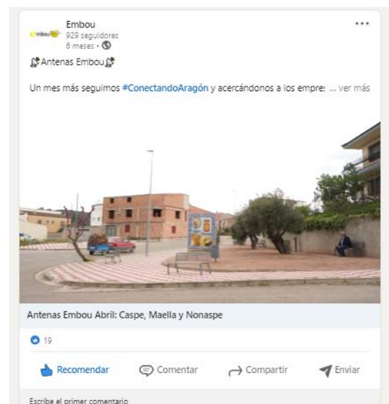
Ilustración 7 Publicaciones en LinkedIn