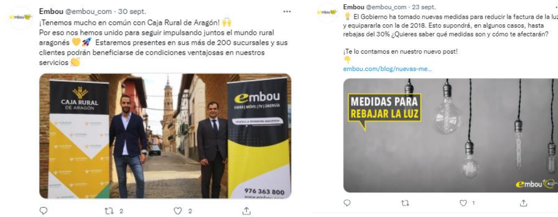
Ilustración 5 Publicaciones sobre noticias y post de blog en la cuenta de Twitter @embou_com