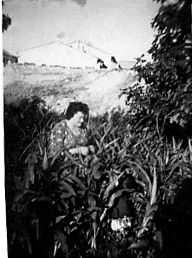
Ilustración 1. Mujer Zaragozana trabajando en el campo. Años 50.

Además, a partir de este Plan de Estabilización, cuando los empresarios empezaron a demandar mano de obra poco cualificada, para trabajos en los que no se requería fuerza, pero sí destreza, encontraron en las mujeres lo que buscaban ya que, además de ser mano de obra barata, generaban poca conflictividad. (Molinero & Sarasúa, 2009)