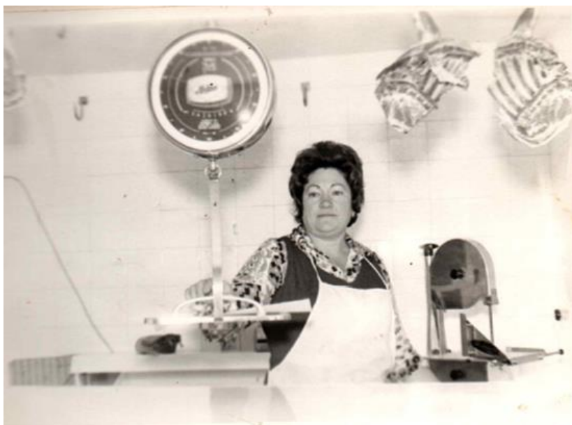
Ilustración 5. Mujer Zaragozana, trabajando en la carnicería familiar.

Ejemplo de ello es la siguiente fotografía, aportada por una de nuestras entrevistadas, en la que se le ve trabajando en la carnicería familiar (en la que ella nunca estuvo dada de alta en la Seguridad Social, aunque trabajó toda su vida).