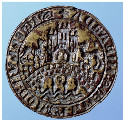
Figura 4. Matriz del sello del Concejo de Miranda del Castañar.