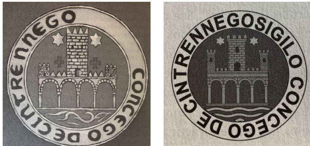
Figura 6. Propuesta de recreación, realizada por Remírez (2016, pp. 449, 458, 463).

Alrededor de todo el conjunto descrito, ambos sellos llevan la siguiente leyenda circular, enmarcada dentro de una orla perimetral, formada por una línea interna y otra externa: [sigilo] concego de Cintrennengo. A pesar de que ninguna de estas leyendas está completa, como consecuencia de la pérdida de la cera y del desgaste del papel en el que quedaron adheridos ambos sellos, es indudable que la primera palabra que debería preceder al «Concejo de Cintruénigo» debería corresponder a sello [sigillo], seguramente grabada de forma completa como se deduce por el amplio espacio que queda en la leyenda circular 33 .