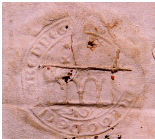
Figura 3. Sello utilizado por el Concejo de Cintruénigo, en 1549 19 .

no se cita explícitamente que su elemento principal sea un puente, no ha lugar a dudas, sentándose así el error que se ha perpetuado hasta nuestros días.