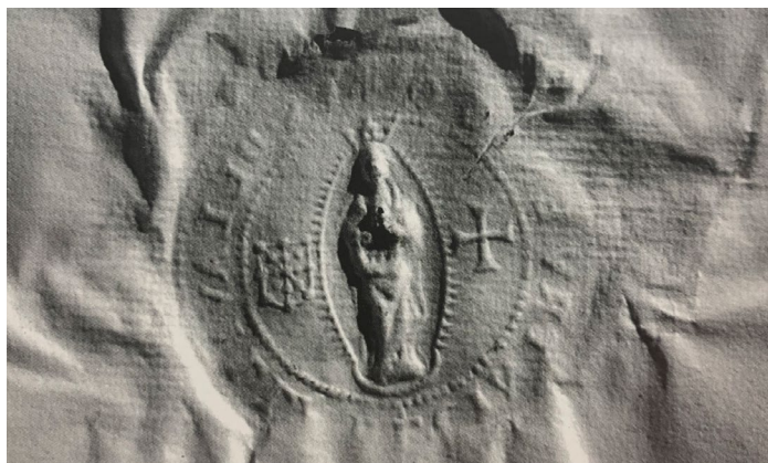
Figura 7. Sello de la villa de Cintruénigo, de la primera mitad del siglo XVII 37 .

probable que, como las dos cruces patadas, estos elementos estén duplicados en el sello por una mera cuestión estética, ya que, al no poder representarlas sobre la torre mayor, por falta de espacio, no debió de quedar más remedio que hacerlo entre esta y las torres menores, duplicándolas simétricamente. Pero, mientras no se encuentre un testimonio que explique su presencia, todo esto no pasan de ser más que meras conjeturas.