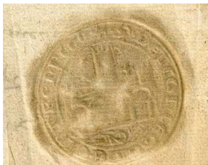
Figura 8. Sello del Concejo de Cintruénigo, fechado el 20 de mayo de 1541 38 .

La aparición de una nueva instancia del sello del Concejo de Cintruénigo (fig. 8) nos ha permitido reconstruir completamente su leyenda, corrigiendo la propuesta que, a tal fin, hemos visto que realizó Remírez. Puesto que, lo que realmente se lee en la leyenda del sello de Cintruénigo, es: «✠ • S • DEL CONCEGO DE • CINTRENNEGO». Esto es, «✠ • S[i]gillum] • DEL CONCEGO • DE • CINTRENNEGO •».