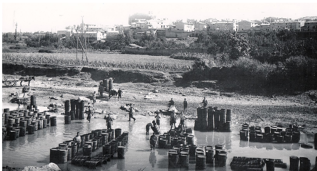
Figura 11. Vista de Cintruénigo, 1948. Al fondo, la calle Espeñas y, sobre ella, la villa.

De ahí que, en 1630 43 , a la hora de representar la villa de Cintruénigo de forma esquemática (fig. 12), esta fuera pintada sobre las peñas en las que se encontraba el Arrabal y el contiguo barrio de la Puerta de Fitero, con el que continuó la expansión