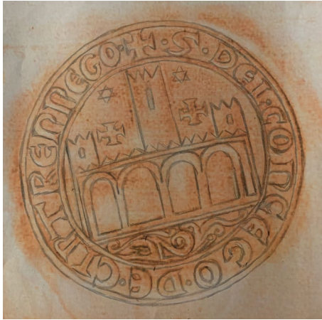
Figura 15. Reconstrucción completa del sello del Concejo de Cintruénigo.

plaza de toros carbonera y en la que, previamente y desde 1634, se fundó un convento de los Hermanos Menores Capuchinos.