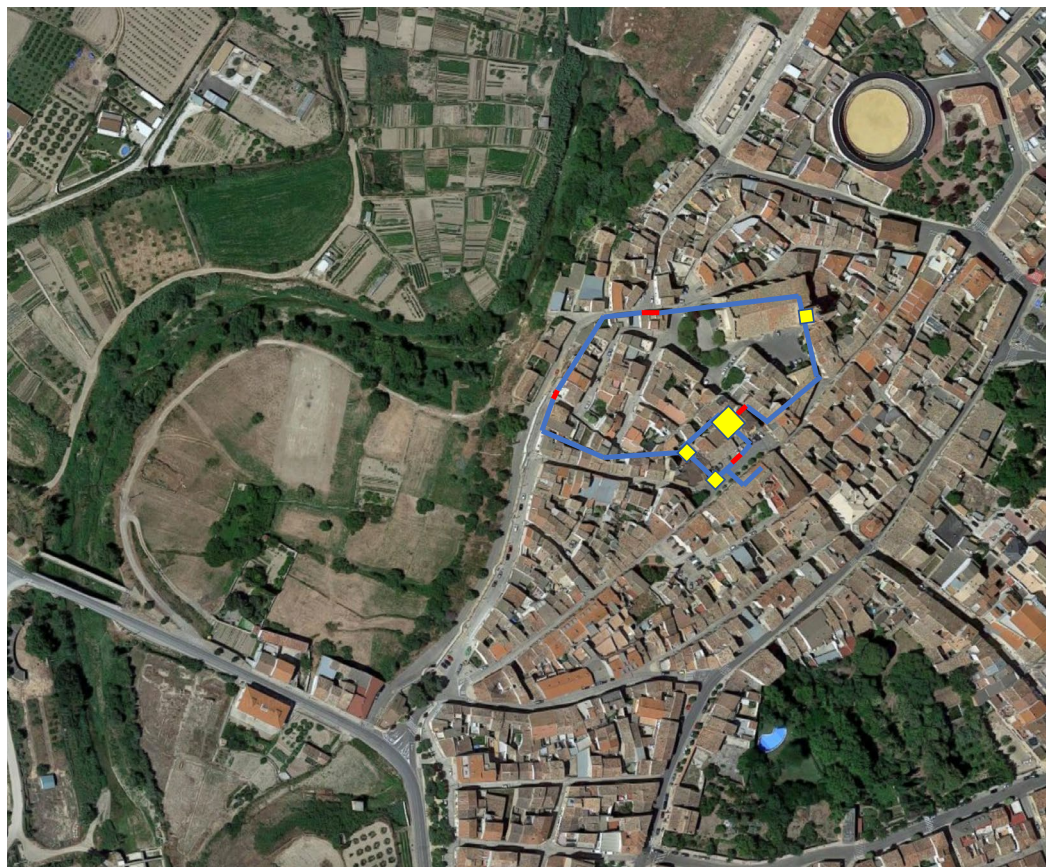
Figura 1. Hipotético trazado del recinto amurallado medieval de la villa de Cintruénigo, «adosado en su lado suroeste al castillo y en el lado oriental a la iglesia», esto es, en dirección hacia Tudela 3 .