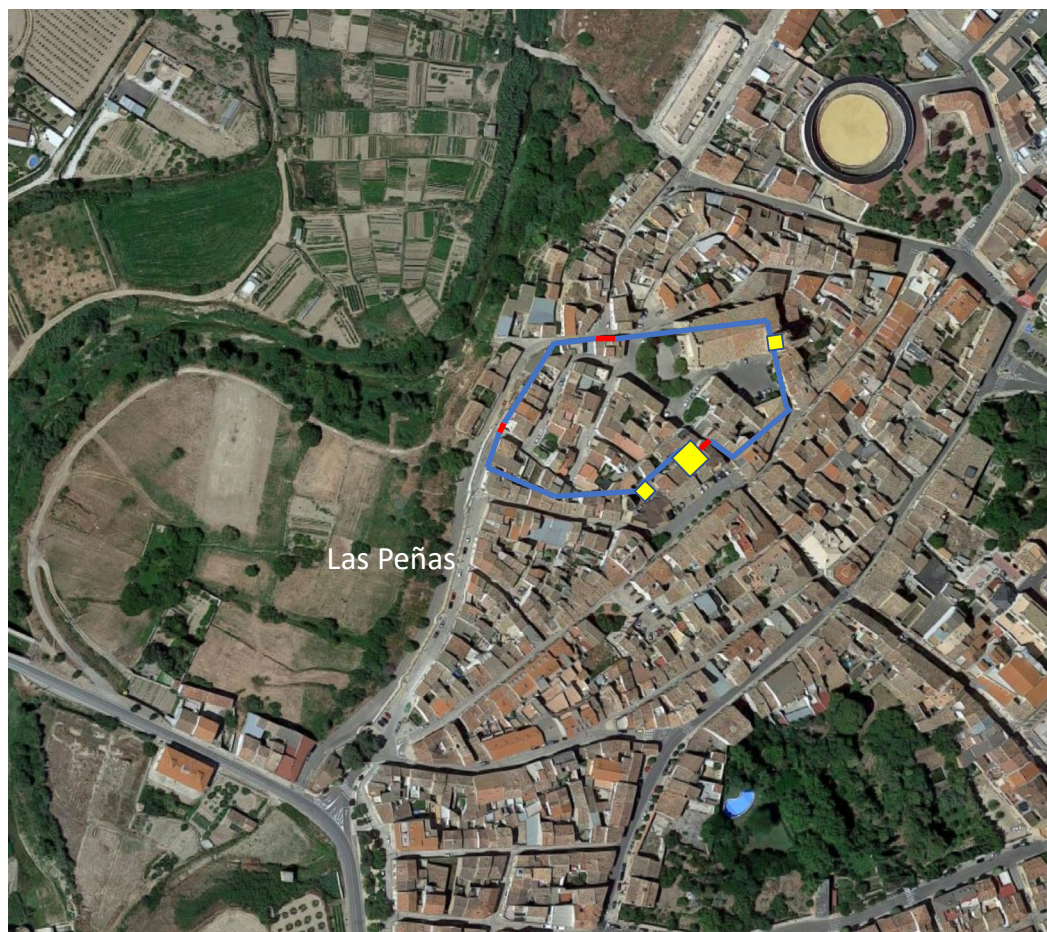
Figura 9. Hipotético trazado del recinto amurallado medieval de la villa de Cintruénigo, sobre las Peñas.

Una descripción en la que queremos destacar el dato de que la villa de Cintruénigo estaba asentada sobre una pequeña elevación, las citadas peñas (fig. 9), sobre las que luego volveremos.