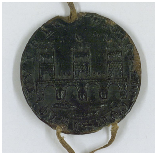
Figura 5. Sello de Tudela.

sus aguas, aunque estas no están representadas de ninguna otra manera, incluidas sus ondas (fig. 5) 26 .