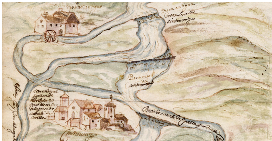
Figura 13. Vista de la villa de Cintruénigo, en 1630, sin la torre mayor, pero con las dos menores.

tica, las torres no se aprecian al estar entremezcladas con las casas que hay en segundo plano. No obstante, la forma de representar las que están en primera línea, en la vista esquemática, parecen estarlo bajo una arquería de porches, que nos permite identificar a estos con los arcos que aparecen en los sellos del Concejo de Cintruénigo, en los que quedaría, en segundo plano, o sea, tras las casas del Arrabal, la muralla de la villa, así como las tres torres que debían de sobresalir por encima de esta, tal y como se verían para alguien que las observara, a mediados del siglo XVI, desde el puente de Cintruénigo. Lo que también nos permite identificar las supuestas ondas del sello carbonero, con las peñas sobre las que se construyó la villa de Cintruénigo, tal y como también se ve en la representación esquemática de 1630.