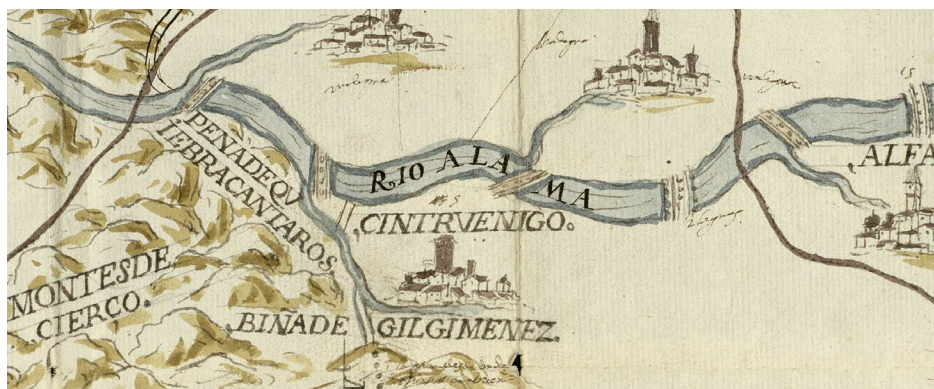
Figura 10. Representación de la villa de Cintruénigo, a mediados o en la segunda mitad del siglo XVI 42 .