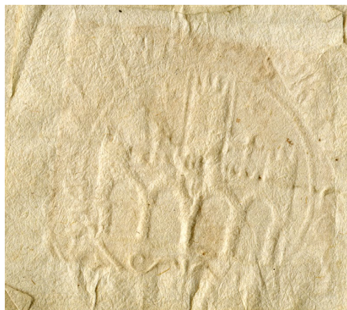
Figura 2. Sello utilizado por el Concejo de Cintruénigo, fechado en 1635 (entre el 23 y el 30 de agosto).