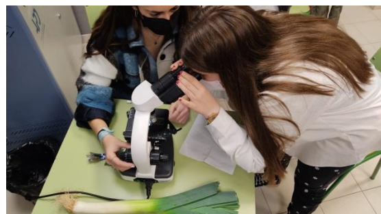
Fig 1 y 2. Imágenes de la actividad del visionado de la epidermis de las hojas al microscopio

- 2º Dendrocronología : La actividad consistía en salir al patio del centro y buscar un árbol con el tronco partido (corte transversal) y contar los años de un árbol a partir de los anillos que se podían observar fácilmente. Previamente, entre todos debían leer un documento en la tablet donde a través de imágenes y texto se explicaba lo que era la dendrocronología y cómo podían conocer la edad de un árbol utilizando este método. Una vez leído el documento, el alumnado salía al patio y tras contar, debatían y consensuaban la respuesta hasta decírsela a la docente. Además, debían responder entre todos a la pregunta: ¿Qué tejidos vegetales intervienen en la dendrocronología?