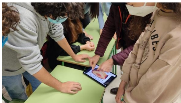
Fig 3. Imagen de alumnas realizando la actividad de repaso sobre la edad de un árbol antes de salir al patio a verlo in situ.

- 3º Adivinando órganos, tejidos y células a través de la mímica : Esta actividad consistía en que una persona debía elegir un concepto aprendido durante la unidad didáctica e intentar que el resto del grupo adivinara cuál era, únicamente expresándose a través de los gestos y la expresión corporal. Para poder ser capaz de expresar y transmitir un concepto de histología vegetal, previamente se ha de tener un esquema mental sobre el funcionamiento de la planta, la relación entre los tejidos, sus funciones etc. por lo que además de divertirse reforzaban el aprendizaje.