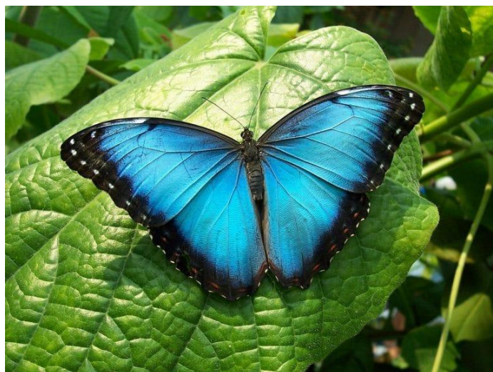
Imagen 2. Ejemplo azul naturaleza.