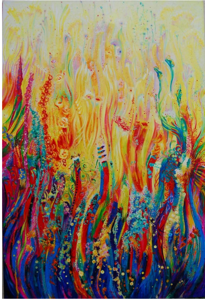
Imagen 5. “Alegría” de Judith Grettell.