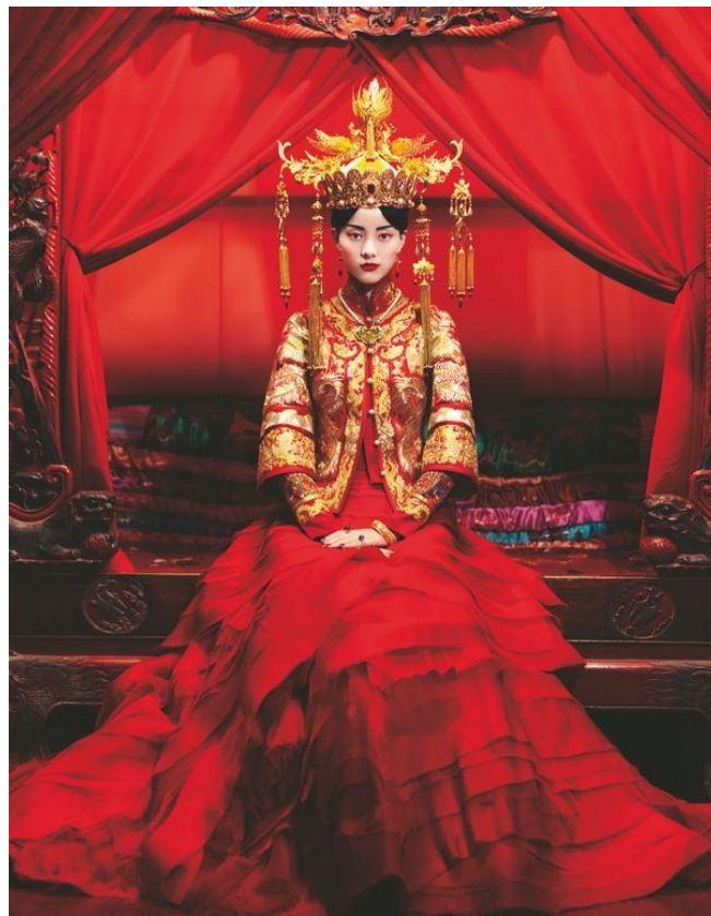
Imagen 4. Ejemplo rojo vestido de novia chino.

https://www.ecoticias.com/userfiles/2019/noviembre/11nov/zpinguverti.jpg