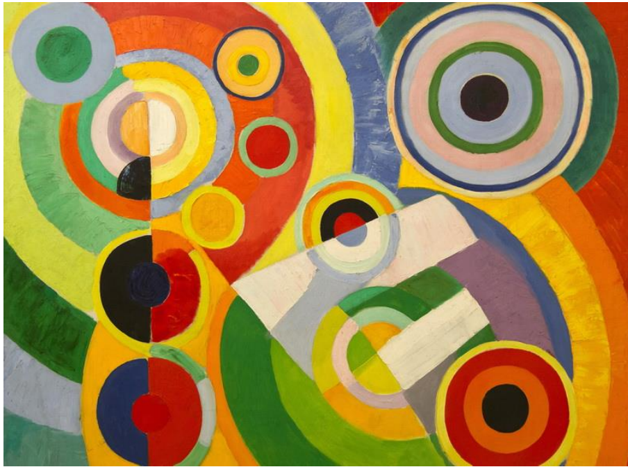
Imagen 6. “El Ritmo de la Alegría de Vivir” de Robert Delaunay.

Recuperado de https://cuadrosfamosos.es/obras-de-arte/top/24723/el-ritmo-de-la-alegría-de-vivir