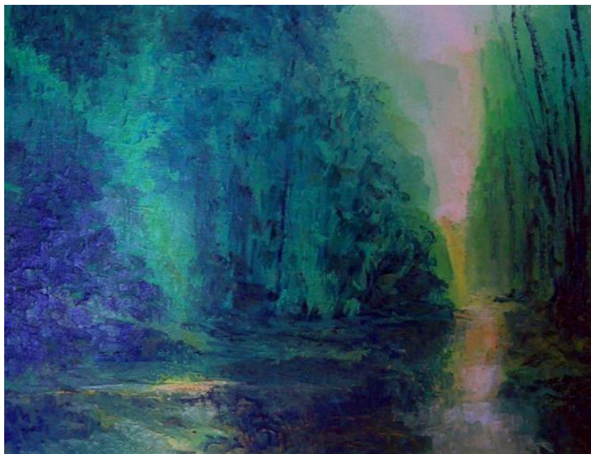
Imagen 7. “Tristeza” de Delman, 2008.