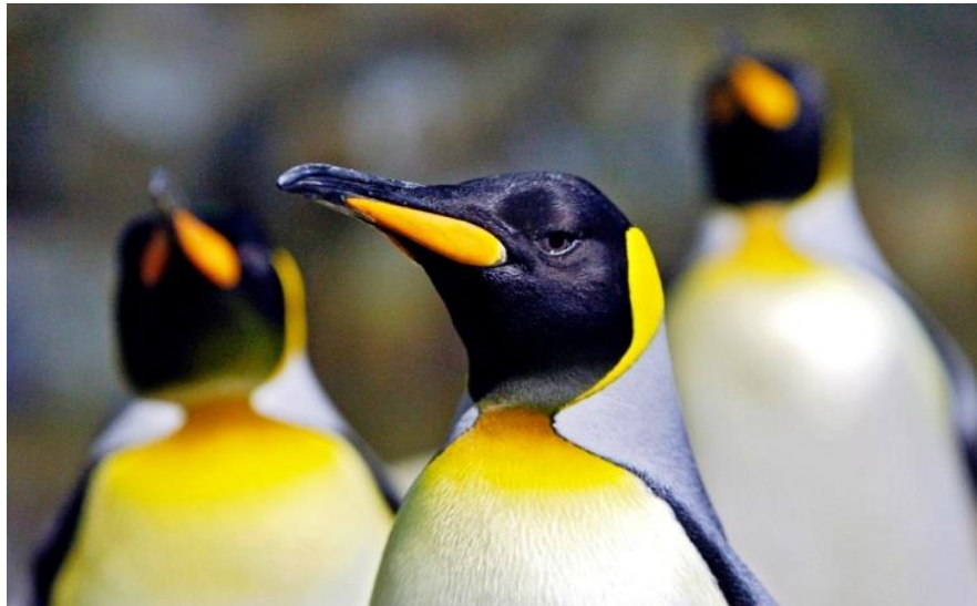
Imagen 3. Ejemplo amarillo pingüino Emperador.