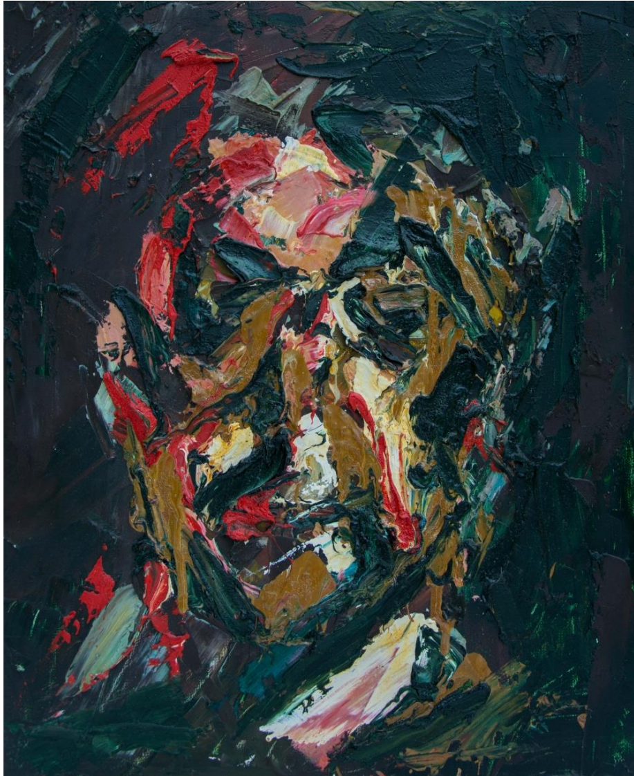
Imagen 9. “Miedo” de Curiaqui.