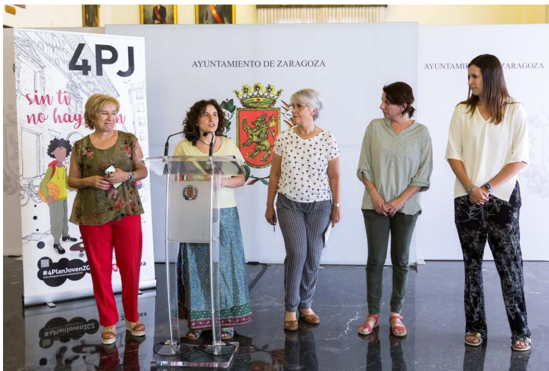
Imagen del 4 Plan Joven ZGZ, el 20 de junio de 2018.

Mejoras de ayudas a la emancipación joven. Aumento del presupuesto para ayudas al alquiler de jóvenes, que ya se ha hecho efectivo en la convocatoria de este 2018, con 350.000 euros, lo que supone un incremento del 43%.