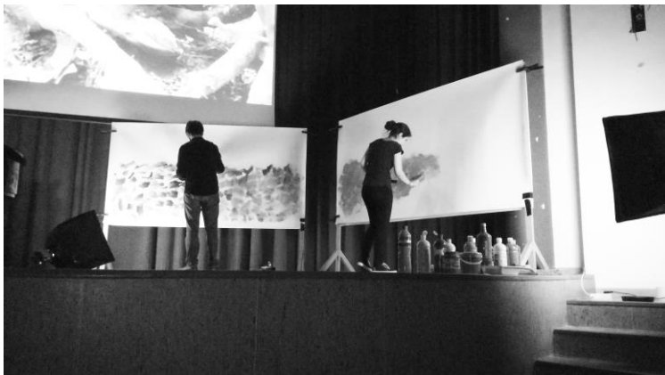
Figura 4. Estudiantes durante la intervención.

Desarrollamos el tema mientras suena la música. Dos estudiantes de pintura intervienen de forma paralela a un pianista. De forma ordenada a cada pieza de Debussy le va a acompañar el color que van aplicando los pintores de primer curso de Bellas Artes.