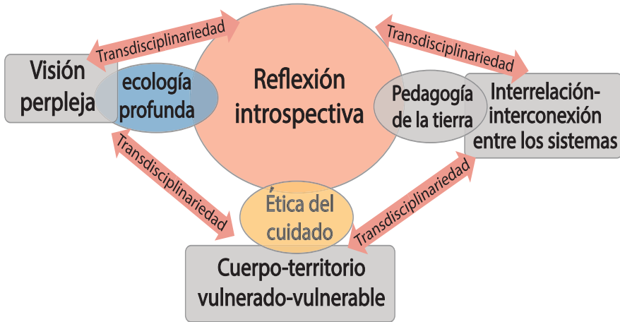
GRÁFICO 1. BASES DE LA RECONSTRUCCIÓN ECOFEMINISTA EN AMÉRICA LATINA