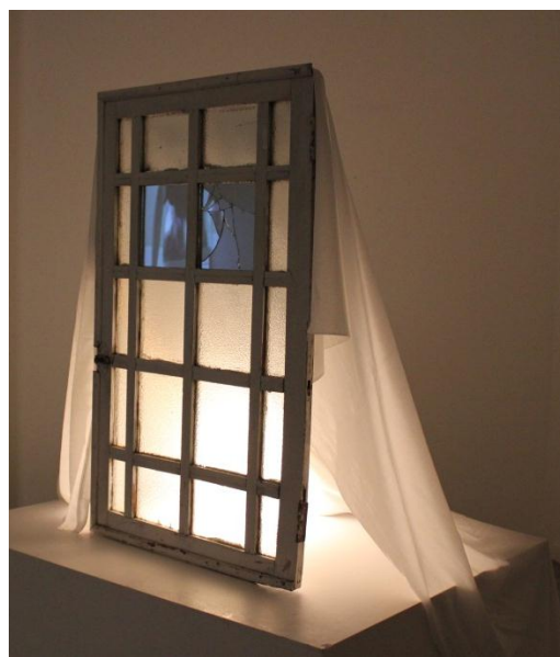
Mirarte en la ventana. Escultura

En cambio, la ventana , nos permite el acceso a otra estancia pero únicamente con la mirada. Vuelven a ser frontera entre lo interior y lo exterior, dónde, a través de ellas, se construye nuestro entendimiento del mundo exterior.