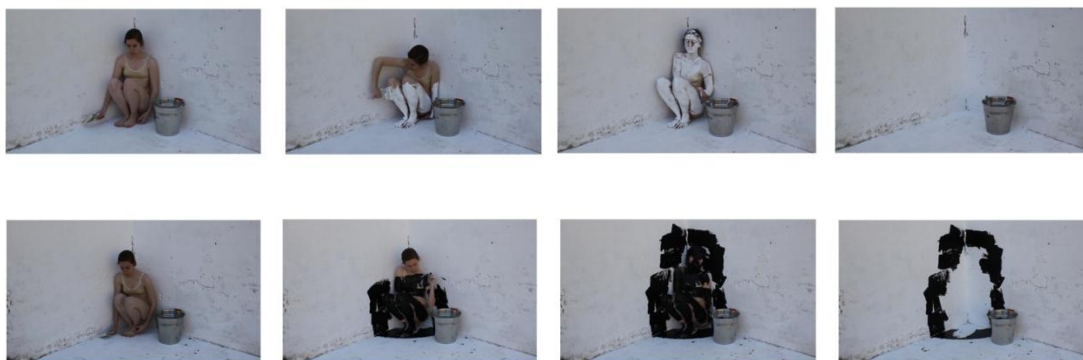
Fotogramas de Se replegó, des_apareció . Video-performance, 10’.

La inmovilidad irradia. Se construye una cámara imaginaria alrededor de nuestro cuerpo que se cree bien oculto cuando nos refugiamos en un rincón. (...) Hay que designar el espacio de la inmovilidad convirtiéndolo en el espacio del ser” 30