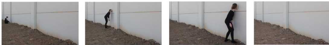
Fotogramas de Frottage. Documentación de performance, 5' 29”.

“Cuelgo un cuadro en la pared. Enseguida me olvido de que allí hay una pared. Ya no sé lo que hay detrás de esa pared, ya no sé que hay en una pared, ya no sé que esa pared es una pared, ya no sé qué es eso de una pared. Ya no sé que en mi apartamento hay paredes y que, si no hubiera paredes, no habría apartamento. La pared ya no es lo que delimita y define el lugar en que vivo, lo que le separa de los otros lugares donde viven los demás, ya no es más que un soporte para el cuadro” 24