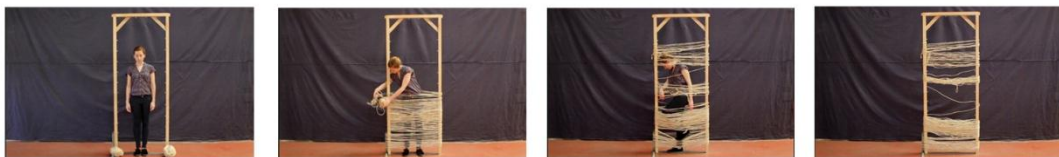
Fotogramas de Hilvanar el umbral. Documentación de performance, 37' 15".

“Cuando la puerta se abre, la figura en el umbral representa la ambigüedad del paso. Incierta entre dos piezas, vacila o se arrepiente. Se asoma sin cruzar, observa, se retira. La puerta cede dócil, pero la entrada se resiste, protegida por una malla tupida de invisibles convenciones: esa malla es la red que encierra lo privado” 35