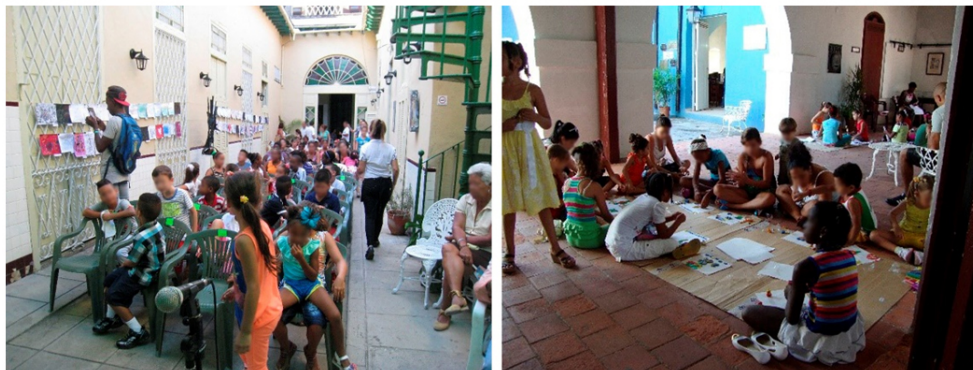
Figura 2. Observación de actividades educativas Museo de Arte (izquierda) y Palacio de Junco (derecha).

A través del proceso observacional (ver figura 2), se pudo comprobar el cumplimiento de los descriptores planteados, se constata que todos los museos emplean recursos representativos de la categoría patrimonial predominante en la institución (objetos, imágenes, textos, maquetas, etc.), para establecer una relación holística y experiencial. Si bien es cierto que la falta de recursos materiales y humanos incide en los resultados obtenidos en algunas instituciones, es indudable que los educadores tienen interiorizado un discurso que apela a la formación integral de los participantes y a la socialización del patrimonio. Estos aspectos llevan al desarrollo de la competencia de conocimiento y valoración del patrimonio , que se ha alcanzado con mayor nivel de calidad y de forma más unánime en las instituciones. Este aspecto es precisamente uno de los más ausentes en la evaluación de programas en los estudios contemporáneos (Fontal & García-Ceballos, 2019), por lo que en este sentido destacamos su notable calidad, que puede deberse a la conciencia social y la relación del país con su historia, sus experiencias y transformaciones (García-Ceballos et al., 2017).