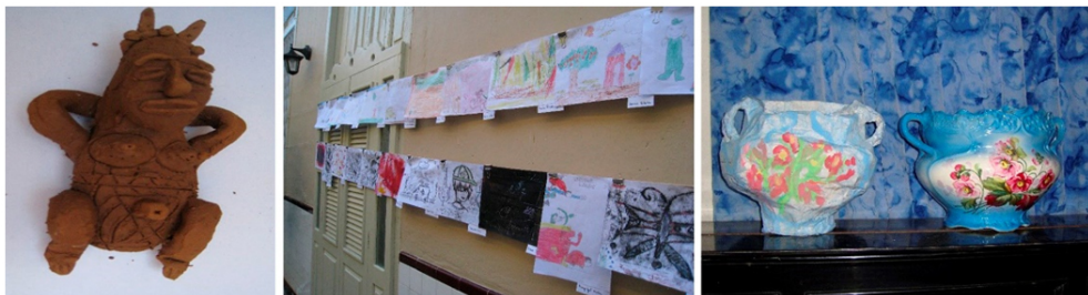
Figura 3. Piezas elaboradas por los participantes en diferentes talleres.

En relación con la competencia cultural y artística , los educadores implementan acciones que contribuyen a desarrollar habilidades de creación artística mediante el empleo de recursos representativos de las diferentes categorías patrimoniales que albergan estas instituciones (ver figura 3). Esto permite trabajar y experimentar diversos estilos y técnicas artísticas y sensibilizar sobre la necesidad de preservar el legado cultural y artístico, desarrollando actitudes de valor y respeto. De igual modo, se propicia el conocimiento del entorno y la interacción con el mundo físico abordando las transformaciones del su contexto y paisaje como consecuencia de la acción humana. Las acciones realizadas, también incluyen la competencia social y ciudadana , con un nivel de adecuación un poco más bajo y variable que la anteriormente citada, sujeto a la etapa educativa de los grupos visitantes. En sus discursos educativos los museos inician las visitas dando a conocer la institución y sus funciones, y a lo largo de la misma entremezclan los contenidos para tratar hechos y acontecimientos, memoria, causas y consecuencias de la historia de Cuba y su legado, para ofrecer información sobre las sociedades pretéritas y actuales y propiciar en los participantes experiencias múltiples que fomenten una sociedad comprometida y respetuosa.