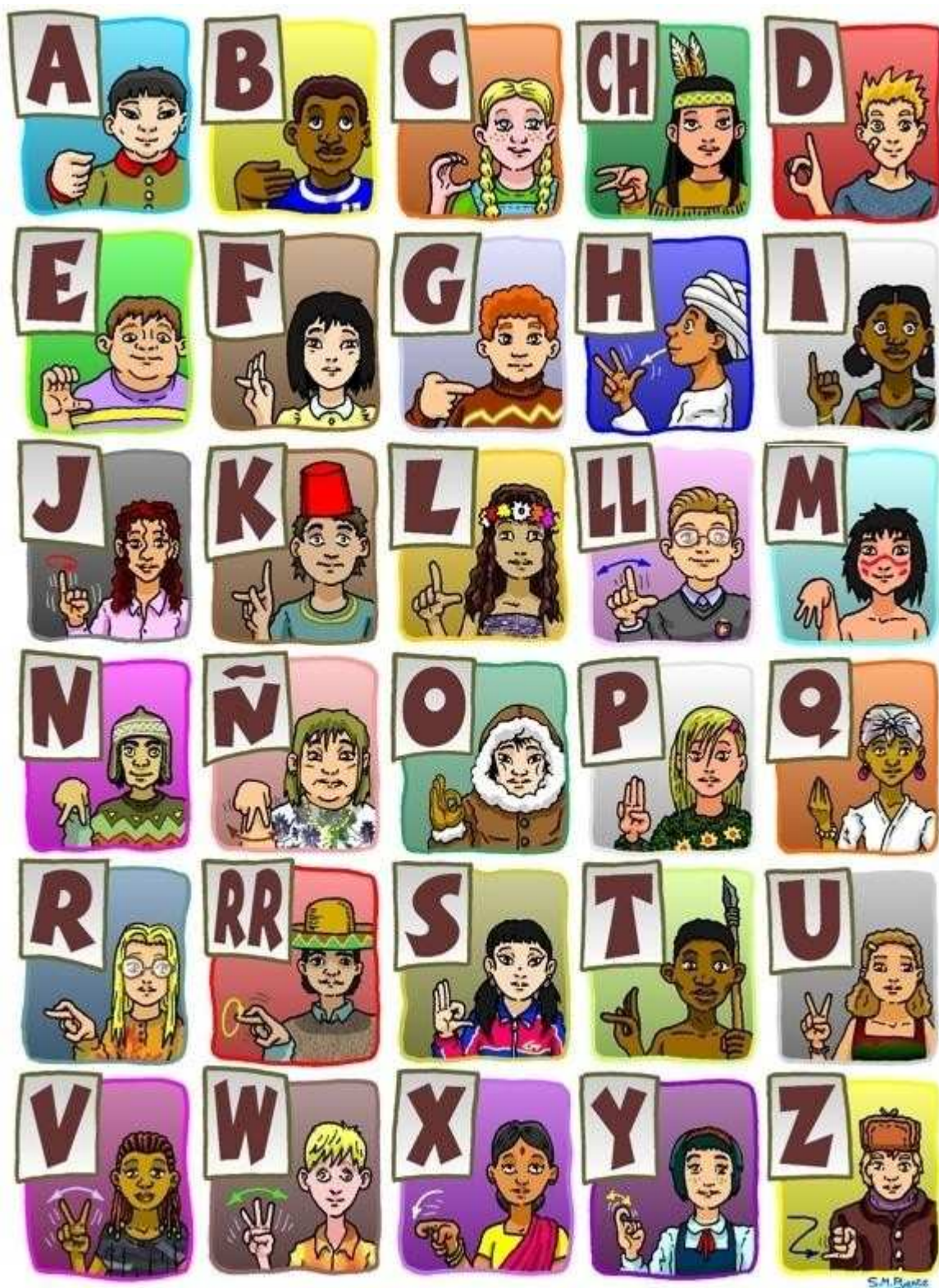
Figura 18: Alfabeto Dactilológico de la Lengua de Signos Española.