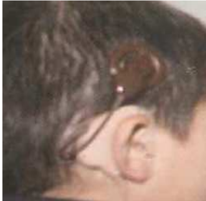
Figura 22: Implante Coclear.