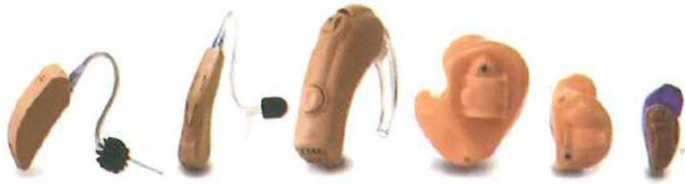
Figura 19: Diferentes modelos de prótesis auditivas.