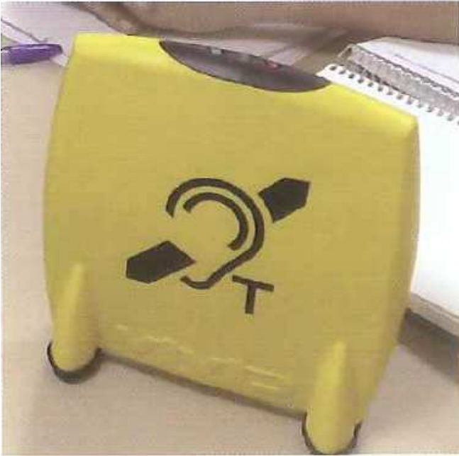
Figura 23: Sistema de inducción magnética (aro magnético).