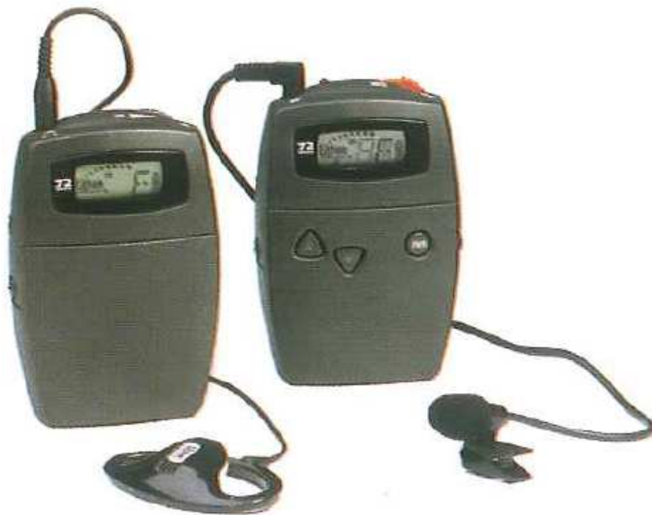
Figura 20: Sistema de Frecuencia Modulada.