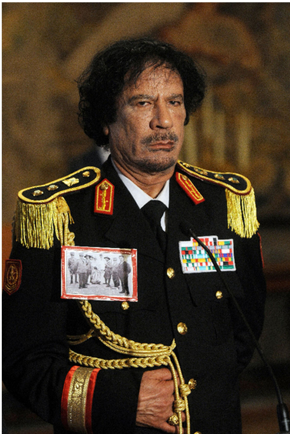
Figura 12. Retrato de Gaddafi en 2009 (extraído de “Gadafi no sufre ningún trastorno mental. Sabe muy bien lo que hace”, El País , 25 de febrero de 2011, https://elpais.com/internacional/2011/02/25/actualidad/1298588415_850215.html )