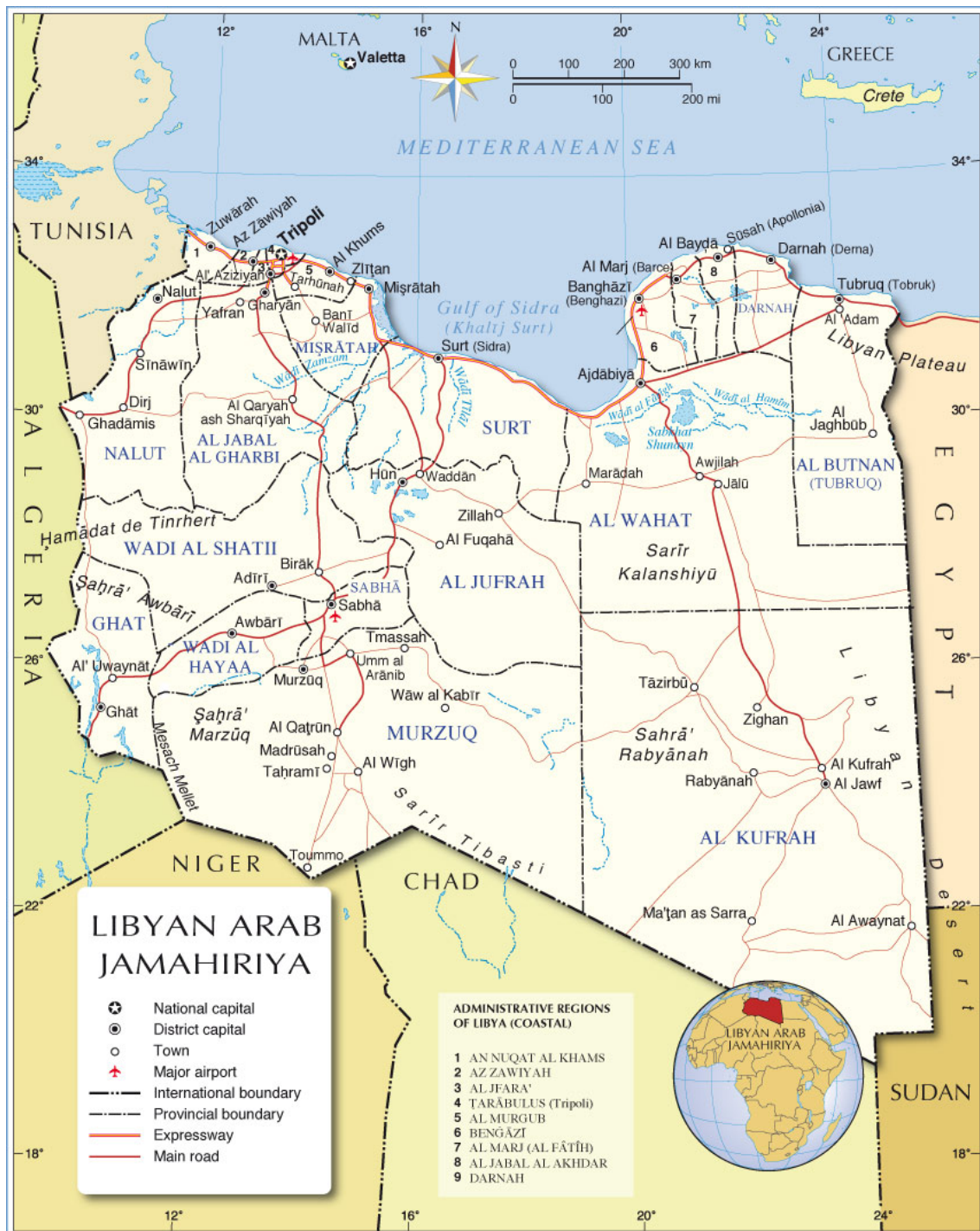
Figura 8. Chaabiyatos de Libia desde 2007 (extraído de “Administrative Map of Libya”, Nations Online, https://www.nationsonline.org/oneworld/map/libya-administrative-map.htm )