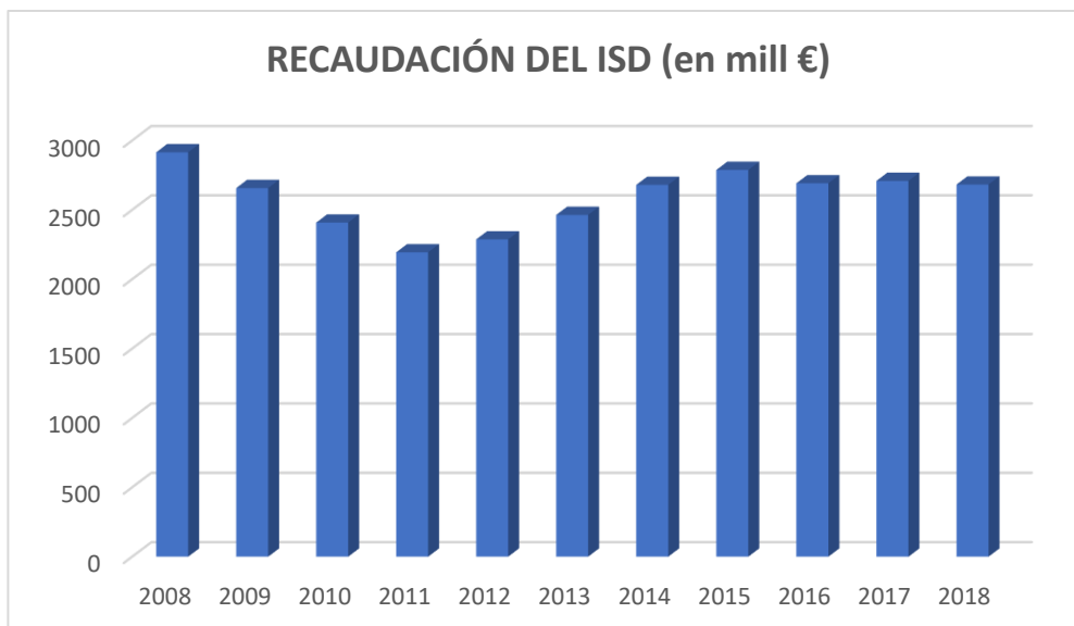
Gráfico 2. Recaudación del ISD 2008-2018.

Fuente: Elaboración propia a partir de los datos ofrecidos por el Ministerio de Hacienda.