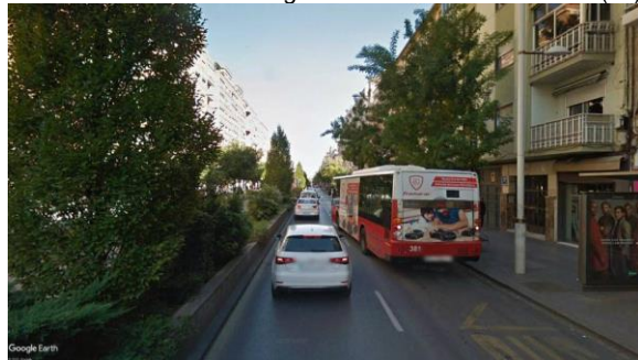
Imagen C: Camino de Ronda. (55)