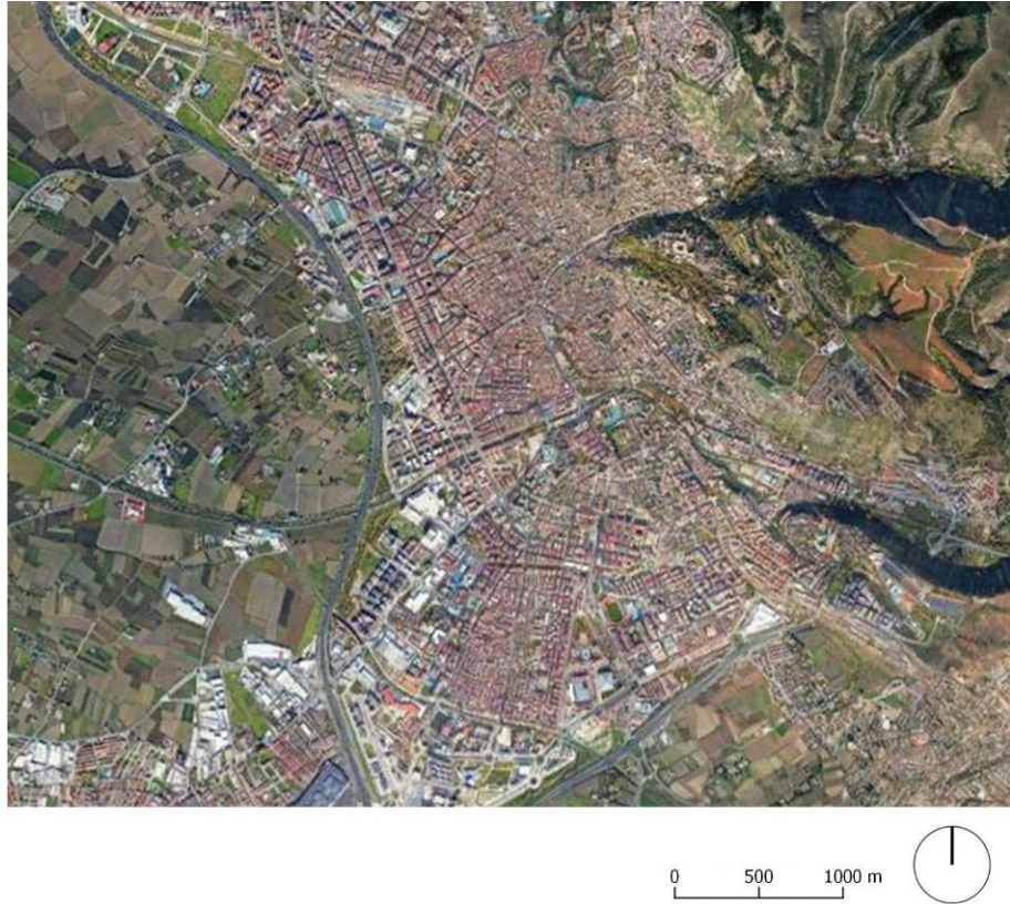
Figura 1: Vista aérea de la ciudad de Granada (España). (40)