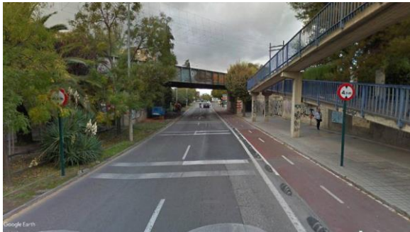
Imagen A: Avenida de Andalucía. (53)