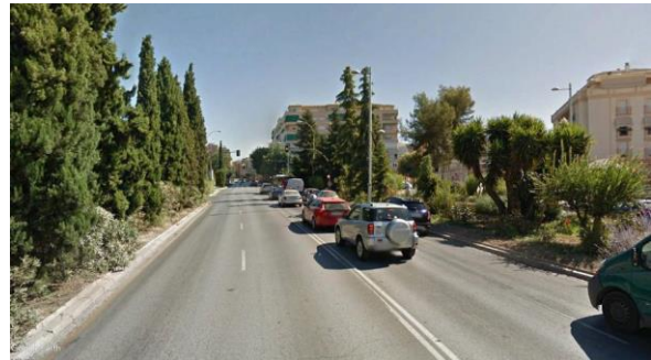
Imagen B: Avenida de Fuentesueva. (54)