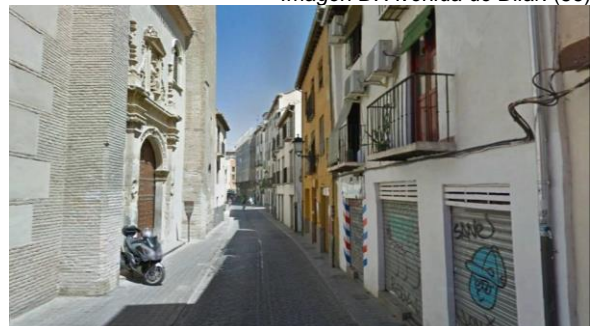
Imagen F: Calle Elvira. (58)

Las frecuencias descriptivas de la Tabla 3 mostraron que hubo un número levemente mayor de participantes hombres que mujeres, así como también fue ligeramente superior el número de \leq 23 años que > 23 años. Asimismo, el 69% de participantes no usaron la bicicleta para ir/venir al destino frente al 31% que sí la usó. Los participantes que más usaron la bici para el ir/venir al destino fueron hombres > 23 años; los que menos la usaron fueron mujeres \leq 23 años.