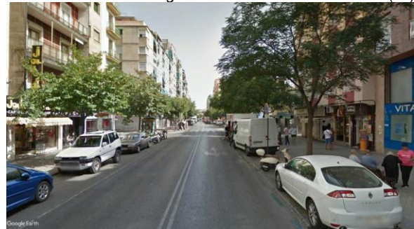
Imagen D: Avenida de Dilar. (56)