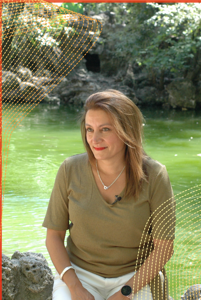
Isabel García Sanz Presidenta de la Federación Española de Salvamento y Socorrismo