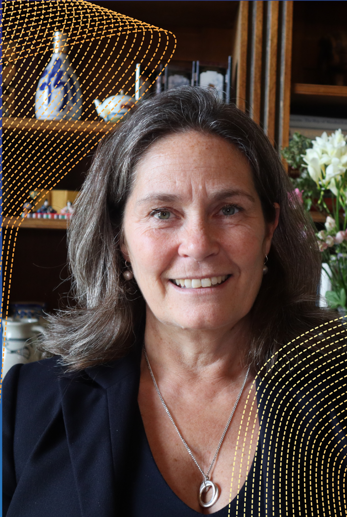
Natasha Dangerfield Presidenta de Lacrosse de Inglaterra