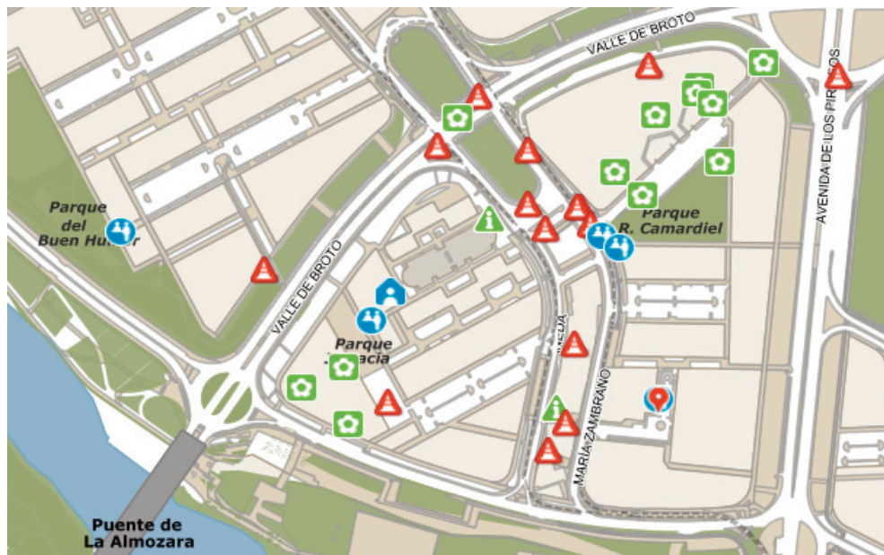
Figura 2. Mapa de Actur-Rey Fernando en la ciudad de Zaragoza.

La figura 2 muestra algunas necesidades detectadas en el distrito de Actur-Rey Fernando donde se identifican varias relativas a medio ambiente y sostenibilidad (verdes) y a movilidad (triángulo rojo).