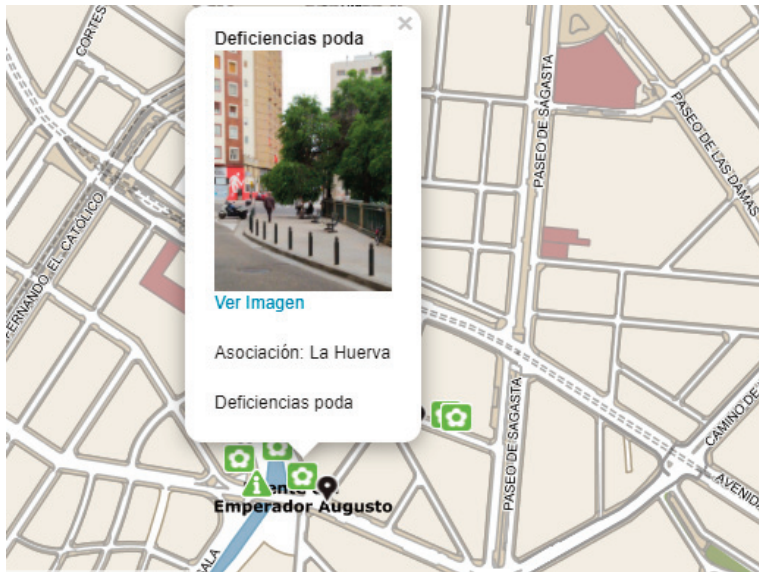
Figura 3. Mapa del distrito Universidad en la ciudad de Zaragoza.