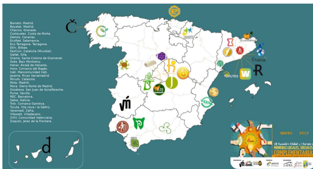
Figura 2: Mapa de monedas locales, sociales y complementarias en España.

En la primera parte del proyecto, se deberá decidir cuál es el tipo que mejor se adapta a nuestro contexto educativo y su uso pedagógico como herramienta de aprendizaje. En el siguiente mapa, se observan las MSC que funcionan en el Estado español: