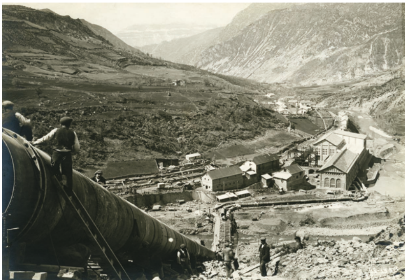
Ensamblaje de la tubería de presión de la central de Seira, construida entre 1912 y 1918. (Foto del 6 de abril de 1918, publicada en La aventura hidroeléctrica en el valle del Ésera , Huesca, DPH, 2012, p. 165. Colección particular).