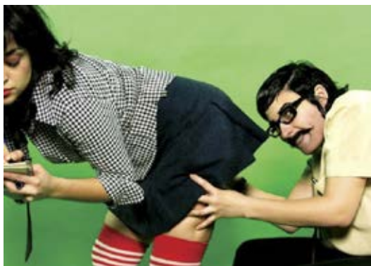
Figura 1 · Follarse la ciudad, 2009. Art project, técnica mixta, 34 x 67,5 x 51,5 cm. Imagen cedida por O.R.G.I.A.