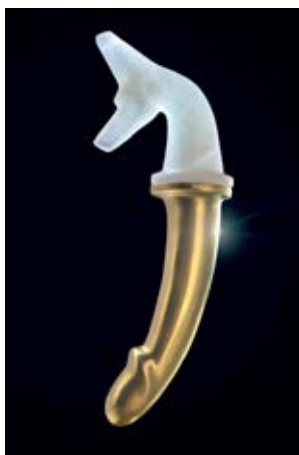
Figura 8 · La Faraona [sarcófago], 2017-2018, fotografía digital a color sobre duratrans siliconado tras metacrilato, caja de luz y caja de transporte, 234 x 97 x 28 cm.