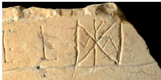
FIG. 2 y 3 - Fotografía de la pieza y detalle de la primera línea y del crismón