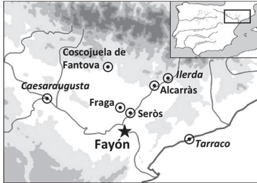
FIG. 1 - Localización de Fayón y otras localidades mencionadas