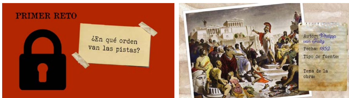
Figuras 2 y 3. Diapositivas de la presentación de “Arqueología para descubrir la Hélade”.

El centro educativo en el que se implementa la actividad restringe el uso de dispositivos digitales, por lo que en esta se limita al máximo los retos que puedan requerir la consulta, interacción o elaboración de productos en espacios virtuales y se opta por un modelo no tecnológico (Goethe, 2019). Una presentación con imágenes guía el hilo narrativo de la actividad y refuerza su componente de aesthetics . En ella se incluyen sonidos, recreaciones y fotografías de espacios y objetos arqueológicos que evocan una exploración arqueológica en territorio griego, además de elementos de diseño que marcan el ritmo y desarrollo de la actividad –cambio de un reto a otro o tiempo disponible para su resolución– (Figuras 2 y 3).