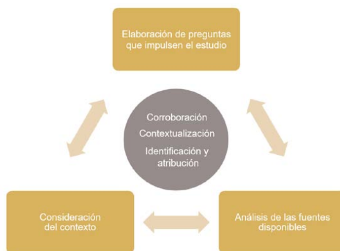
Figura 1. Modelo de procesos para el trabajo con fuentes de Seixas & Morton (2013), en el que se integran las heurísticas identificadas por Wineburg (1991b).

completo por tener en consideración el punto de partida del trabajo con fuentes –el establecimiento de objetivos de indagación–, así como por coincidir con los propios planteamientos de Wineburg (1991b), quien argumentaba que en el método histórico los objetivos de investigación permanecen indefinidos y sujetos a la valoración personal (Figura 1). Del mismo modo, Voet & Wever (2017) proponen un modelo similar al de Seixas & Morton (2013) para abordar la indagación histórica en el aula, incluyendo como heurísticas necesarias el planteamiento de preguntas, la formulación de hipótesis, el estudio de las fuentes y la elaboración de argumentos.