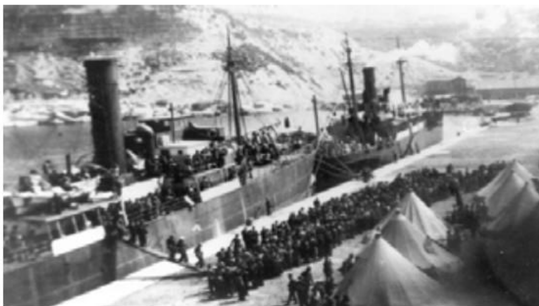
Puerto de Orán. Desembarco de los refugiados del Stanbrook (42)