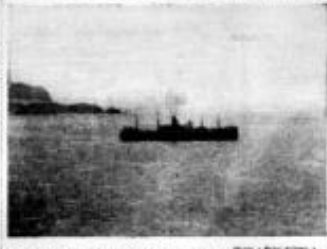
Le cargo « Sarracén », qui vient d'arriver au port de La Sénia, à bord duquel se trouvent 2.500 réfugiés.

L'après-midi. — Les journaux de la presse étrangère ont été très favorables à M. Lyautey, et qu'ils ont été très défavorables à M. Doumergue.