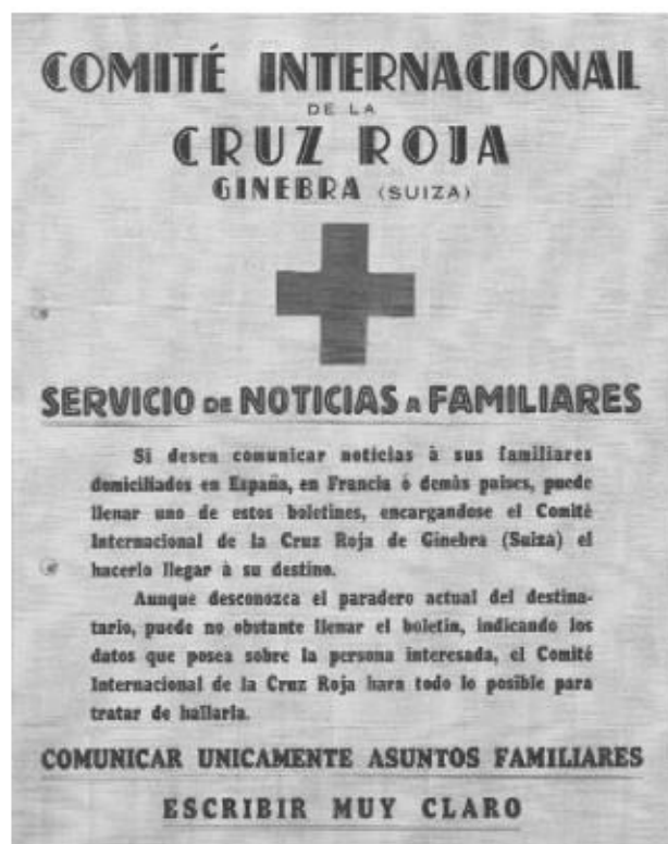
FIGURA 2. Cartel del Servicio de noticias a familiares de la Cruz Roja Internacional. CDMH, Fondo Cruz Roja, C-ESCI, exp. 167, documento n.º 218.