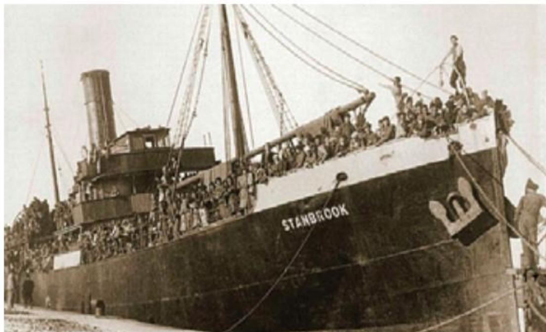
Puerto de Orán. Pasajeros confinados en el Stanbrook sin poder desembarcar (40)