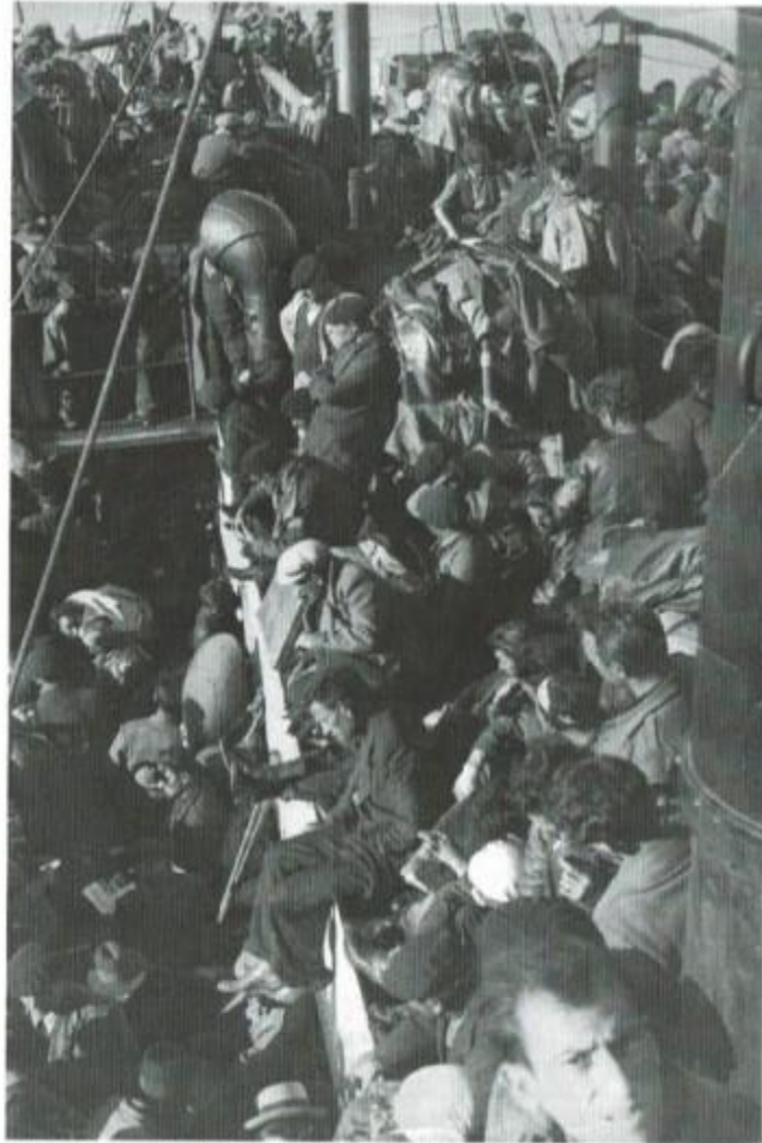
Refugiados en la cubierta del Stanbrook